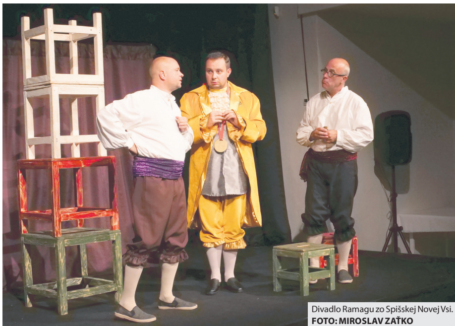
Divadlo Ramagu zo Spišskej Novej Vsi.