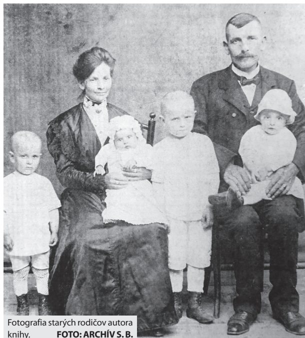
Fotografia starých rodičov autora knihy.