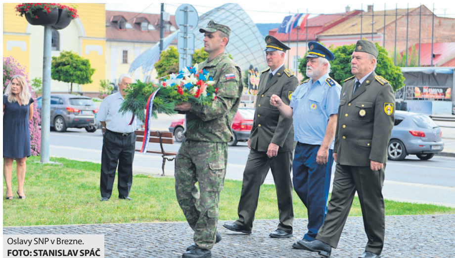
Oslavy SNP v Brezne.

Keďže Brezno bolo jedným z povstaleckých stredísk, hrôzy a krutosti vojny sa nevyhli ani jemu. „Mesto, ale najmä jeho vojenská posádka a vojenské sklady, sa stali centrom vyzbrojovania dobrovoľníkov z celého Horehronia a Gemera. Na Krtičnej sa vybuďovalo núdzové letisko, na Rázusovej ulici bola zriadená povstalecká poľná nemocnica a Brezno sa stalo sídlom štábu parti-