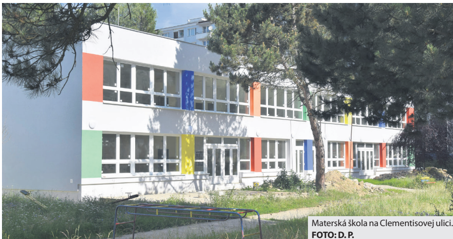
Materská škola na Clementisovej ulici.