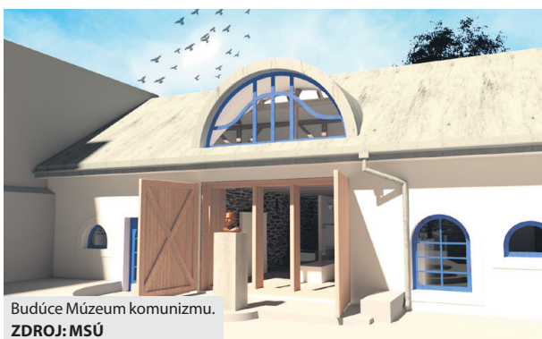
Budúce Múzeum komunizmu.

Vybudovaním Múzea komunizmu v Brezne chce samospráva zatriaktívniť centrum mesta a podporiť rozvoj cestovného ruchu v regióne. Obnova objektu bývalej cukrárne pod bránou vedľa mestského úradu mala byť dokončená v máji tohto roka, no z objektívnych príčin sa tak nestalo. „V rámci opatrení proti šíreniu koronavírusu sme nemali prístup k pracovnej sile ani k stavebnému materiálu, pretože bola zasta-