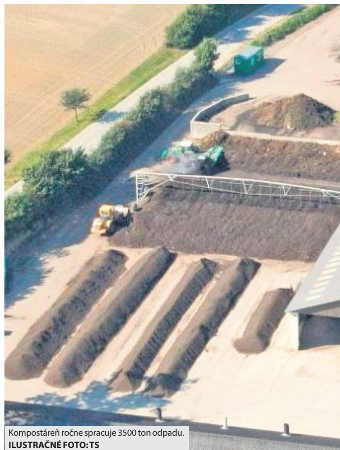
Kompostáreň ročne spracuje 3500 ton odpadu.

na prínos projektu primátor Tomáš Abel. V tejto súvislosti samospráva požiadala o nenávratný finančný príspevok na výstavbu mestskej kompostárne v predpokladanej výške viac ako 2 600 000 eur, pričom povinné 5 % spolufinancovanie mesta predstavuje sumu približne 130 000 eur.