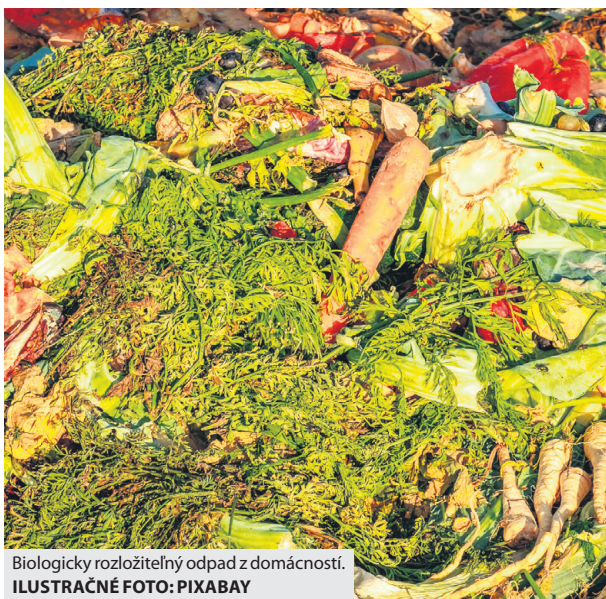
Biologicky rozložiteľný odpad z domácností.

Snahou breznianskej samosprávy je v súlade s platnou legislatívou zabezpečiť v rámci zberu komunálneho odpadu vyseparovanie biologicky rozložiteľných zložiek kuchynského komunálneho odpadu z rodinných a bytových domov a ich následnú ekologickú likvidáciu v kompostárni. Radnica preto pracuje na tom, aby malo Brezno vlastnú modernú kompostáreň, ktorá dokáže ročne spracovať až 3500 ton biologicky rozložiteľného odpadu - konárov z orezu drevín, trávy z kosenia aj zvyšky ovocia, zeleniny či