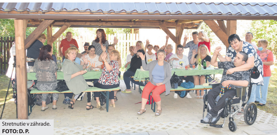
Stretnutie v záhrade.

V Brezne opätovne začalo fungovať denné centrum Prameň. Na vykonávanie aktivít využíva priestor záhrady, ktorú má k dispozícii. „Keďže pri spoločných činnostiach treba dodržiavať rozstupy, čo by v centre bolo organizačne náročnejšie, zvolili sme radšej túto alternatívu. V interiéri sa opäť stretneme v septembri, pretože júl a august sú prázdninové mesiace a tomu boli