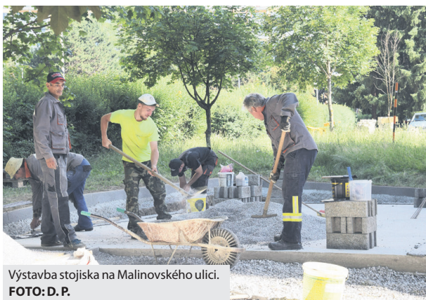
Výstavba stojiska na Malinovského ulici.

pre obyvateľov jednotlivých vchodov k dispozícii takto: