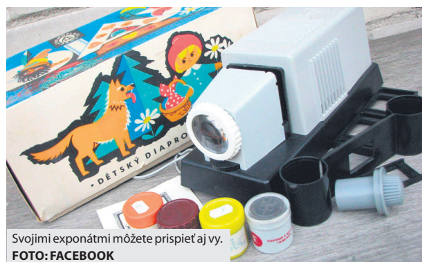
Svojimi exponátmi môžete prispieť aj vy.

Vynovený priestor bude pozostávať zo štyroch miestností, ktoré budú tematicky koncipované v duchu 60., 70., 80. a 90. rokov. Dôležité však