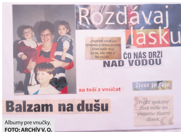
Albumy pre vnučky.