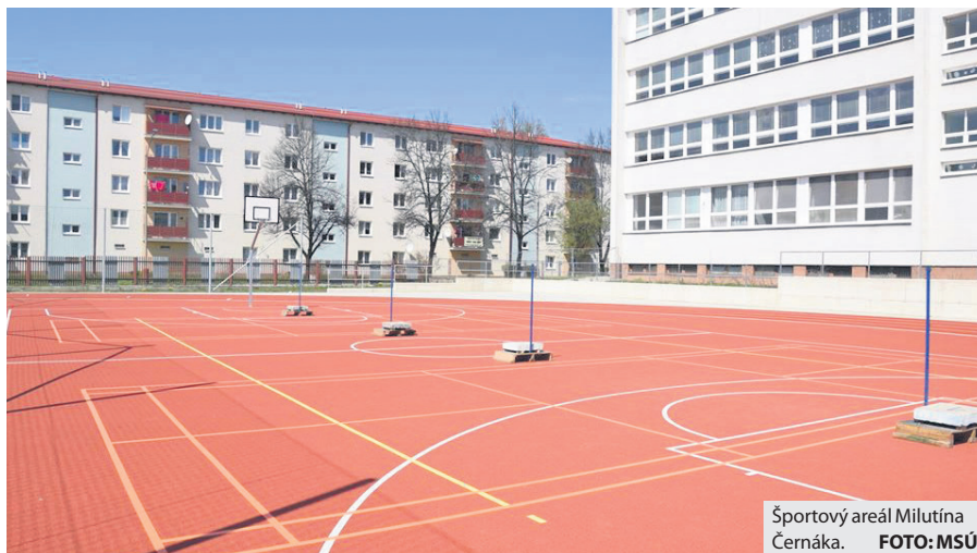
Športový areál Milutína Černáka.

v Športovom areáli Milutína Černáka k dispozícii dva vonkajšie bedmintonové kurty. „Žiadame návštevníkov, aby na vstup do areálu využívali oficiálny vchod, ktorý sa nachádza medzi budovou Pionierskej 2 a jej telocvičňou a neničili oplotenie školského areálu.“ Verejnosť sa musí vopred nahlásiť na e-mailovej adrese: martinikmichal@gmail.com alebo na t. č. 0905 068 320.