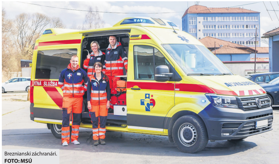
Brezňanskí záchranári.

riadenia Ministerstva zdravotníctva SR a odborníkov. Keď k nim prídeme, mali by mať nasadené tvárové rúško. Ak to situácia dovolí, tak prvotné vyšetrenie pacienta by sa malo vykonať na dobre vetranom priestore, komunikácia by mala prebiehať na cca 2 metre s obmedzeným počtom príbuzných. Posádka sa snaží cieľne a rýchlo odobrať krátku epidemiologickú anamnézu, či pacient bol v zahraničí, alebo či bol v kontakte s pozitívnym pacientom na ochorenie Covid-19. Prosíme o pravdivé informácie.