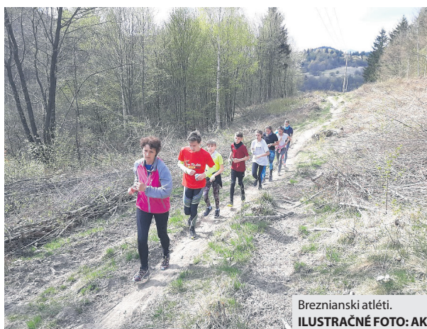
Brežňanskí atléti.

Pohybovú prípravu zvládli športovci z AK Brezno opäť online v domácom prostredí a to priamou komunikáciou v stanovený čas. „Keďže sú-