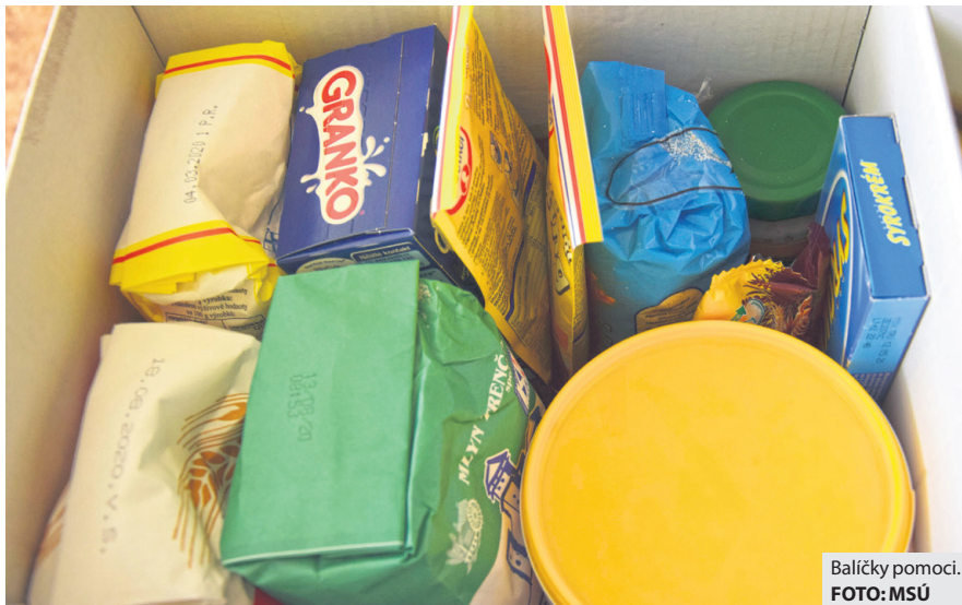
Balíčky pomoci.

sa nachádzali cereálie, čokoládovo-orieškový krém, horčica, chren, hladká, hrubá a polohrubá múka, syrokrem, zemiaky, cibuľa, vajcia, granko čokoládové, ovsené vločky a puding čokoládový, v pondelok 20. apríla rozviezli vozidlá sociálneho taxíka Slovenského Červeného kríža.