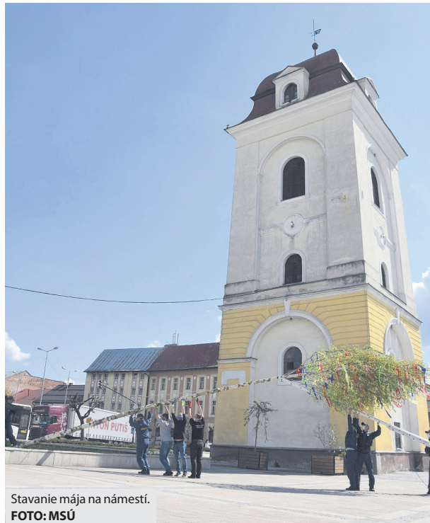
Stavanie mája na námestí.

Mesiac máj sa vo všeobecnosti považuje za obdobie lásky a zrodu nového života. Symbolom je aj strom „máj“, ktorý predstavuje zdravie a vitalitu pre všetky ženy a dievčatá z miest a dedín. Niekoľko metrov vysoký strom, väčšinou smrek alebo breza, ktorý sa zvykne ozdobíť stužkami, v predvečer prvého mája chlapci stavajú svojim vyvoleným dievčatám pod okná a má symbolizovať ich vážny záujem. Strom musí aj pekne vyzeráť, krivý alebo rozkošatený by bol rovnako hanbou pre dievča ako aj pre chlapca. Máje boli známe už v období staroveku, kedy ich ľudia dávali pred svoje domy ako ochranu pred zlými duchmi a chorobami. Máj symbolizoval víťazstvo jari nad zimou, poľnohospodárom mala májová zeľa zasa priniesť dobrú úrodu. Od 15. storočia sa stavali už aj v strednej Európe, v týchto končinách však slúžili ako