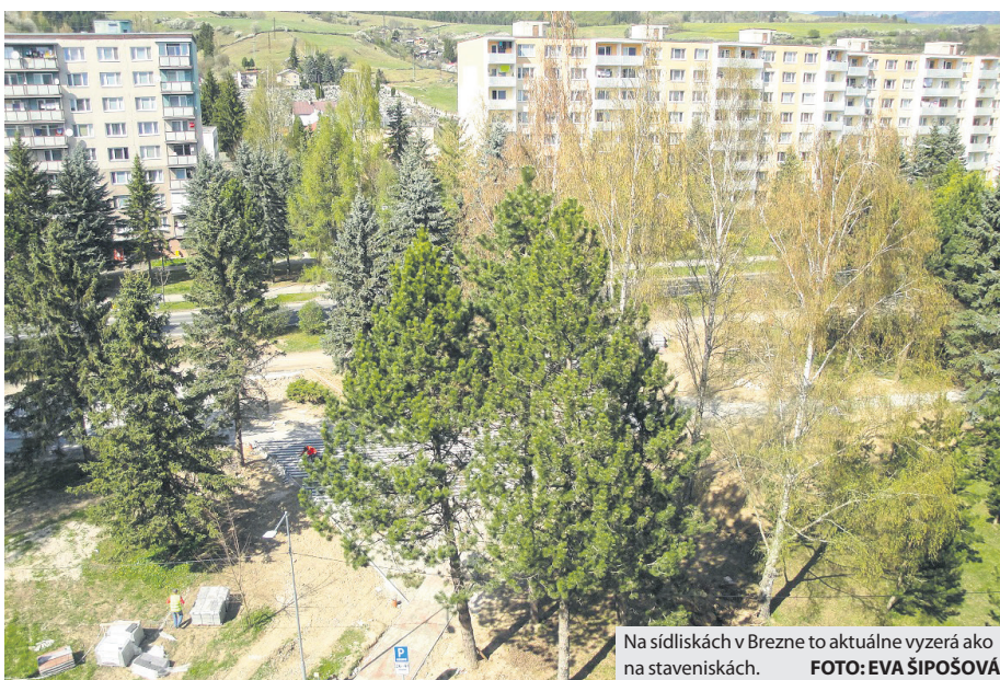
Na sídliskách v Brezne to aktuálne vyzerá ako na staveniskách.

Už vlani víťaz verejnej obchodnej súťaže začal s regeneráciou jedného z najstarších vnútroblokov v Brezne, Margitinho parku, a tento rok zahájil práce aj na sídliskách Malinovského, ŠLN a 9. mája. Vo všetkých by malo pribudnúť viac izolačnej zelene, ktorá zníži prašnosť a hluk a zároveň zvýši vlhkosť