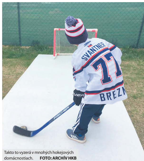
Takto to vyzerá v mnohých hokejových domácnostiach.