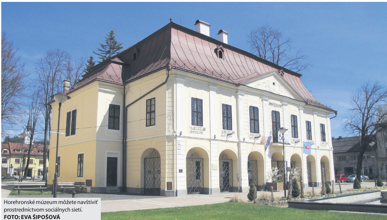
Horehronské múzeum môžete navštíviť prostredníctvom sociálnych sietí.