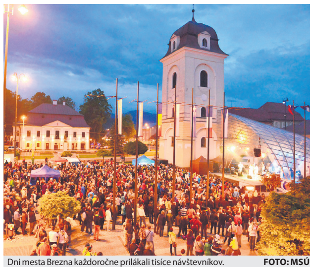
Dni mesta Brezna každoročne prilákali tisíce návštevníkov.