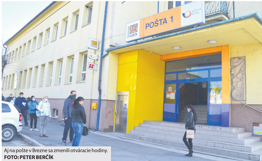
Aj na pošte v Brezne sa zmenili otváracie hodiny.

Ako informovala hovorkyňa Slovenskej pošty Eva Rovenská, zákazníkom odporúčajú návštevu pobočiek sa skôr vyhnúť a ak je to mož-