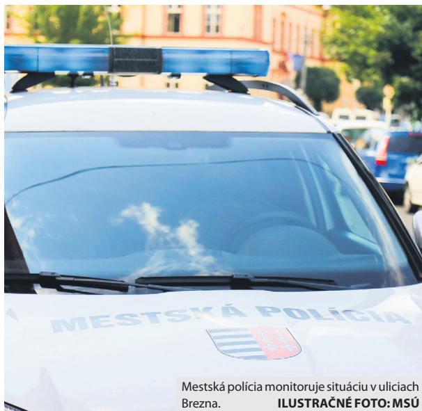
Mestská polícia monitoruje situáciu v uliciach Brezno.