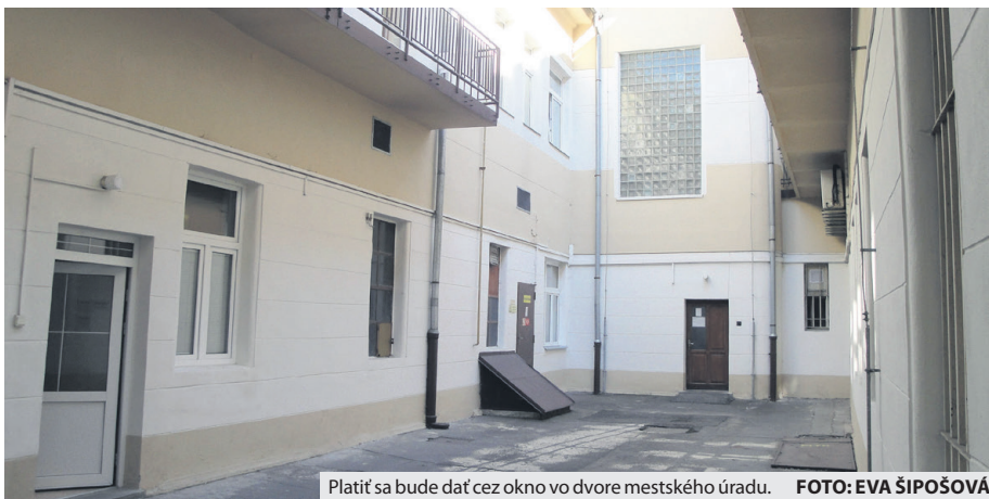
Platiť sa bude dať cez okno vo dvore mestského úradu.

Brežňanský magistrát sa rozhodol urobiť ústupok voči svojim obyvateľom, ktorí nedokážu komunikovať s úradom elektronicky. Po Veľkej noci od stredy 15. apríla budú môcť fyzicky zaplatiť svoje podlžnosti voči mestu v pokladni mestského úradu. Týka sa to však len tých, ktorí nemajú prístup