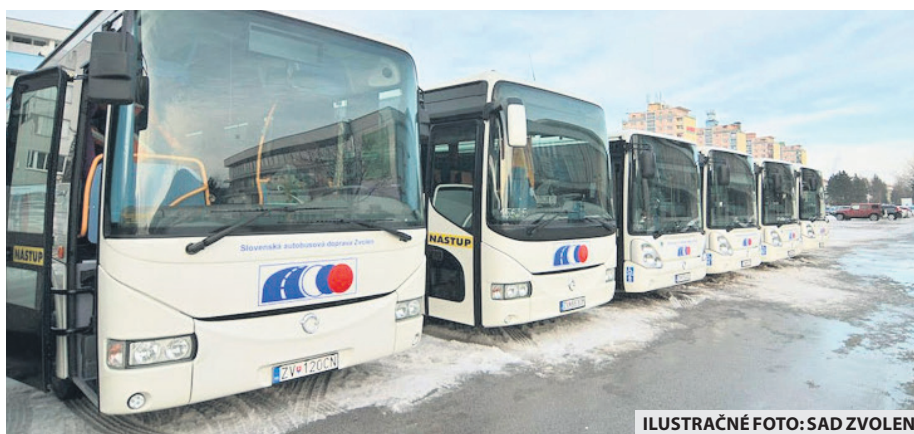
ILUSTRÁČNÉ FOTO: SAD ZVOLEN

Prímestská autobusová doprava po novom premáva v upravenom režime nazvanom Sobota Plus. Oproti prázdninovému režimu ubudli najmä spoje, ktoré nezabezpečovali prepravu do zamestnaní alebo nemocníc, ale napríklad do turistických destinácií (Srdiečko, Čertovica a pod.). „Tieto zmeny zavádzame spolu s dopravnými v súvislosti s ohrozením verejného zdravia II. stupňa ochorením známym ako Co-