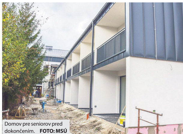
Domov pre seniorov pred dokončením.

V breznianskej mestskej časti Podkoreňová počas minulého roka dokončili komplexnú rekonštrukciu