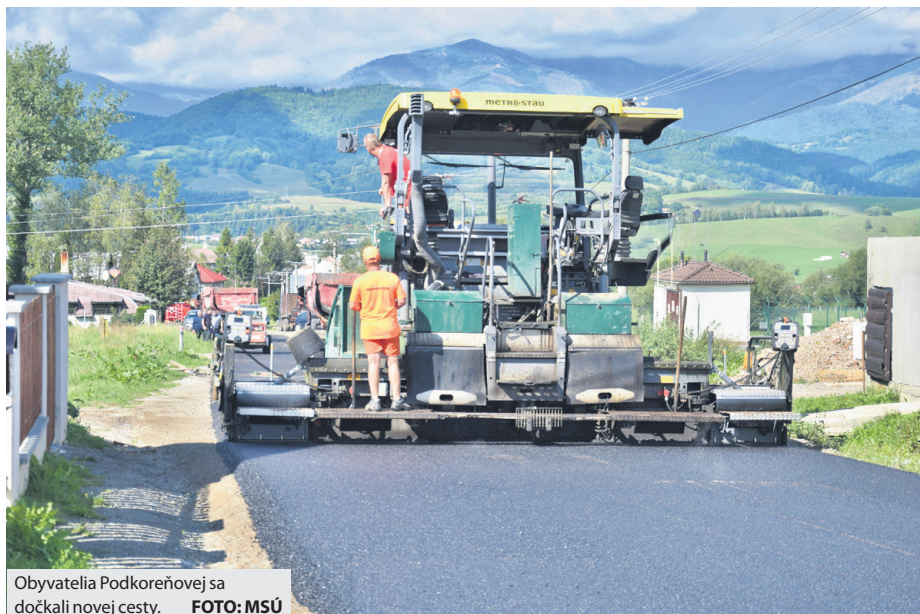
Obyvatelia Podkoreňovej sa dočkali novej cesty.

Zámer breznianskej radnice skvalitniť parkovanie v centre mesta sa po dlhých rokoch čakania konečne naplnil. V pondelok 26. augusta 2019 otvorili novú parkovaciu plochu pre 84 vozidiel, ktorá vyrástla na mieste legendárneho breznianskeho tankodromu. Súčasťou investície v hodnote približne 400 tisíc eur bolo aj rozšírenie príjazdovej komunikácie o prídavný pruh pre odbočenie vozidiel vrátane obnovy chodníka. Nové parkovisko je sprístupnené 24 hodín