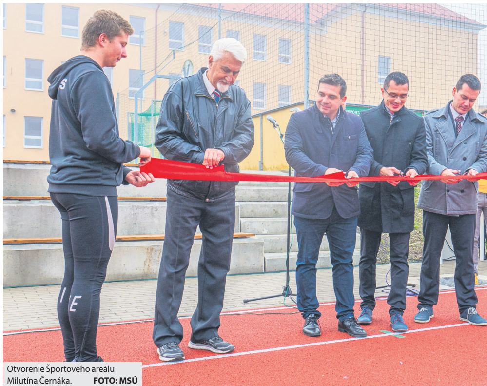
Otvorenie Športového areálu Milutína Černáka.

viac ako dvojkilometrového úseku miestnej komunikácie, ktorá sa svojej celoplošnej obnovy dočkala po neuveriteľných 46 rokoch. „Na 2,1-kilometrovom úseku sme kompletne vymenili lôžko a natiahli nový asfaltový koberec. Už predtým sme v tejto lokalite investovali do prípojok sietí pre rodinné domy a robíme mnohé protipovodňové opatrenia vrátane vybudovania nového rigola pre odvedenie dažďových vôd popri ceste,“ povedal primátor. Uplynulý rok sa podarilo obnoviť viaceré cesty a chodníky aj v iných častiach mesta a to na uliciach Nálepčova, prepoji Vránskeho - Moyzesova, ŠLN, Sládkovičova, Krčulova a Fučíkova.