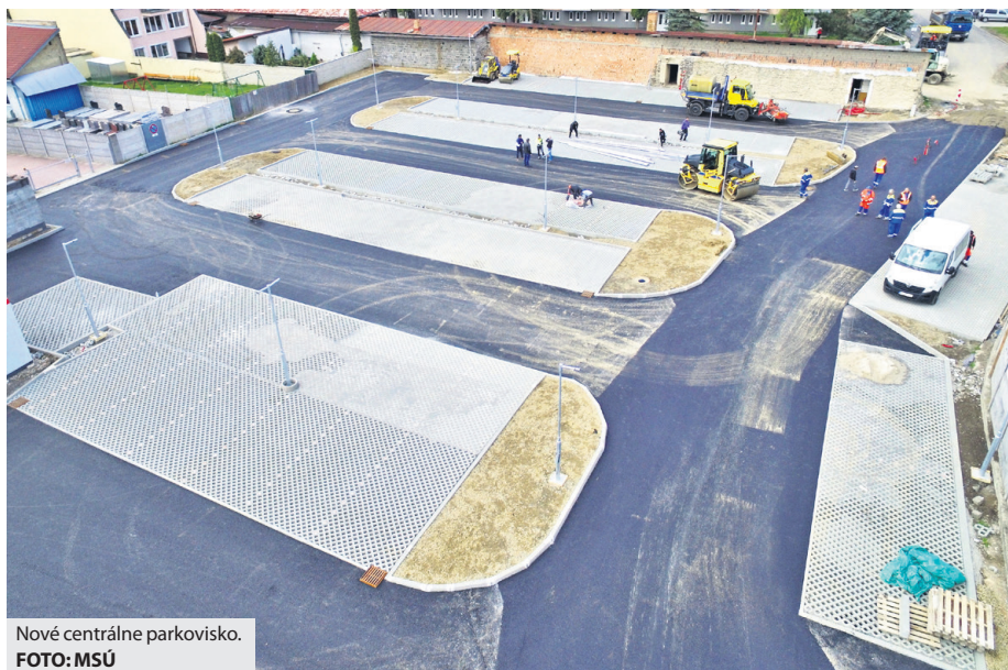
Nové centrálné parkovisko.