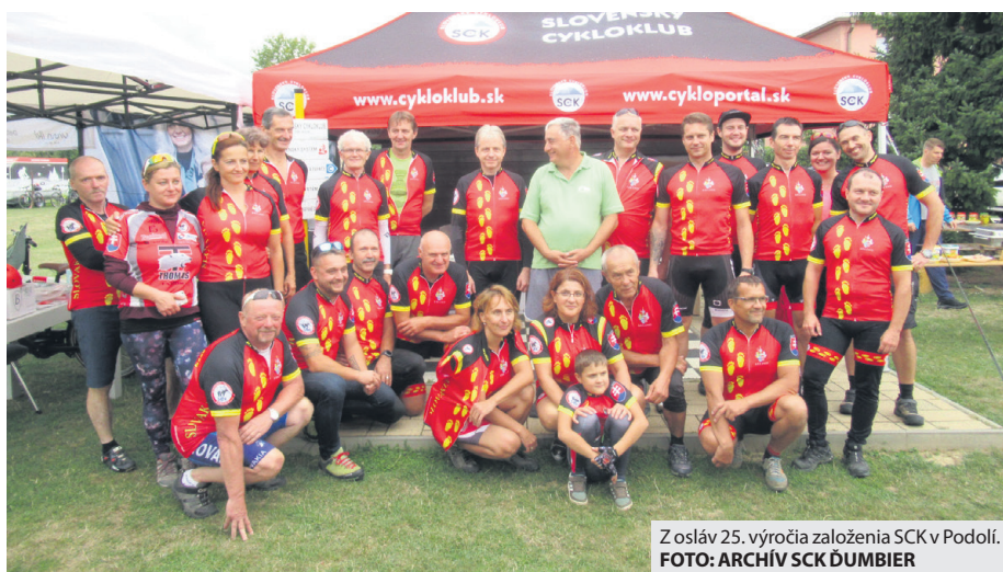
Z osláv 25. výročia založenia SCK v Podolí.

Ako náhle to počasie dovolilo, vytiahli sme bicykle a otvorili cyklosezónu Jozefovskou jazdou do Brusna. Po celý rok sme mali