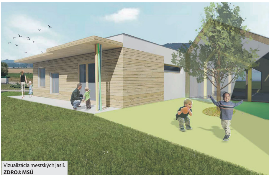
Vizualizácia mestských jaslí.