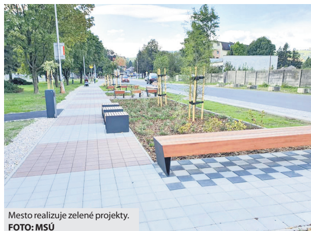
Mesto realizuje zelené projekty.

Mnohé samosprávy postupným prispôbovaním mestského prostredia reagujú na zásadné zmeny klímy posledných desaťročí. Aj Brezno sa pustilo do zelených projektov, ktoré majú zmierniť dopady otepľovania