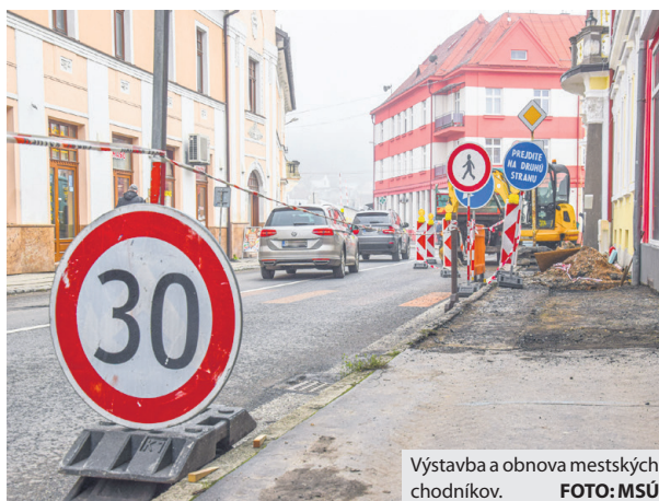
Výstavba a obnova mestských chodníkov.