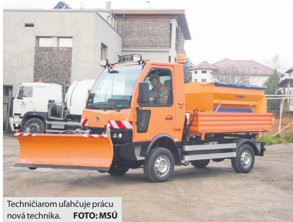
Techničiarom uľahčuje prácu nová technika.

projektu Zber a zhodnotenie biologicky rozložiteľných odpadov a drobných stavebných odpadov získalo pre Technické služby ďalšiu užitočnú techniku. Tentoraz išlo o dve nové zberové vozidlá a drvič drobného stavebného odpadu. Rovnako ako všetky samosprávy na Slovensku, aj tá breznianska sa musela prispôbiť ďalšiu údržbu všetkých miestnych komunikácií. Ku komunálnemu malotraktoru pribudlo v roku 2019 aj špeciálne viacúčelové vozidlo s celoročným využitím. V zimnej sezóne slúži