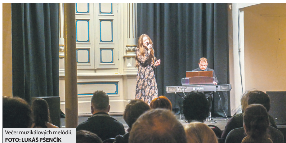
Večer muzikálových melódii.

lupráci s banskobystrickou Akadémiou umení, vďaka ktorému sa rozšírila možnosť kultúrneho vyžitia pre obyvateľov. Súčasne vznikol nový priestor na prezentáciu študentov a pedagógov. Umelci sa v synagóge predstavili aj minulý týždeň, kedy ponúkli Večer muzikálových melódii. Návštevníci si vypočuli piesne zo známych muzikálov Carmen, Evita, Madame de Pompadour, Jesus Christ Superstar v podaní desiatich speváčok s korepetítorom. (md)