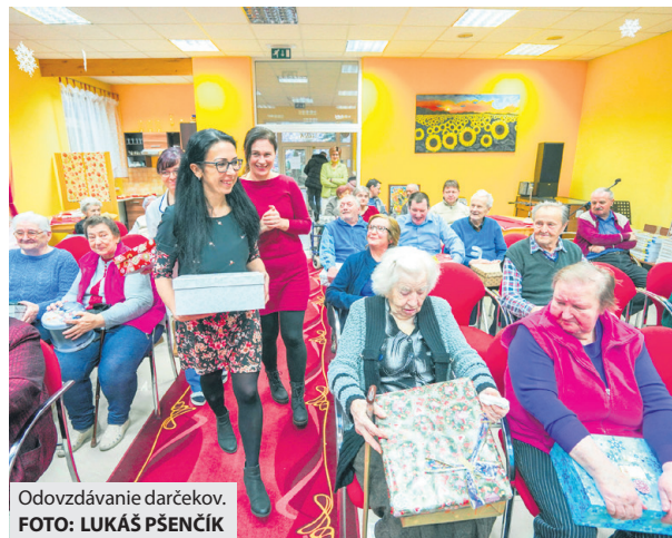
Odvodzovanie darčiekov.

te v Brezne začali pribúdať. „Nosili ich úplne cudzí ľudia, nielen z mesta, ale aj z okolitých obcí, z Čierneho Balogu až 74, ako aj deti z materských a základných