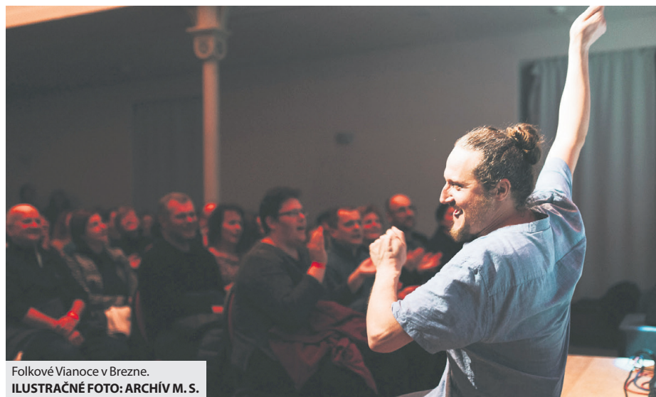
Folkové Vianoce v Brezne.

Tradícia ostatných ročníkov sa prenáša aj v podobe charitatívneho Drobného trhu. Ten bude prebiehať v oba dni od 9.00 do 17.00. V rámci témy festivalu dostali remeselníci a šikovné rúčky, ktoré prídu svoje produkty predávať na folkový miniblášak podmienku: výrobky budú výlučne z prírodných, recyklovaných, alebo aspoň recyklovateľných materiálov. Kúpou týchto produktov teda tiež podporíte myšlien-