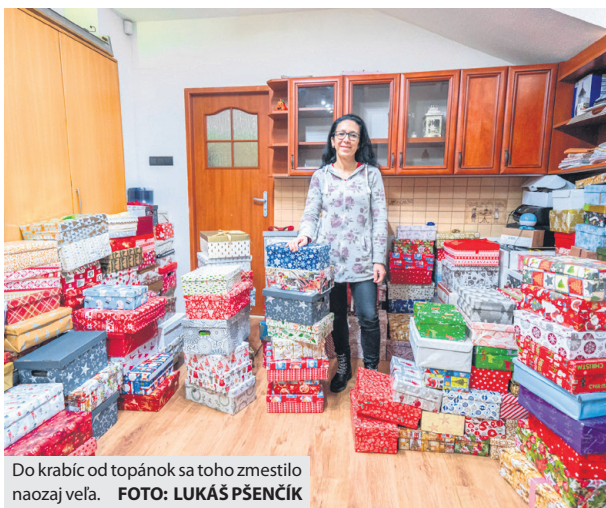
Do krabíc od topánok sa toho zmestilo naozaj veľa.

Do celoslovenskej zbierky sa zapojili aj Brezňania, pričom dobrovoľnou „am-