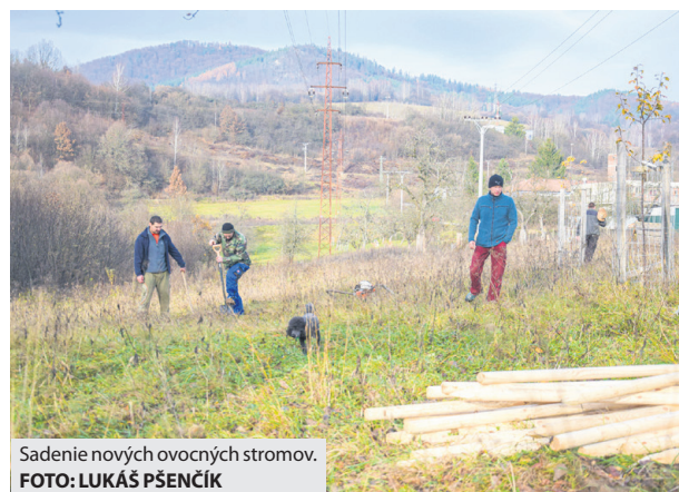
Sadenie nových ovocných stromov.