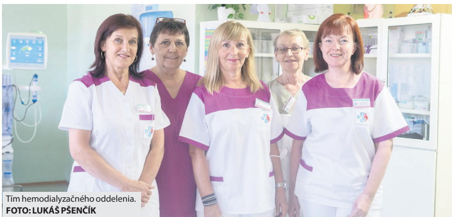
Tím hemodialyzačného oddelenia.

V Brezne využívajú dva spôsoby liečby – hemodialýza a hemodiafiltrácia akútneho a chronického, hemodiafiltráciu vo väčšine prípadov u stabilizovaných pacientov. „Začať dialyzačnú liečbu je možné len s dobrým cievnym prístupom. Pre potreby akútnej dialýzy, pri živote ohrozujúcich