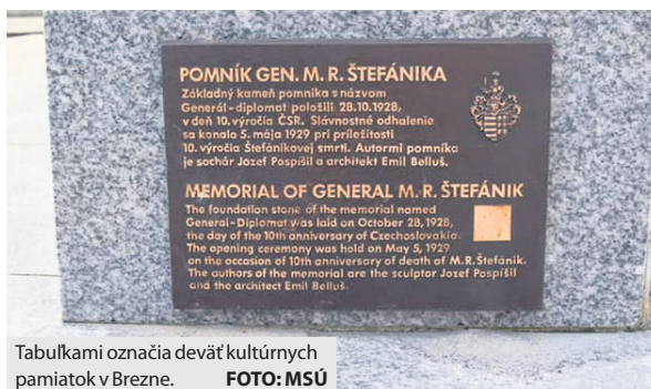
Tabuľkami označia deväť kultúrnych pamiatok v Brezne.