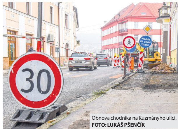
Obnova chodníka na Kuzmányho ulici.

Aktivisti však nezaspali na vavrínoch a v rozvoji a zveľaďovaní areálu pokračujú aj naďalej. Okrem pravidelného