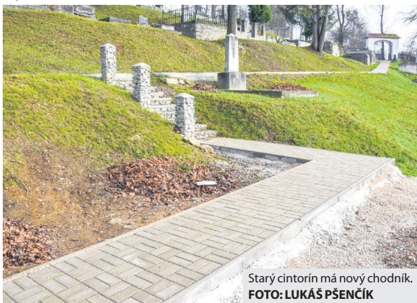
Starý cintorín má nový chodník.

povrchová a podpovrchová voda, ktorá natekala na predmetné územie, no v polovici novembra sa ich podarilo úspešne dokončiť. „Nedávno sme ukončili realizáciu nových hrobových miest na