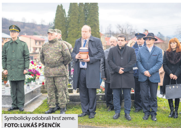
Symbolicky odobrali hrst' zeme.

si minútu ticha uctili i pamiatku 63 518 sovietskych hrdinov, ktorí za oslobodenie Slovenska a celej Európy zahynuli následkom „hnedého moru“.