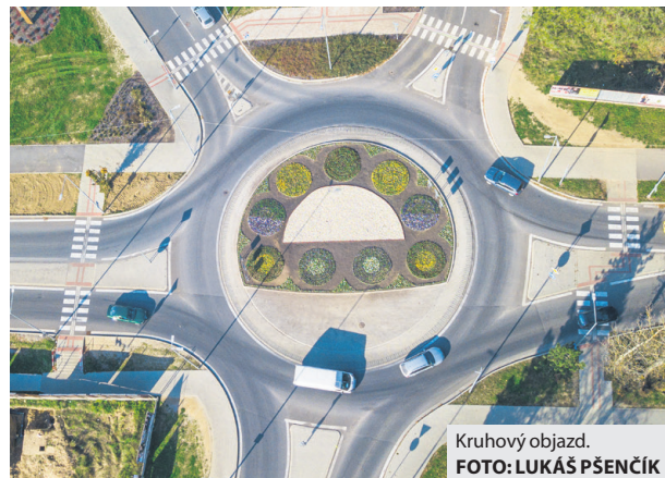
Kruhový objazd.