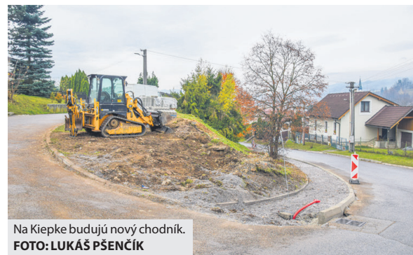
Na Kiepku budujú nový chodník.