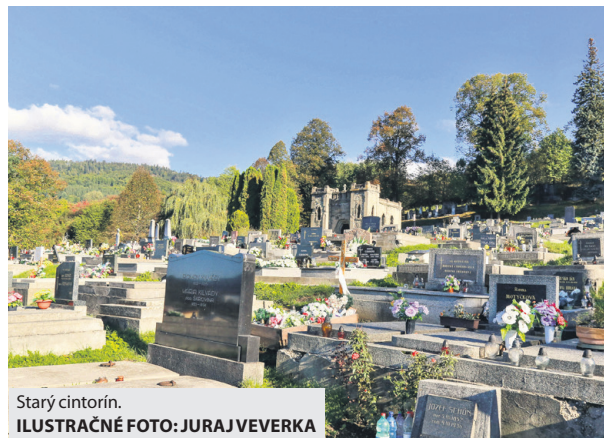
Starý cintorín.

Breznianska samospráva už koncom roka 2017 zrealizovala práce potrebné na prechod z pôvodného analógového kamerového systému na optický. Systém za takmer 180 tisíc eur pozostáva z digitálneho centra, z jednej stacionárnej kamery na mestskej polícii a desiatich otočných kamier na námestí, dome kultúry, železničnej a autobusovej stanici, zimnom a futbalovom štadióne, autobusovej zastávke pri Pointe a na sídlisku Mazorníkovo. Projekt vtedy finančne podporilo ministerstvo vnútra sumou desať tisíc eur. „Vzhľadom na mnohé podnety na rozširovanie monitorovacej siete v meste sme dospeli k záveru, že starý systém je potrebné nahradiť novým a moderným, ktorý bude možné priebežne me-