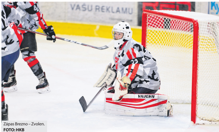
Zápas Brezno – Zvolen.

Do Brezna prišiel najväčnejší kandidát na postup do extraligy a na zápase to bolo od začiatku vidieť. Zaskočení domáci dovolili hosťom sa rýchlo ujať vedenia o dva góly. Zvýšeným úsilím sa domáci v druhej tretine dotiahli na rozdiel jedného gólu a mali šance aj na vyrovnanie. No po jednej z chýb im Zvolencania tesne pred koncom druhej tretiny odskočili opäť o dva góly. Do poslednej tretiny išli domáci rytieri zdramatizovať zápas, čo im ale efektívnejší súper nedovolil a po hrubých chybách