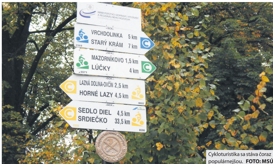
Cykloturistika sa stáva čoraz populárnejšou.

Poslanci schválili vybudovanie piatich cykloprístreškov na trase budujúcich cyklotrás. Záchytné parkovisko a stojany na bicykle sa budú nachádzať v Laznej – Banisku, pri nástupe na ferratu, na Rázusovej ulici, pri mini-golfu na Nábřeží dukelských hrdinov a pred ihriskom na Hronskej ulici. Na parkoviskách v Laznej – Banisko