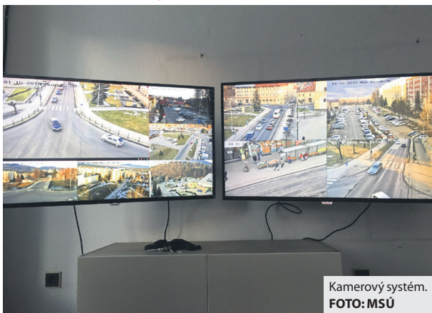
Kamerový systém.