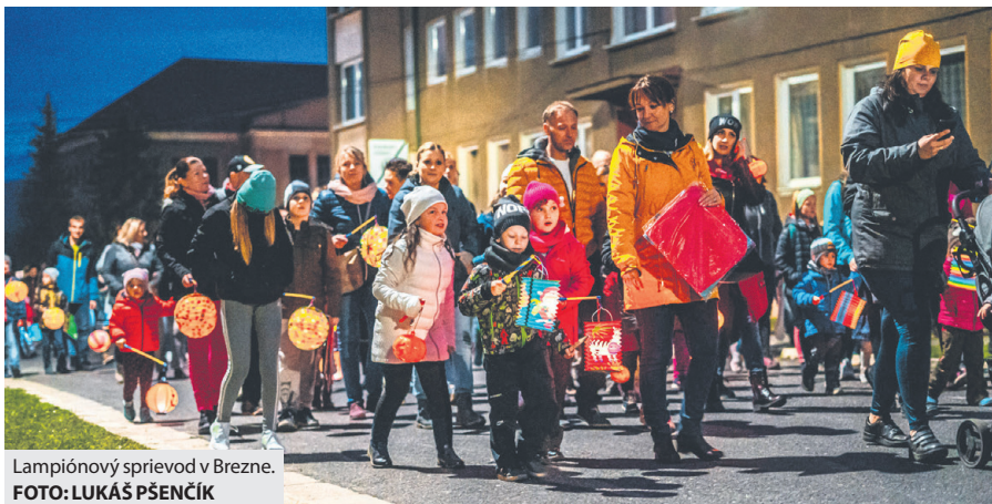
Lampiónový sprievod v Brezne.

Účastníci prešli v sprievode magických svetielok od Strednej odbornej školy techniky a služieb na námestie, kde na nich čakal príjemný program pod moderátorskou taktovkou Mareka Poliaka. Počas tohto jedinečného večera sa za mesto prihovoril vice-