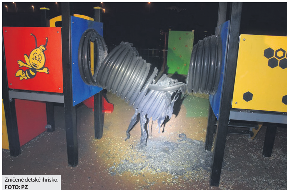
Zničené detské ihrisko.

„Trasa C 100 začne na križovatke s cestou I/66 – križovatka pri obchode Lidl, kde sa napája na Cyklotrasu C2, C5, C10 (žiadosť o NFP na túto cyklotrasu je v posudzovaní), bude pokračovať popri Kauflande, oblúkom po mestskej komunikácii smerom na Banisko, kde sa napojí na cyklotrasu Brezno – Valaská, za čerpacou stanicou Slovnafat,“ uzavrela Milada Medvedová. (md)