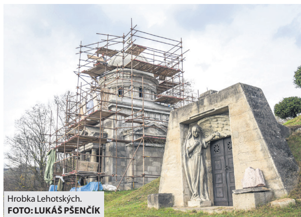
Hrobka Lehotských.