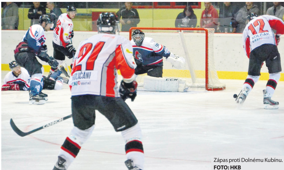
Zápas proti Dolnému Kubínu.

Zápas sa od začiatku vyvíjal podľa očakávania, Zvolen útočil a hostia umnou hrou hrozili z nebezpečných pro-