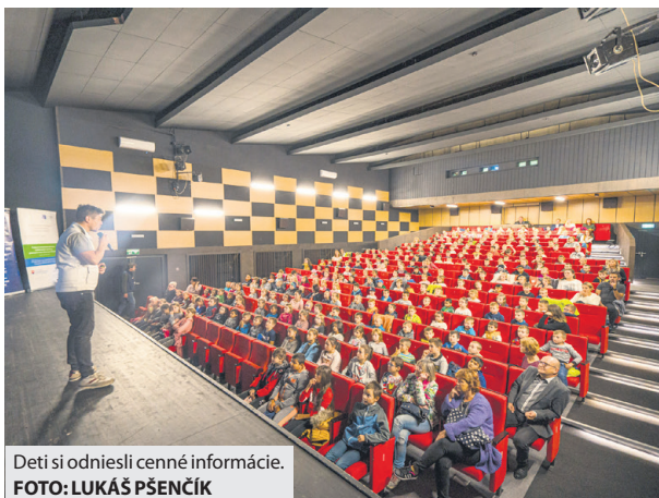
Deti si odniesli cenné informácie.

Aj napriek tomu, že patrí medzi najstaršie envirofestivaly na svete, do Brezna zavítal po prvýkrát až jeho 46. ročník. „Som rád, že aj v našom meste sme odvysielali filmy, ktoré zobrazujú dopad