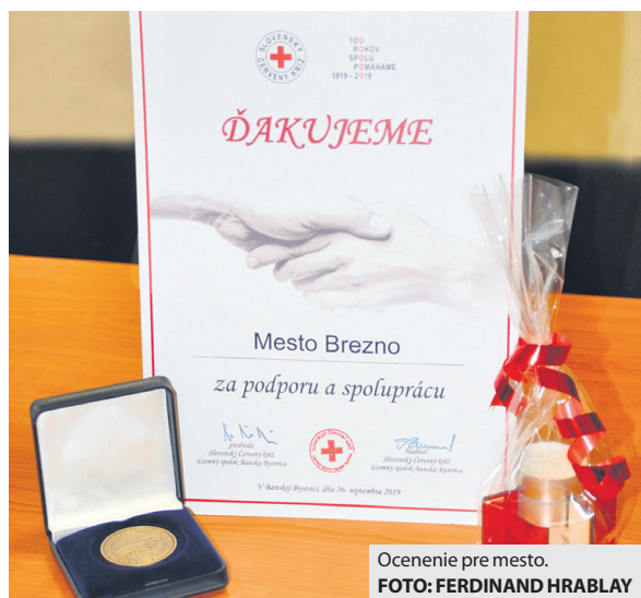
Ocenenie pre mesto.