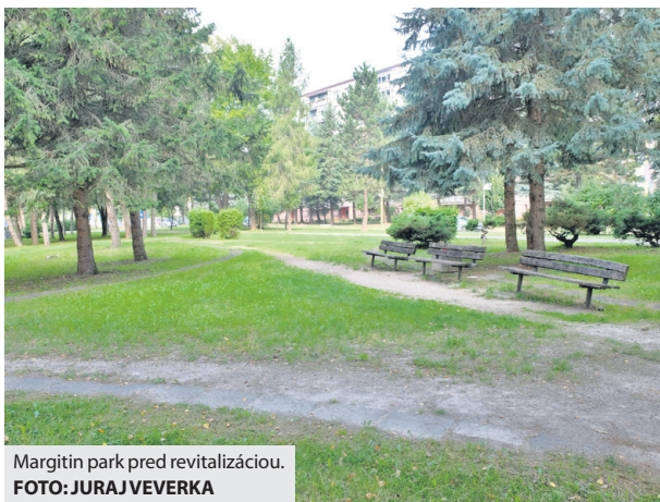
Margitín park pred revitalizáciou.

Projekt v celkovej hodnote 390 tisíc eur už začala realizovať vysúťažaná firma, ktorá najneskôr do mája budúceho roka upraví terén a existujúce dreviny, vysadí novú zeleň a záhony a vybuduje vodnú plochu s tryskami. „Momentálne tam prebiehajú základné úpravy, dodávateľ vytýčil miesta, kadiaľ povedú chodníky, dal dole ornicu,