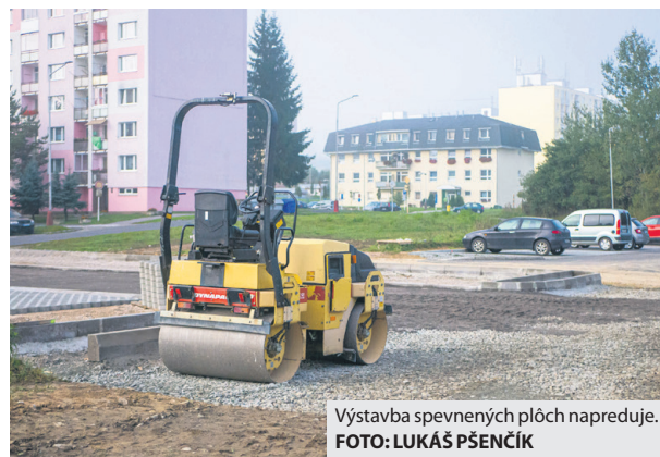
Výstavba spevnených plôch napreduje.

Technické služby Brezno na jar budovali spevnené plochy na Ulici 9. mája na Mazorníkove oproti potravinám a pokračujú vo výstavbe ďalších. Ako uviedol šéf techničiarov Lukáš Jeremiáš, výstavba zahŕňala prípravu terénu, oddrenážovanie a spevnenie podložia, asfal-