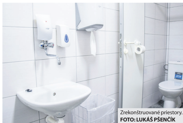
Zrekonštruované priestory.

Od sprevádzkovania telocvične však prešlo už tridsať rokov a počas nich sa jej technický stav postupne zhoršoval. „Sociálne zariadenia a príslušenstvo boli z dôvodu zastaranej elek-