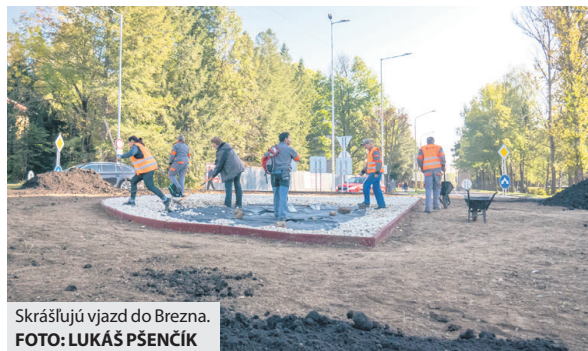
Skrášľujú vjazd do Brezna.