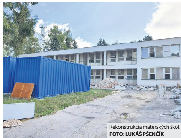
Rekonštrukcia materských škôl.