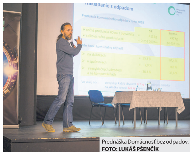
Prednáška Domácnosť bez odpadov.