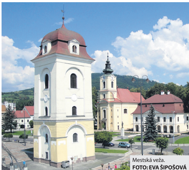
Mestská veža.