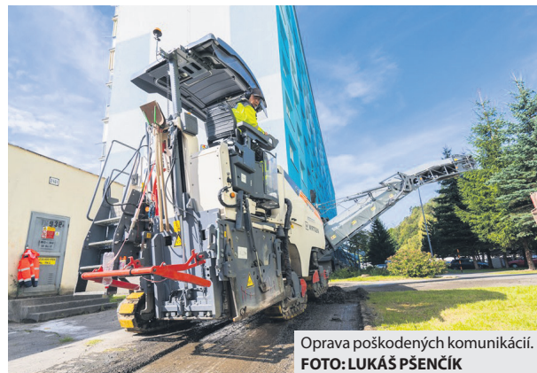
Oprava poškodených komunikácií.

Na všetkých miestach nasledovala ručná úprava a asfaltovanie, ktoré by malo byť hotové do troch maximálne štyroch týždňov. Všetko totiž