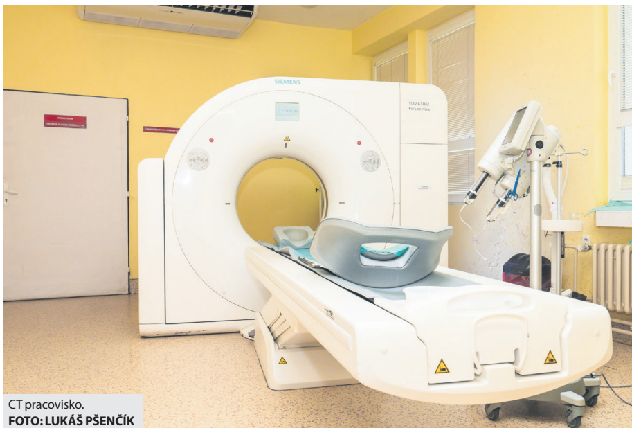
CT pracovisko.

Na oddelení podľa primára Mihálika fungujú tieto druhy pracovísk: klasickej rádiografické: RTG skeletu, pľúc, brucha, mäkké časti tela, vylučovacie urografie; USG: ultrasonografické vyšetrenia ce-