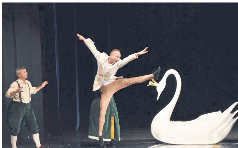
Škaredé káčatko.