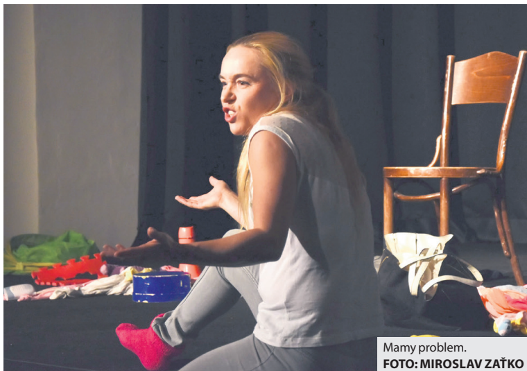
Mamy problem.

Jedno z najúspešnejších kultúrno-spoločenských podujatí v našom regióne je za nami. Už teraz sa priaznivci divadla môžu tešiť na to, čo organizátori Divadelnej Chalupky pre nich pripravujú o rok. (md)