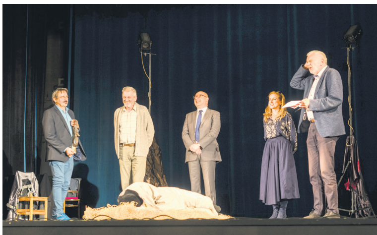
Otvorenie festivalu.