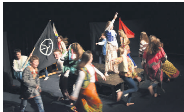
Smútok za Johnom Lennonom - inscenácia plná energie, nadšenia a dobrej hudby.