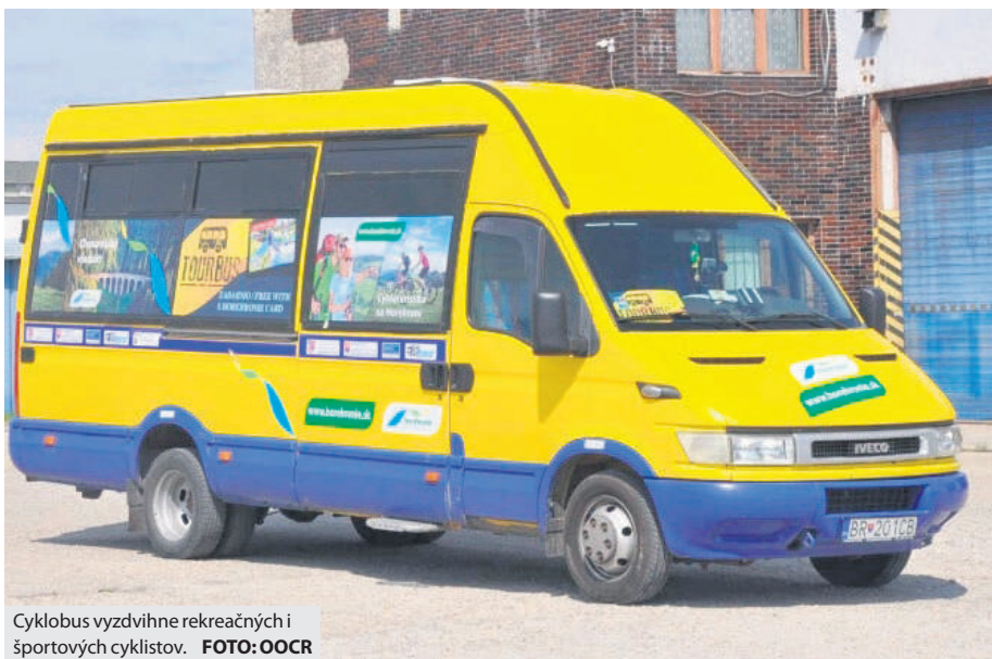
Cyklobus vyzdvihne rekreačných i športových cyklistov.

Cyklobus vyzdvihne rekreačných i športových cyklistov každú sobotu na novú trasu, odkiaľ so sprievodom vyjdú v ústrety najkrajším výhľadom na Nízke a Vysoké Tatry a Horehronské podolie, či skrz Muránsku planinu. Pohodlne, bez