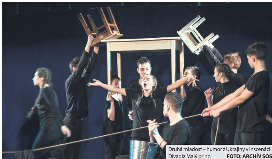
Druhá mladost' – humor z Ukrajiny v inscenácii Divadla Malý princ.

Vo štvrtok dopoludnia bude synagóga pripomínať obyčajnú triedu v škole. Čo všetko sa môže udiť počas