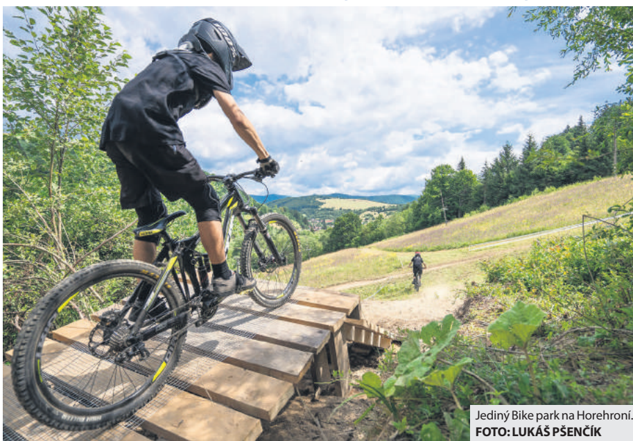
Jediný Bike park na Horehroní.

Kto sa zúčastnil na veľkolepom otvorení, mal možnosť vyskúšať si nový Bike park. Súčasťou bol pestrý sprievodný program s moderátorom Marekom Poliakom, nechýbal DJ