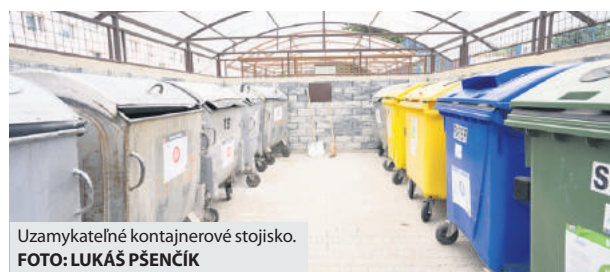
Uzamykateľné kontajnerové stojisko.

zarážajúce aj to, že nie vždy ide o násilné vniknutie do uzamknutých priestorov. „Dostali sa k nám informácie, že ich nechávajú otvorené samotní občania, alebo kľúče majú aj tí, pre ktorých nie sú určené. Ľudia tak ráno nájdu rozhádzané stojisko, cez ktoré sa niekedy nedá prejsť ani ku smetným nádobám.“