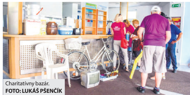
Charitatívny bazár.

tovaru obmedzený. No napriek tomu sa našli ľudia, ktorí do neho prispeli a venovali aj celý výťažok z predaja Dominike. Kúpajúci tiež prispeli finančnou čiastkou nad rámec ceny tovaru. Celkový výťažok bol len 50 eur, ale to nás neodradí a pokúsime sa bazár zorganizovať aj v budúcom roku. Veríme, že Brezňania nás podpora! V zbierke pre Dominiku budeme pokračovať aj v niektorom z ďalších podujatí mesta a výťažok z bazáru pripojíme k vyzbieranej čiastke. Dakujeme všetkým, ktorí sa zapojili a prispeli tak dobrej veci. (jl)