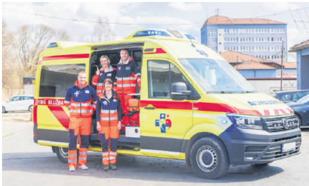
Záchraná zdravotná služba v Brezne.

Milí čitatelia, prinášame vám sériu článkov, v ktorých postupne predstavujeme jednotlivé oddelenia Nemocnice s poliklinikou v Brezne. Pokračujeme záchrannou zdravotnou službou, ktorá vlani absolvovala 8185 výjazdov. Najviac vyťažená bola RLP Brezno, a to z dôvodu, že v meste je jediná záchranka, ktorá musí riešiť všetky podnety, aj tie neindikované, a veľakrát dochádza aj k zneužívaniu ZZS.