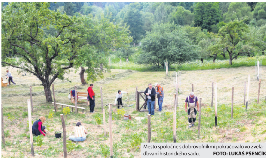
Mesto spoločne s dobrovoľníkmi pokračovalo vo zvelaďovaní historického sadu.