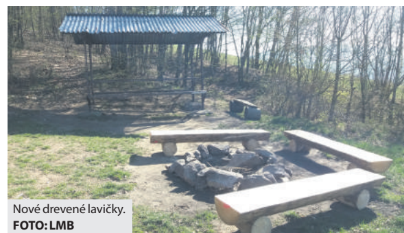
Nové drevené lavičky.