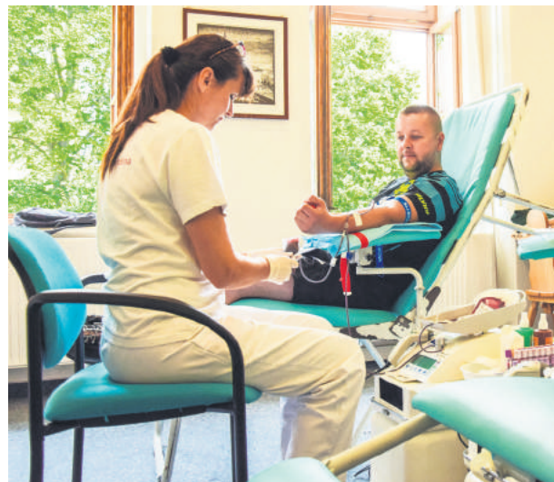
Dobrovoľníci v Brezne darovali 16 litrov krvi.