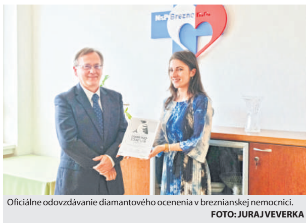
Oficiálne odovzdávanie diamantového ocenenia v breznianskej nemocnici.

Podľa Národného portálu zdravia sa počet ľudí, ktorí prekonalí cievnu mozgovú príhodu (CMP) v porovnaní s rokom 2007 zvýšil o viac ako polovicu. Porážka sa pri-