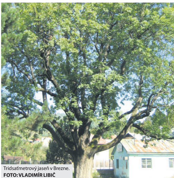
Tridsaťmetrový jaseň v Brezne.

V novodobej histórii mesta Brezna na tomto mieste bol v prevádzke hostinec, kolkáreň, dokonca na betónovom parkete pod „naším“ stromom hrala hudba a tancovalo sa. Súčasťou tohto areálu bol aj detský park. Tu