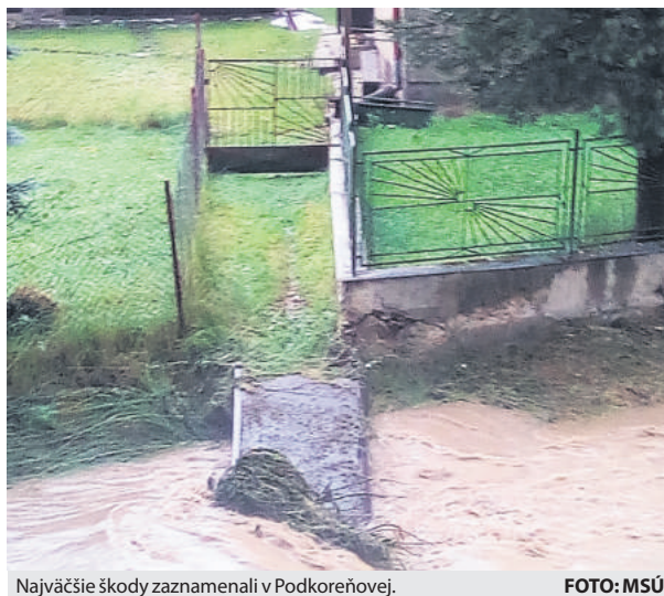
Najväčšie škody zaznamenali v Podkoreňovej.