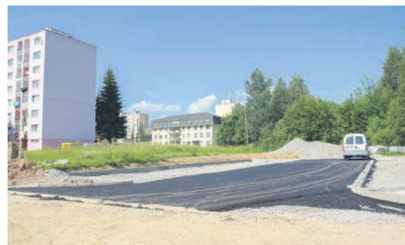
Na Mazorníkove vzniknú ďalšie parkovacie miesta.