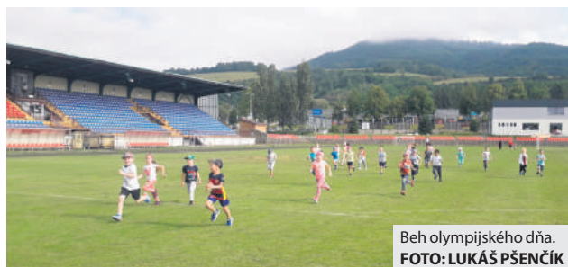
Beh olympijského dňa.