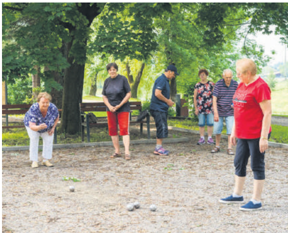
Seniori z Prameňa sa priúčali hre petang.

Petangové ihrisko sa nachádza v zelenom páse v blízkosti mosta pri že-