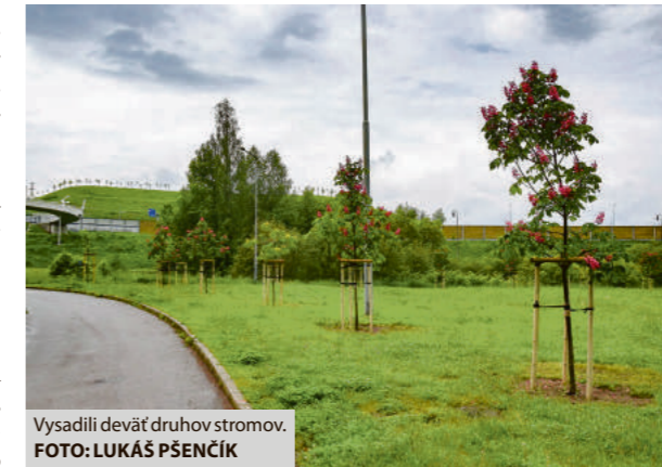
Vysadili deväť druhov stromov.

Dôležitá bola aj veľkosť výsadby – kvalita výsadbového materiálu. V Brezne vysadili agát biely, javor horský, javor červený, driev obyčajný, jablňo okrasnú, magnóliu, pagaštan pletový, hrab obyčajný a dub červený. Stromy vysadili, alebo ešte tak urobia v lokalitách Štvrť Ladislava Novomestského, dopravné ihrisko,