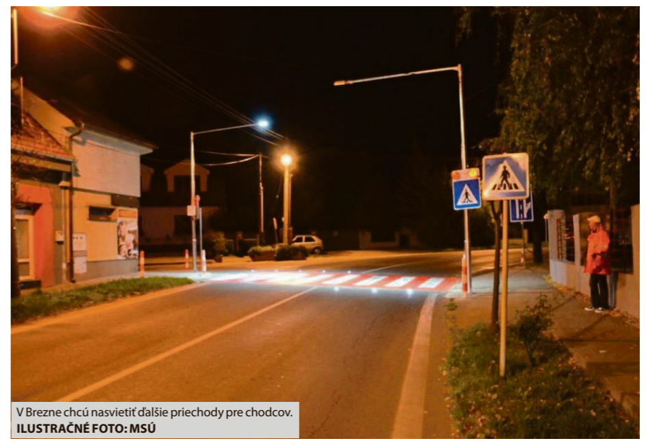
V Brezne chcú nasvietiť ďalšie priechody pre chodcov.