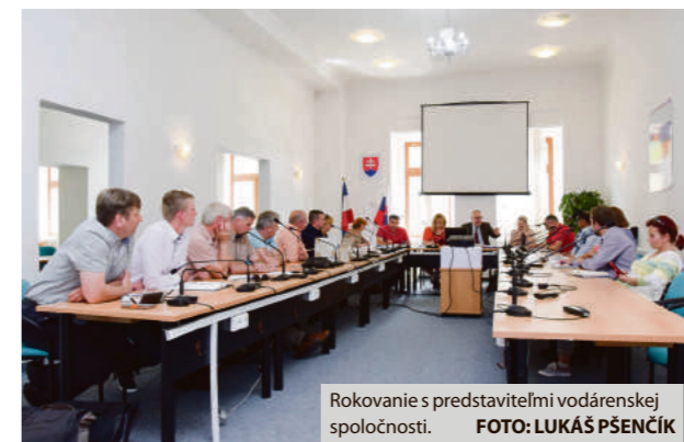
Rokovanie s predstaviteľmi vodárenskej spoločnosti.

Stalo sa vám niekedy, že ste otočili vodovodný kohútik a z roztrubia vytiekla v lepšom prípade hrdzavá a v tom horšom žiadna voda? Čo ste urobili ako prví? Volali na mestský alebo obecný úrad? Tak patrite