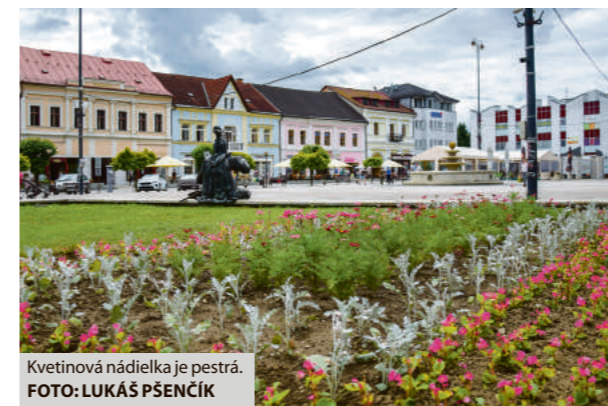
Kvetinová nádielka je pestrá.

Technické služby Brezno skrášlili mesto aj kvetinovou výzdobou, ktorú tvoria surfínie, muškáty, netýkavky, petúnie, begónie, georgíny, kapucínky, papučky, smradušky, nechtíky hortenzie, cínie a iné obľúbené letničky. Podľa slov