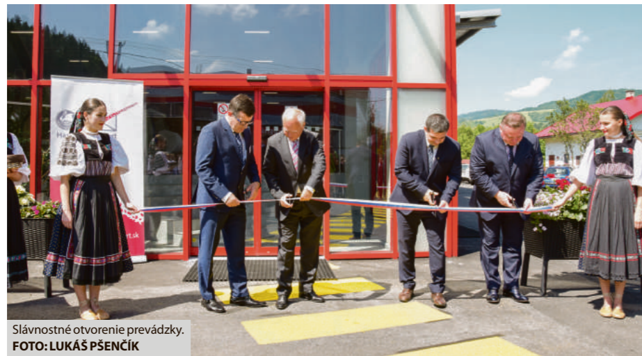
Slávnostné otvorenie prevádzky.

Spustenie novej prevádzky je odpoveďou na silnejúci dopyt zákazníkov a predajcov po ekologických formách obalových materiálov, ktoré postupne nahrádzajú neekologické plastové tašky.