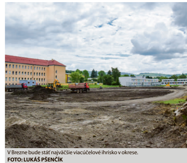
V Brezne bude stáť najväčšie viacúčelové ihrisko v okrese.

Ako dodal na záver, výstavba s kolaudáciou potrvá štyri až päť mesiacov. (md)