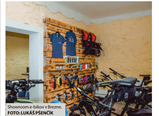
Showroom e-bikov v Brezne.

pre cyklistov a miesto, kde sa milovníci bicyklov môžu dozvedieť tipy na cyklovýlety a všetky dôležité informácie o možnostiach cyklistiky v regióne Horehronie. Záujemcovia si priestory showroomu môžu pozrieť každý pracovný deň od 8.00 do 16.00 a počas víkendu individuálne podľa objednávky. Objednať e-bike si môžete priamo aj cez rezervačný systém na stránke www.cyklo.horehronie.sk. (oocr)