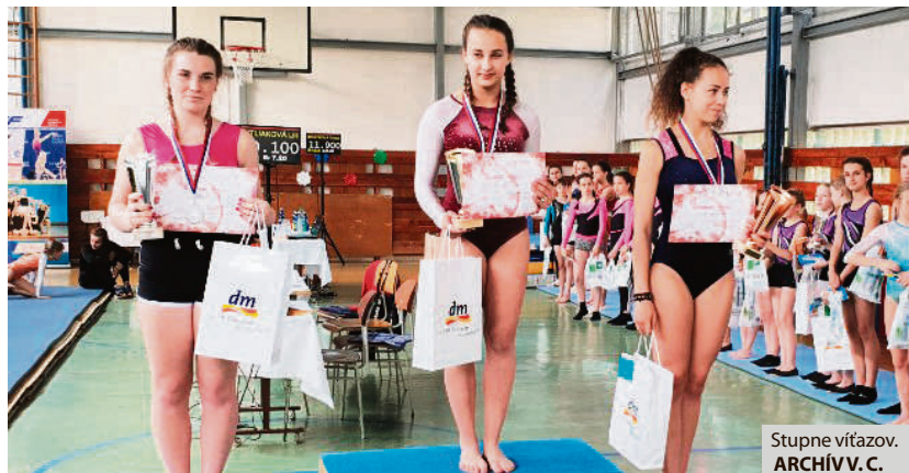
Stupne víťazov.