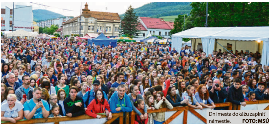
Dni mesta dokážu zaplniť námestie.