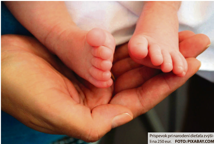
Príspevok pri narodení dieťaťa zvýšili na 250 eur.

Príspevok pri narodení dieťaťa štandardne slúži ako nástroj na podporu rodičovstva na celoštátnej úrovni. Breznianska samospráva sa už pred tromi rokmi rozhodla ísť nad rámec tejto pomoci a prijala právnu úpravu, ktorá umožňuje rodinám po splnení stanovených podmienok požiadať o finančné prostriedky, ktoré im majú pomôcť lepšie zvládnuť novú životnú situáciu. Od roku 2016 mesto vyplatilo jednorazový príspevok pri narodení dieťaťa 358 rodinám, pričom ich počet každoročne narastal približne o 30 žiadateľov. Viac ako 70 tisíc eur, ktoré doteraz na tento účel uvoľnilo mesto zo svojej pokladnice, považuje primátor Brezna Tomáš Abel za veľmi dobrú investíciu. „Zámerom