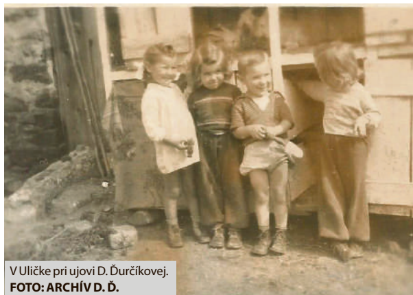
V Uličke pri ujovi D. Ďurčíkovej.