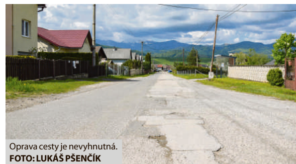
Oprava cesty je nevyhnutná.

m až 1 m v celej dĺžke a šírke cesty 6 m. „Výbudujeme tiež rigol a nový asfaltový povrch. Celková výška investície je 650 tisíc eur,“ dodal primátor. Oprava začala v pondelok 20. mája a potrvá asi tri mesiace. (md)