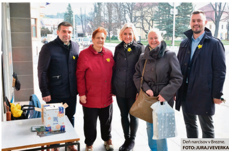
Deň narcisov v Brezne.

Liga proti rakovine finančné prostriedky vyzbierané počas Dňa narcisov použije na pokračovanie v realizácii overených a užitočných projektov, ktoré sú určené na priamu pomoc onkologickým pacientom a ich rodinám. Z výnosu Dňa narcisov sa pravidelne podporujú aj aktivity v oblasti prevencie a informovanosti verejnosti o predchádzaní onkologickým ochoreniam. Časť získaných zdrojov sa poskytuje i na obstaranie nevyhnutného prístrojového vybavenia nemocničným, zdravotníckym zariadeniam,