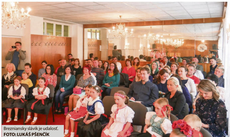
Brezniansky slávik je udalosť.

Deti oblečené v slovenských ľudových krojoch, v sprievode hudobných nástrojov, boli odvážne, vôbec sa nehanbili vystúpiť pred publikom a spievať. Zbaviť sa trémy im pomáhali aj tri rozprávko-