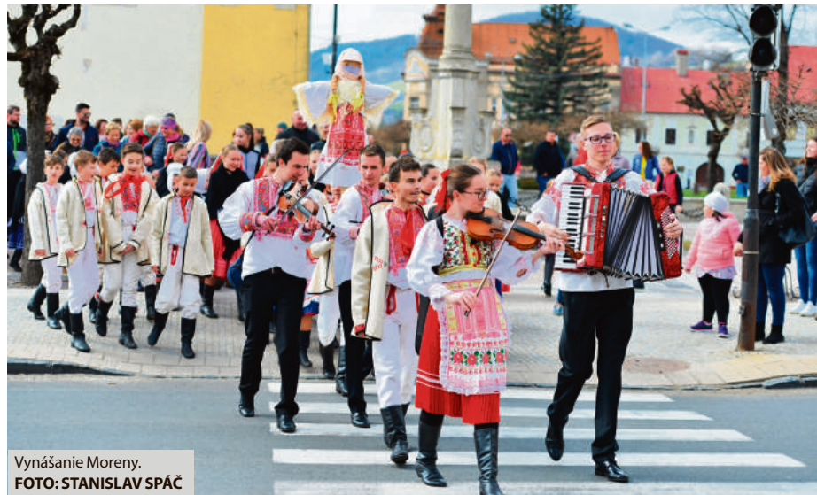
Vynášanie Moreny.