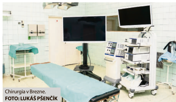
Chirurgia v Brezne.