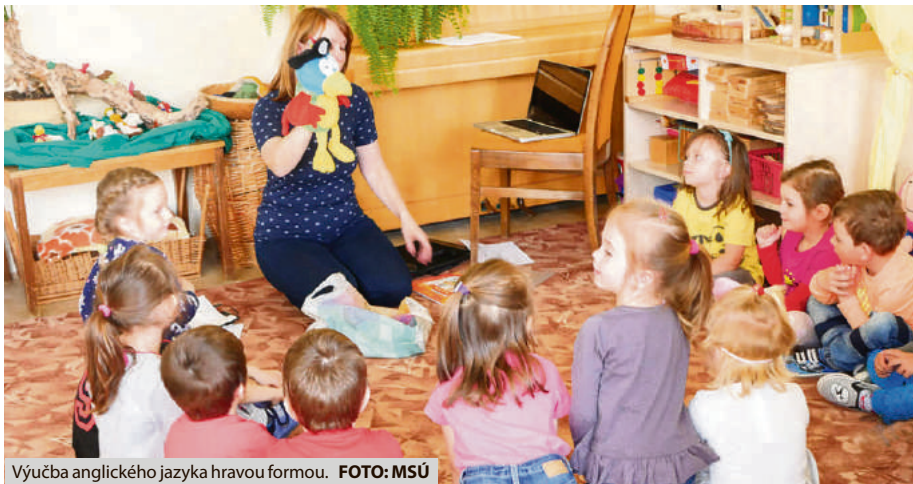
Výučba anglického jazyka hrovou formou.

Samotná výučba je realizovaná hrovou, nenásilnou formou, deťom je anglický ja-