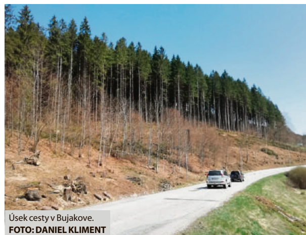
Úsek cesty v Bujakove.