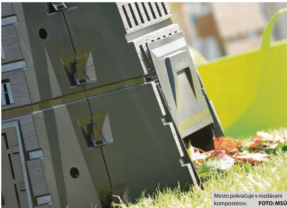
Mesto pokračuje v rozdávani kompostérov.

Pre dosiahnutie tohto zámeru dala miestna samospráva