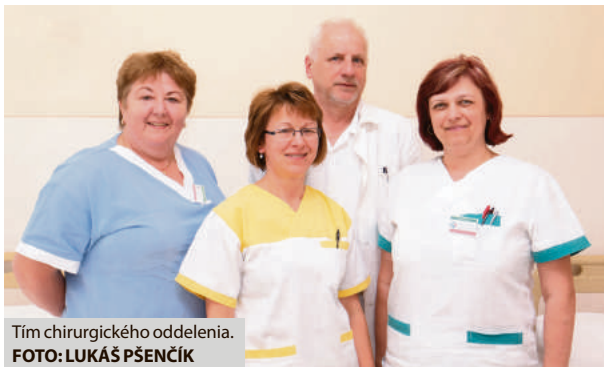
Tím chirurgického oddelenia.

Chirurgické oddelenie breznianskej nemocnice poskytuje kvalifikovanú zdravotnú starostlivosť v oblasti všeobecnej a cievej chirurgie a traumatológie pacientom zo spádovej oblasti okresu Brezno, ale aj mimo spádu, vzhľadom k blízkosti známeho lyžiarskeho strediska na Chopku, ako i pacientom s úrazom zo zahraničia. „Medicínske a ošetrovateľské postupy zdravotnej starostlivosti zahŕňajú prevenciu, diagnostiku a liečbu ochorení a úrazov, s cieľom zlepšenia zdravotného stavu pacienta. Vykonávame tiež konziliárnu činnosť a spolupracujeme s vyššími pracoviskami chirurgie, traumatológie či neurochirurgie v Banskej Bystrici,“ uviedol primár od-