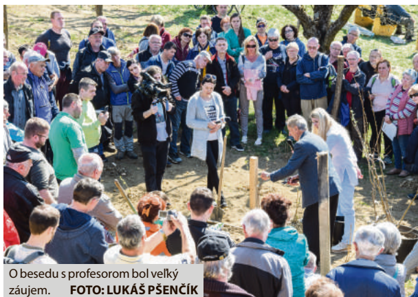
O besedu s profesorom bol veľký záujem.