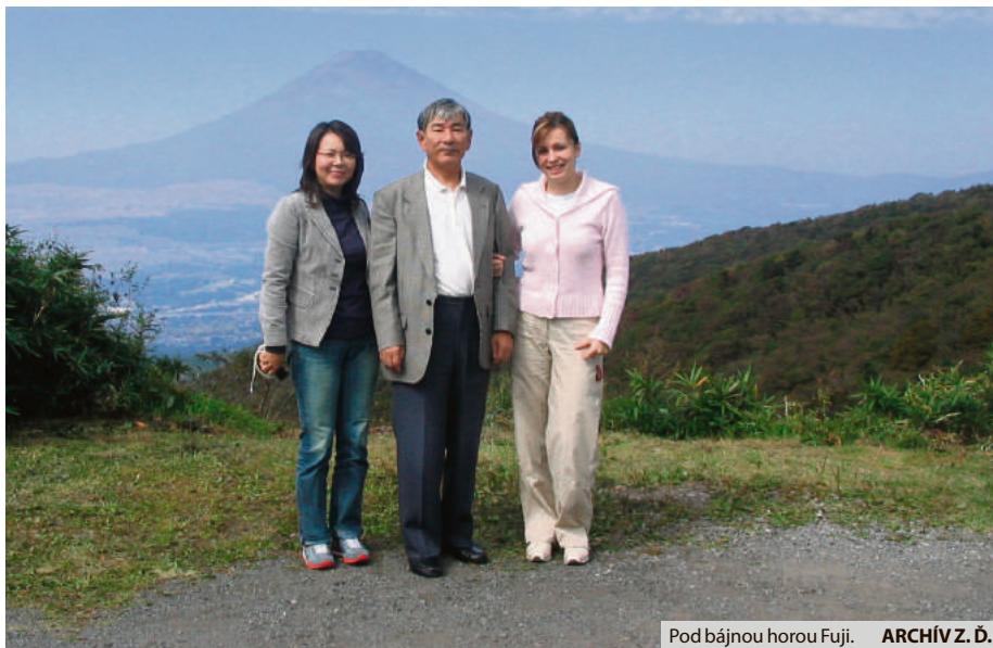
Pod bájnu horu Fuji.