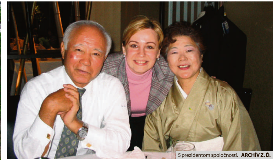
S prezidentom spoločnosti.

- Doma je len doma. V zahraničí som sa vždy cítila trochu cudzo a keď som mala pocit, že stačilo skúseností, rada som sa vždy vrátila na Slovensko. No a keď ma trochu osobnejšie oslovil jeden Brežňan, môj terajší manžel, už som sa nepotrebovala vrátiť