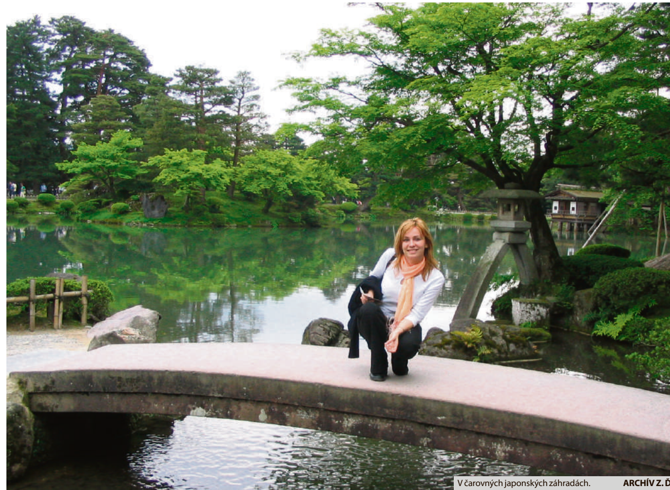
V čarovných japonských záhradách.

- Zmluvu som uzavrela na dobu jedného roka s príslušným ďalším predĺžením po uplynutí tohto času. Pracovala som v medzinárodnej sekcii