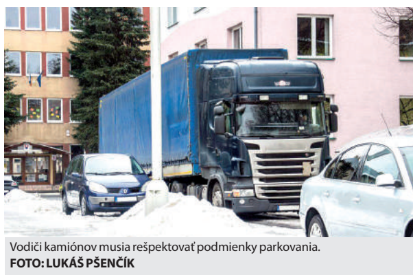
Vodiči kamiónov musia rešpektovať podmienky parkovania.