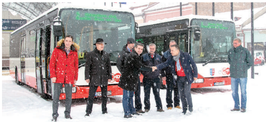
Odovzdávanie autobusov na breznianskom námestí.