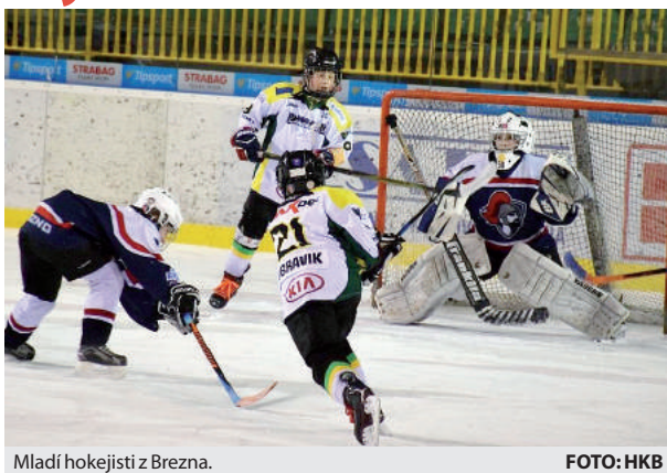
Mladí hokejisti z Brezna.