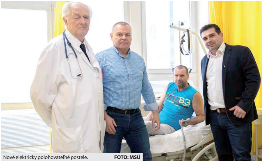
Nové elektricky polohovateľné postele.

Minulý týždeň na jednotke intenzívnej starostlivosti tohto oddelenia zasa vymenili šesť