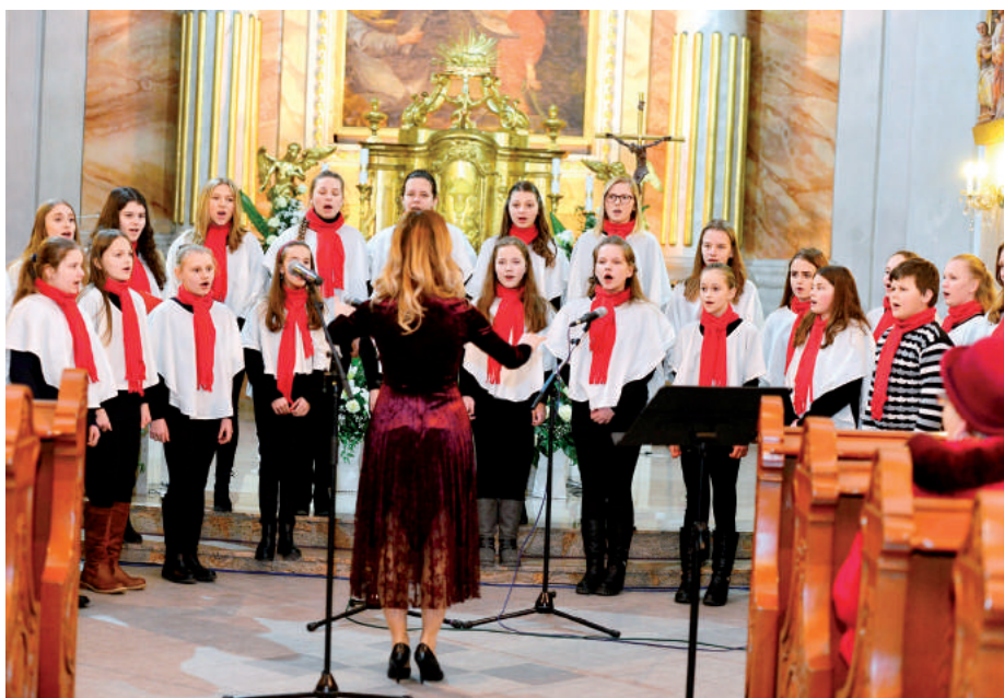
Detský spevácky zbor Felix.