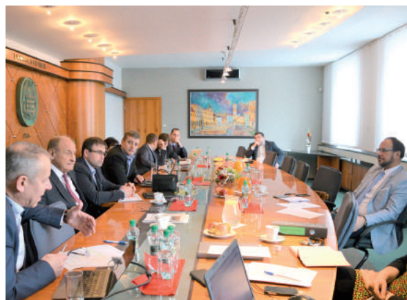
Stretnutie Iniciatívy stredné Slovensko v Banskej Bystrici.

„Treba povedať, že SSC aj ministerstvo dopravy urobili kus roboty a to napredovanie je pre nás veľmi pozitívne až prekvapujúce, za čo ďakujeme. Z našej strany budeme robiť všetko pre to, aby táto stavba bola v najbližších rokoch ukončená v celom rozsahu,“ uzavrel brezniansky primátor a dodal, že SSC okrem toho plánuje tento rok zrealizovať aj kompletnú asanáciu mosta ponad Hron na Kuzmányho ulici, a na jeho mieste postaviť úplne nový. (eš)