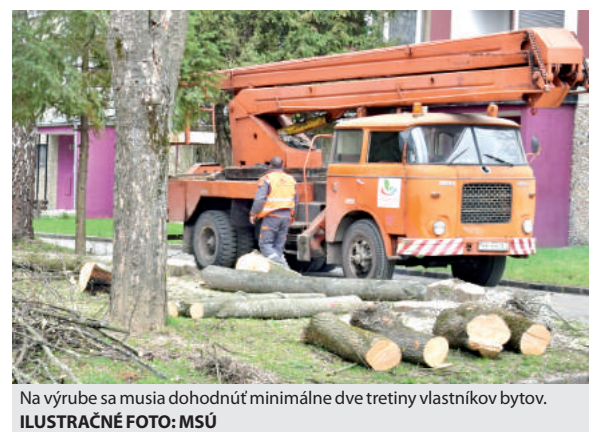
Na výrube sa musia dohodnúť minimálne dve tretiny vlastníkov bytov.