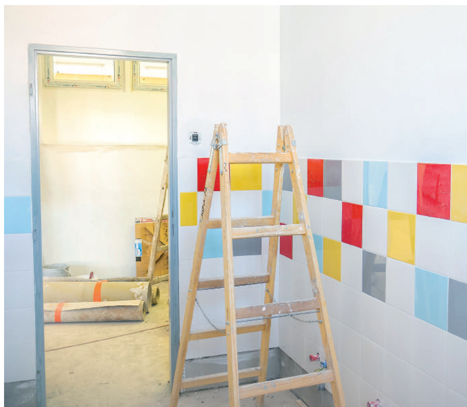
Mesto finišuje s rekonštrukciou Materskej školy na Mazorníkove.