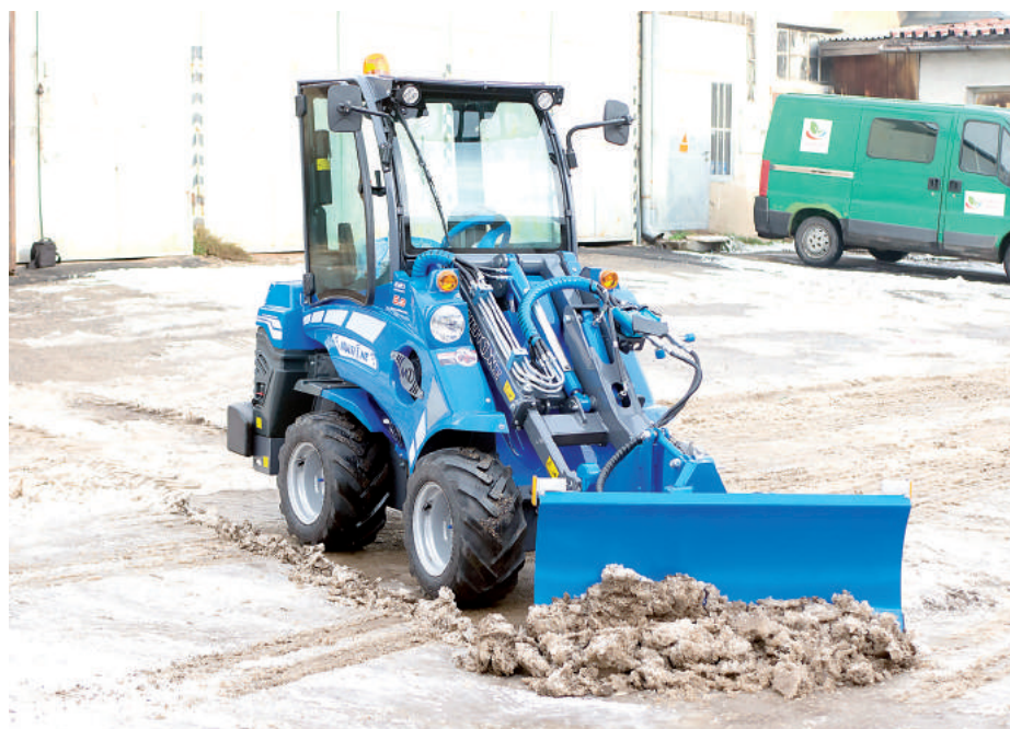
Nová posila Technických služieb na zimnú údržbu chodníkov.