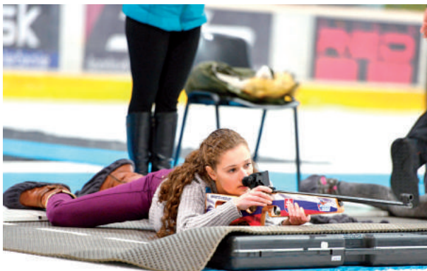
Tréning v Aréne.

Do biatlonového areálu v Osrblí sa opäť vracia svetový biatlon, mladé vychádzajúce talenty z celého sveta predvedú svoje najlepšie výkony a zabojujú o titul majstra sveta. Juniorské slovenské nádeje v Aréne Brezno ukázali a predviedli svoje umenie a tým motivovali a ukázali, že aj na Slovensku máme kvalitnú základňu a taktiež dobré podmienky pre svetovú úroveň v biatlone, čoho dôkazom sú aj výsledky ambasádorov majstrovstiev sveta Kuzminy