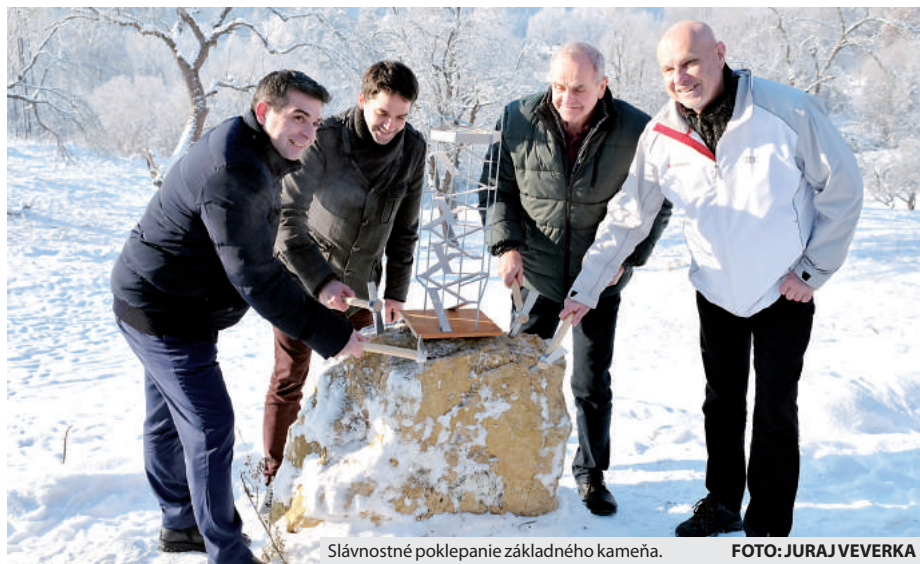
Slávnostné poklepanie základného kameňa.