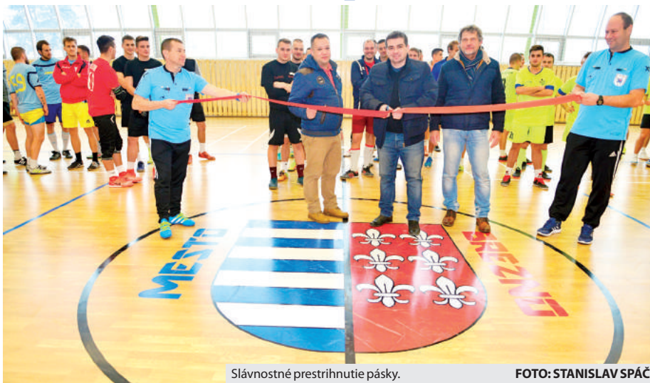
Slávnostné prestrihnutie pásky.

Predovšetkým skôr narodení obyvatelia Brezna si pamätajú, ako vyzerala telocvičňa pri plavárni na starom Mazorníku. Viacerým športovým klubom poskytovala tréningové priestory a dostatočné športové zázemie. Mesto sa so zámerom prinavrátiť tejto budove pôvodnú funkciu obrátilo na Banskobystrický samosprávny kraj, ktorý bol jej majiteľom, a prejavilo záujem o prevod vlastníckeho práva k tomuto objektu. „Cieľom bolo vytvoriť nový športový stánok pre športovcov v Brezne a zrekonštruovať budovu na novú multifunkčnú športovú ha-