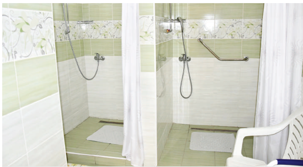
Kompletne vynovená kúpeľňa.

S renováciou na internom oddelení začali na začiatku októbra. V prvej etape počas troch týždňov obnovovali priestory na ženskom oddelení, kde je už