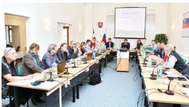
Novembrové mestské zastupiteľstvo.

Brezno v ostatných rokoch patrí medzi tie mestá, ktoré sa snažia svojim občanom pomáhať aj cez rôzne sociálne opatrenia a príspevky. Sem môžeme zaradiť príspevok pri narodení dieťaťa, príspevok pre nadané deti, ale aj poukážkový systém pre seniorov. Je potrebné zdôrazniť, že podobne pestrý zoznam dávok nie je vo väčšine samospráv ani zďaleka samozrejmosťou. S ich zavedením je prirodzene spojená úloha presne a spravodlivo určiť, ktorí obyvatelia majú na danú pomoc nárok, pričom niektoré nedostatky môže odhaliť až samotná prax. Z podobného dôvodu došlo na minulotýždňovom zasadnutí aj k spresneniu a rozšíreniu podmienok, za ktorých si je možné požiadať o jednorazový príspevok pri narodení dieťaťa podľa VZN 14/2015. Pre celkom inú skupinu občanov je určený tzv. poukážkový systém na úhradu vybraných