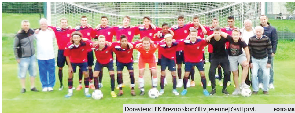
Dorastenci FK Brezno skončili v jesennej časti prví.

Pliešovce - Brezno 1:2 (0:2), góly Brezna: I. Bartoš, Gondáš (vl.), rozhodca: Peter Oružinský, 50 divákov.