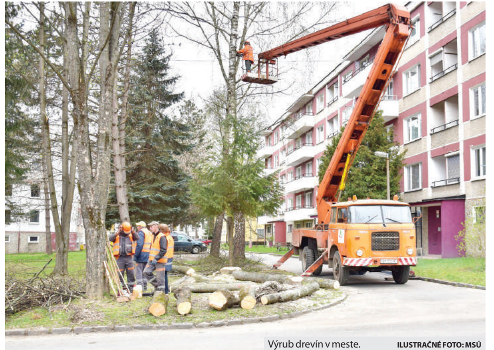
Výrub drevín v meste.

né správcem bytových domov či bytovým spoločenstvám poslať kedykoľvek. Každú z nich zaevidujú a ku koncu štvrtroka na Technické služby doručia jednu kompletnú žiadosť, ktorá sa následne bude riešiť v zmysle zákona o ochrane prírody a krajiny. „To znamená, že pri vykonaní následnej terénnej obhliadky budú posudzované dôvody na výrub drevín jednotlivo. Nie každá žiadosť o výrub stromu však znamená, že daná drevina bude ozaj vyrábaná. Na to sú stanovené presne legislatívne podmienky, ktorých sa