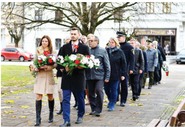
Obete vojen si uctili aj v Brezne.