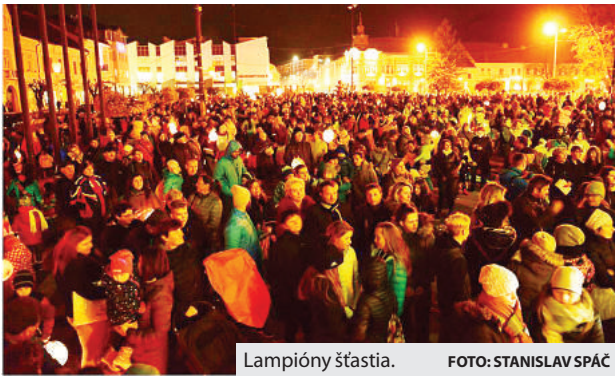
Lampióny šťastia.