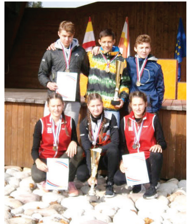
Na majstrovstvách Slovenska.