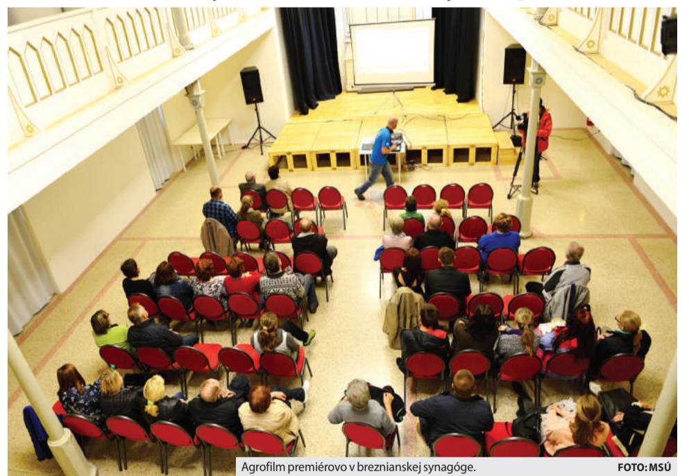
Agrofilm premiérovo v breznianskej synagóge.