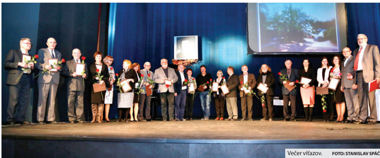
Večer víťazov.