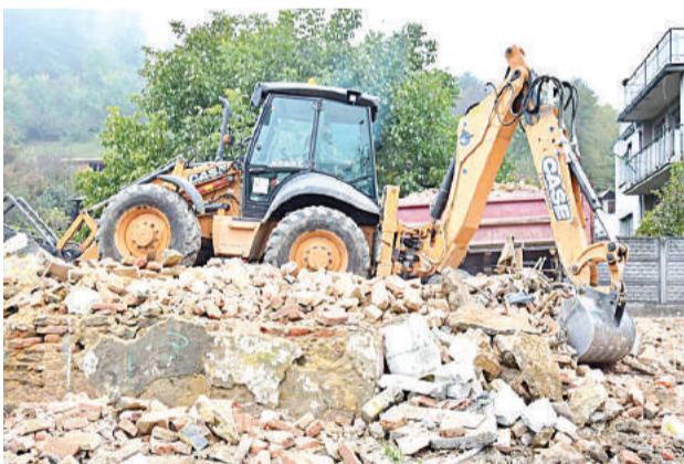
Zdevastované domy v meste postupne miznú.