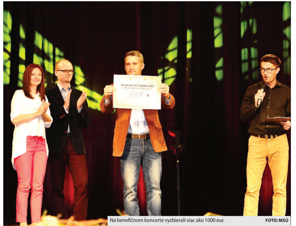
Na benefičnom koncerte vyzbierali viac ako 1000 eur.