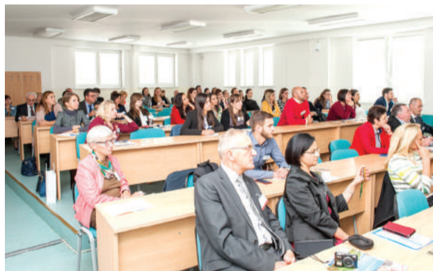
Konferencia na pôde Ekonomickej fakulty UMB.