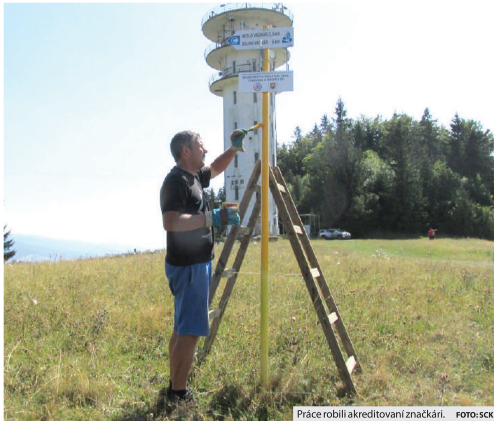
Práce robili akreditovaní značkári.