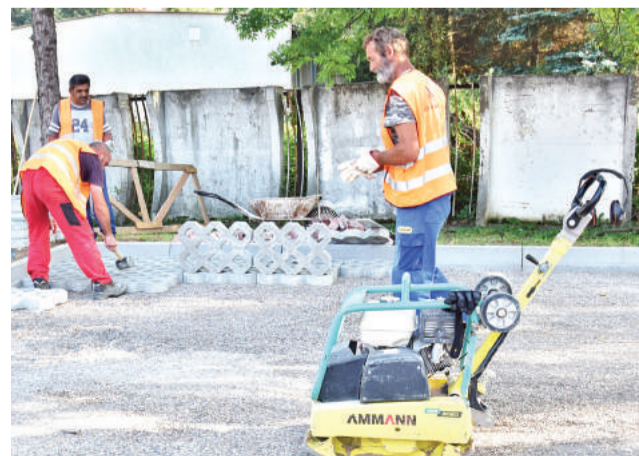
Mnohých Rómov sa mestu podarilo zamestnať cez projekty úradu práce.