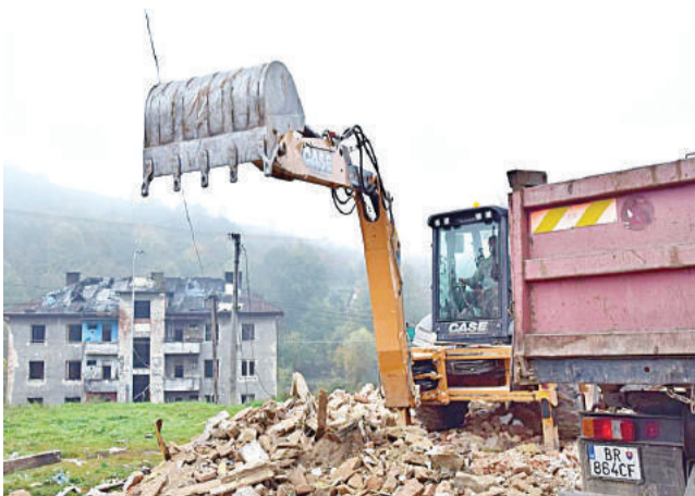
Mimoriadny ohlas verejnosti vyvolala najmä aktivita okolo „Domu hrôzy“.

- Moja vízia je taká, že v jednotlivých častiach Brezna, ako ich dnes poznáme, by mal byť v prvom rade poriadok a vhodné sociálne prostredie. To znamená dospelí ľudia, ktorí dlhodobu pracujú a deti, ktoré sa pravidelne vzdelávajú. Tu vidím základ a šancu na to, aby sa nám podarilo dosiahnuť stav, kde bude čo najmenej rôznych asociálnych prejavov, ktoré rušia a znepokojujú väčšinové obyvateľstvo. Úprimne verím, že s využitím spomenutých opatrení je to reálne. (sp)