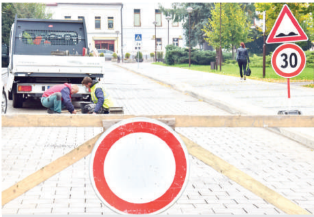
Oprava vozovky na námestí.