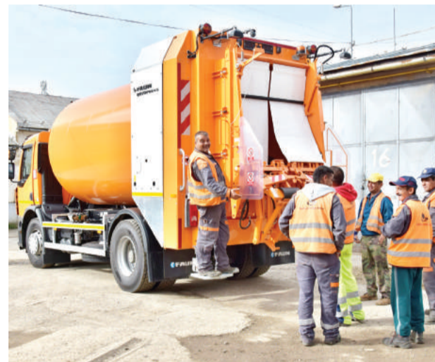
Mesto vďaka Envirofonde disponuje novým autom na zber odpadu.