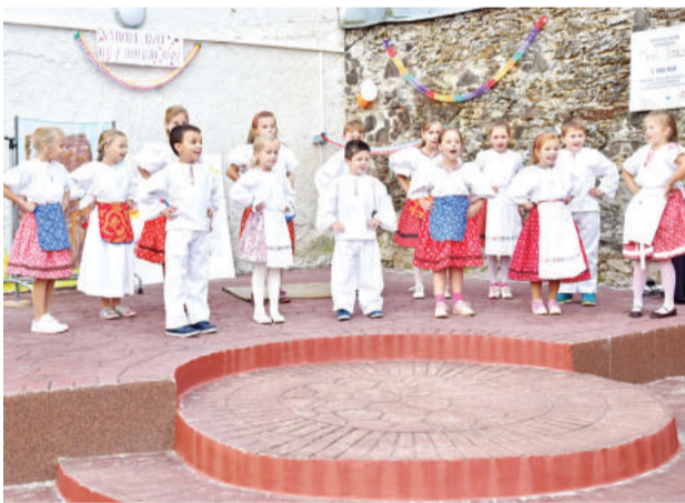
Otvorenie Námestíčka pod bránou.