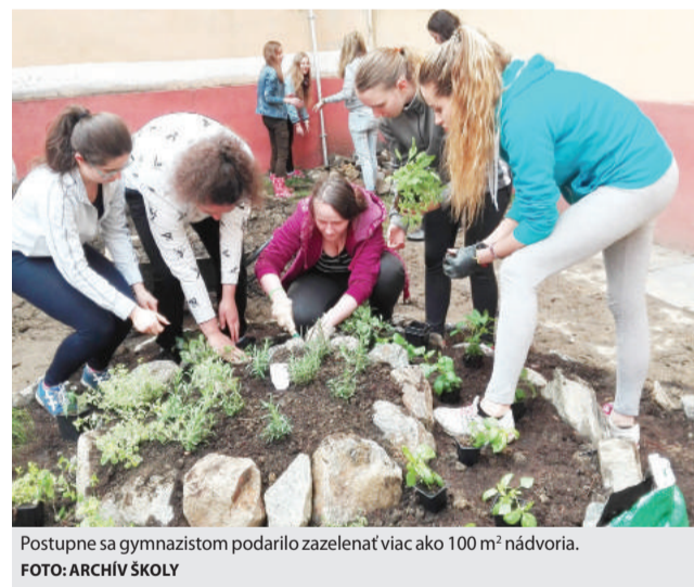
Postupne sa gymnazistom podarilo zazeleniť viac ako 100 m 2 nádvoria.

Do samotnej realizácie projektu sa študenti spolu s pedagógmi pustili v apríli tohto roka. Postupne sa im podarilo zazeleniť viac ako 100 m 2 nádvoria, vybudovať bylinkovú špirálu, mini sad z ovocných kríkov, kvetinové záhony, dom pre hmyz, jazierko, kompostovisko či zhotoviť paletové sedenie. „Na našom školskom dvore dominoval asfalt, preto plnenie projektového zámeru nebolo a nie je jednoduché ani finančne. Získali sme prostriedky od sponzorov, hlavne bývalých absolventov, zberom papiera a predajom vianočného pečiva vlastnej výroby, Rada rodičov schválila tiež finančný príspevok. Materiál nám pomohli viaceré firmy na