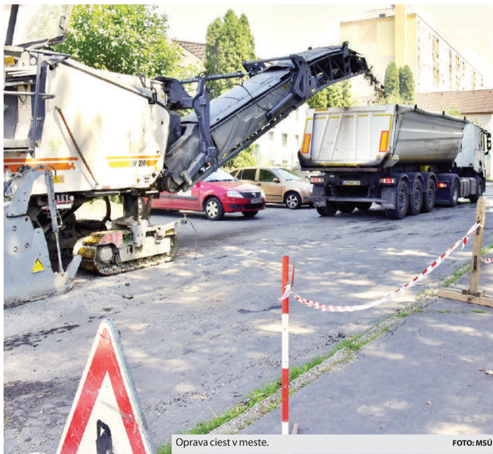
Oprava ciest v meste.

Na ostatnom mestskom zastupiteľstve z pätnástich prítomných poslancov všetci odsúhlasili realizáciu projektu