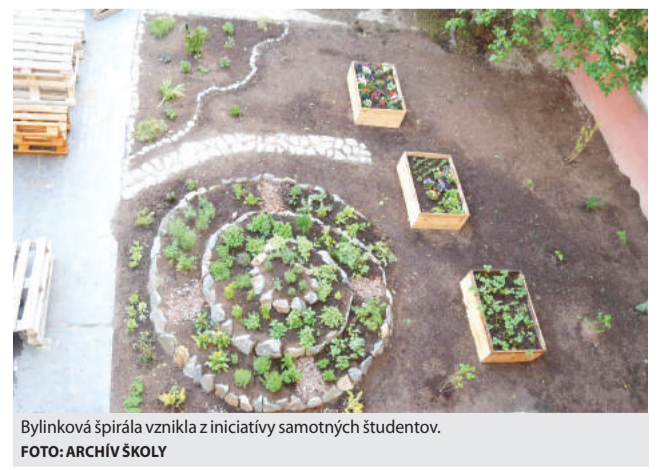
Bylinková špirála vznikla z iniciatívy samotných študentov.