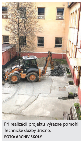
Pri realizácii projektu výrazne pomohli Technické služby Brezno.