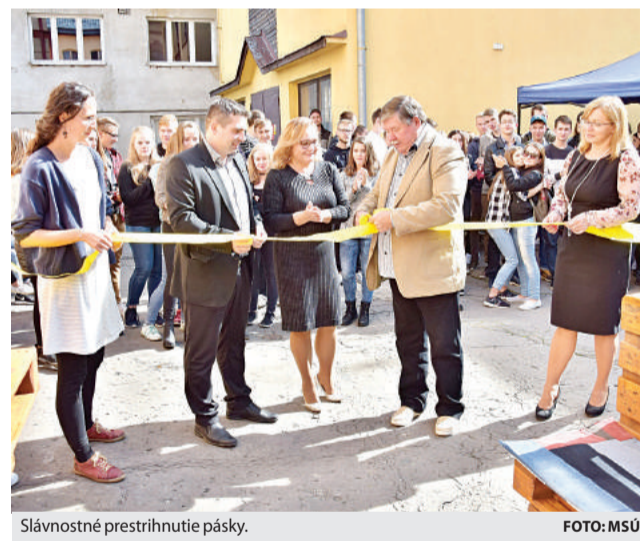
Slávnostné prestrihnutie pásky.

Breznianske gymnázium je jediné v regióne, ktoré projekt Záhrady, ktorá učí realizovalo. Práve študenti prišli s iniciatívou zmeniť vonkajšie prostredie školy a stretli sa aj s pochopením svojich učiteľov. V októbri 2016 sa spoločne pustili do úpravy predzáhrad-