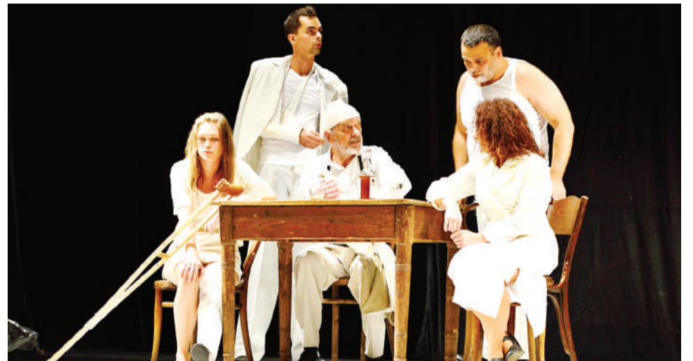
Ako prví sa v zrekonštruovanom kultúrnom stánku predstavili miestni chalupkovci.