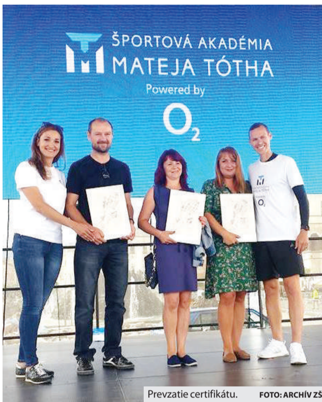
Prevzatie certifikátu.

Musím tých dvoch škriatkov nájsť stoj čo stoj a požiadať ich o pomoc, lebo inak prídem o svoju češť a stanem sa tiež kľamárom. Určite aj mne môj malý nos podrastie, húta nespokojný drotár. Ako si za-