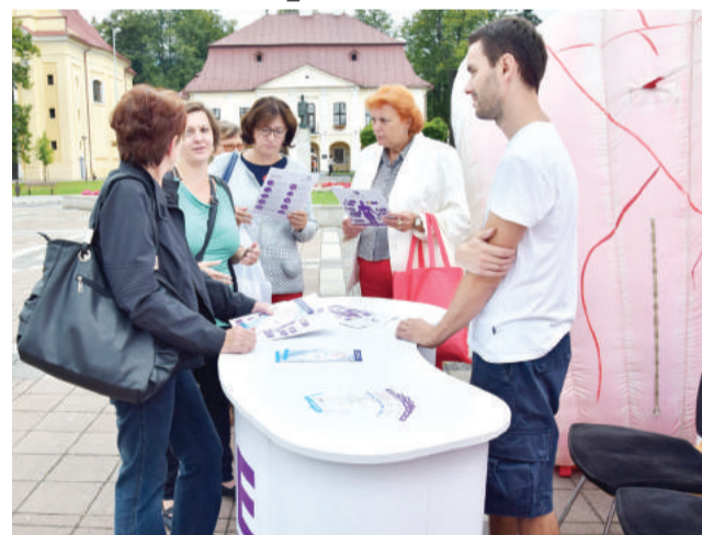
O Deň zdravia v Brezne bol veľký záujem.