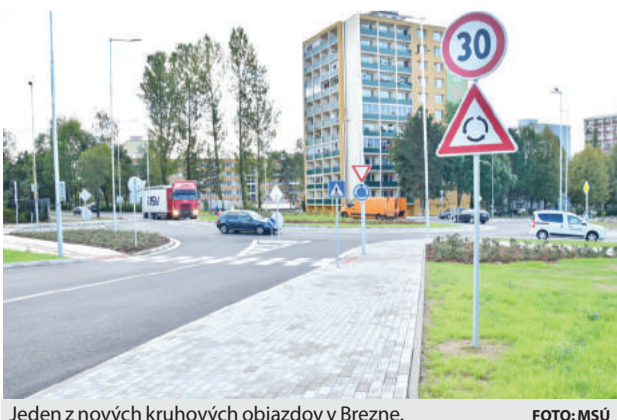
Jeden z nových kruhových objazdov v Brezne.