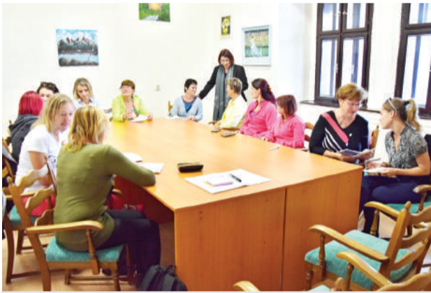
Mesto spúšťa pilotný projekt.