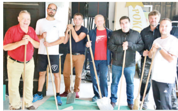
Zástupcovia mesta na brigáde v mestskom dome kultúry.

Brigáda sa už stala tradíciou a zástupcovia mesta v nej pokračujú. V utorok 12. septembra sa venovali pomocným prácam a celkovo generálnemu upratovaniu v mestskom dome kultúry, kde mesto pomaly finišovalo s rekonštrukciou kinosály. (md)