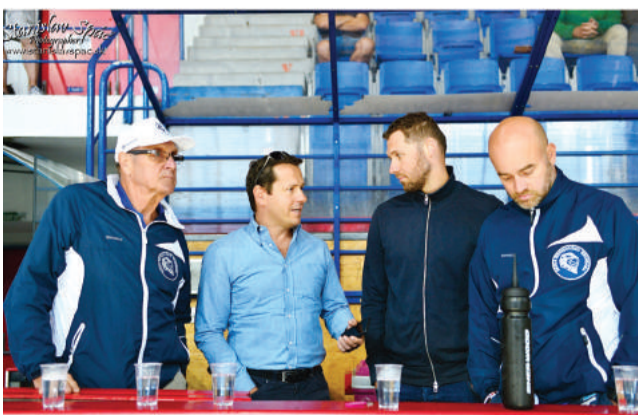
V breznianskej Aréne po štvrtýkrát.