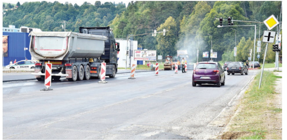
Vedenie mesta dohodlo aj opravu cesty I. triedy pri Tescu.

„Sme radi, že dodávateľ prác spoločnosť Alpine Slovakia, ako aj investor Slovenská správa ciest našej žiadosti vyhovel, keďže cesta to už dávno potrebovala, a splnili sme tak požiadavku našich obyvateľov,“ uviedol primátor. Cestu I/66 v úseku od kruhového objazdu pred kasárňami až po čerpaciu stanicu Octan vyfrézovali a položili na ňu nový asfalt.