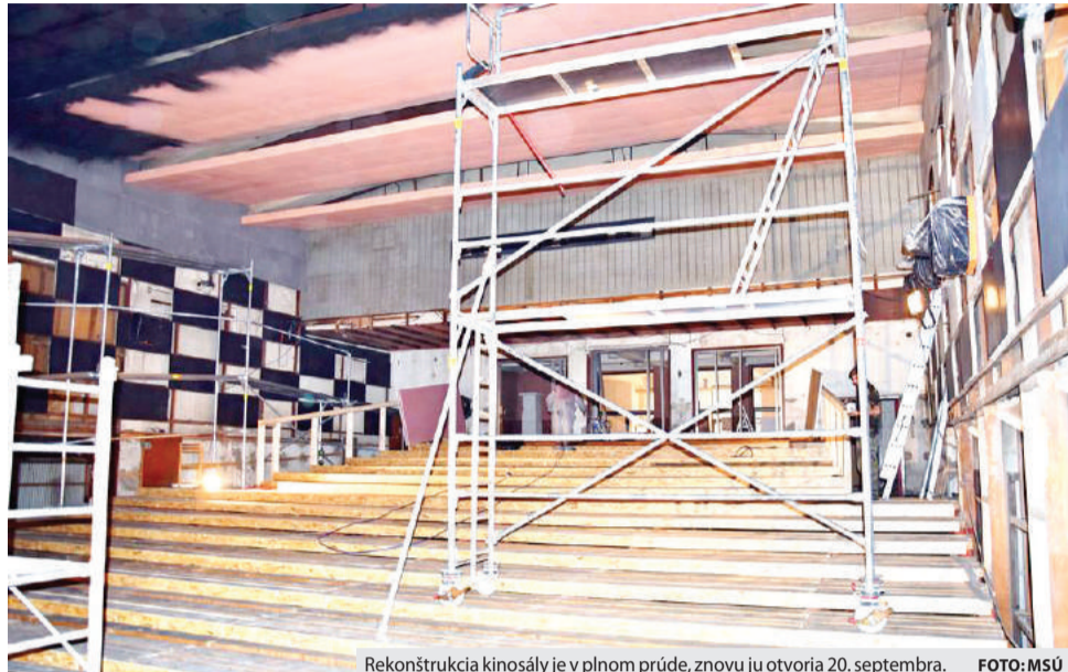
Rekonštrukcia kinosály je v plnom prúde, znovu ju otvoria 20. septembra.