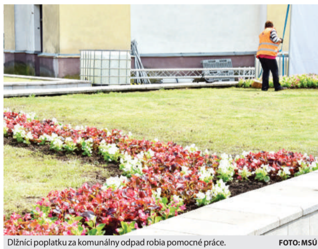
Dlžníci poplatku za komunálny odpad robia pomocné práce.

Mesto neplatičom zaslalo list do vlastných rúk, v ktorom im ponúklo možnosť dlh si odpracovať. Ako informoval vedúci ekonomického oddelenia mestského úradu Vladimír Grlický, upovedomili tak 40 dlžníkov poplatku za komunálny odpad, ktorí