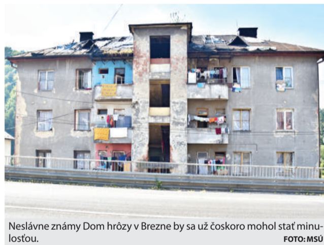
Neslávne známy Dom hrôzy v Brezne by sa už čoskoro mohol stať minulosťou.