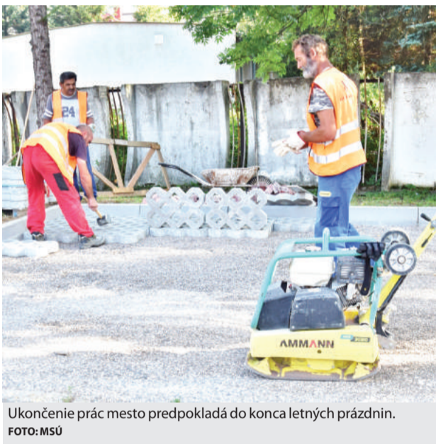
Ukončenie prác mesto predpokladá do konca letných prázdnin.