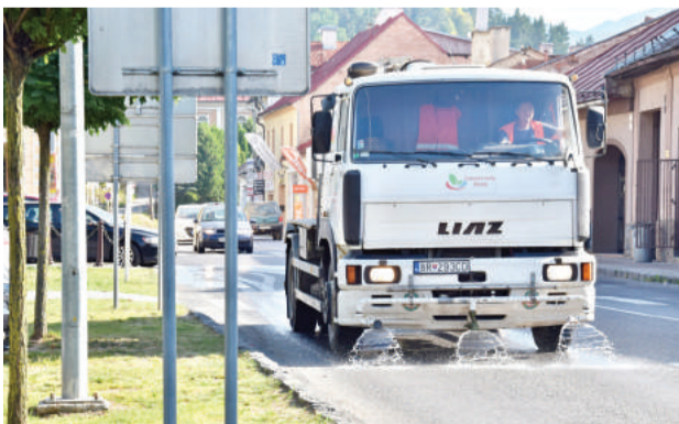
Ulice mesta zavlažuje počas horúčav polievacie auto.

nitring kontroly obecných lesov z dôvodu rizika požiarov, upravujú úradné hodiny a v neposlednom rade prevádzkujú pitné fontány a polievajú rozhorúčené ulice. Ani mesto Brezno nebolo výnimkou. Počas tropických dní nezaháľalo a nasadilo do terénu polievacie auto, ktoré celodenne chladilo rozpálené cesty a chodníky, čím zvyšovalo vlhkosť vzduchu a znižovalo prašnosť a teplotu komunikácií. (eš)