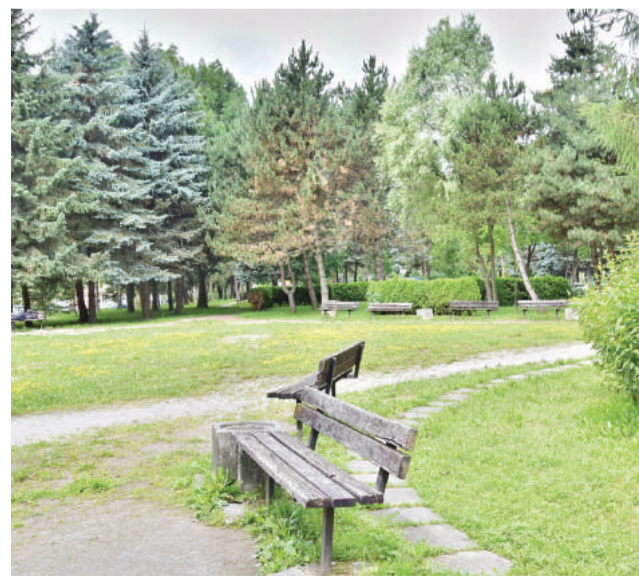
Ak mesto na ministerstve so žiadosťou uspeje, park výrazne zmení svoju podobu.