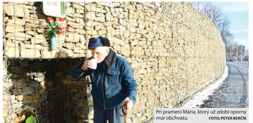
Pri prameni Mária, ktorý už zdobí oporný múr obchvatu.

Rozprávky PETER ZIFČÁK spod skalky na pokračovanie