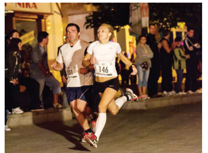
Už piaty ročník nočného behu odštartuje v sobotu 19. augusta.