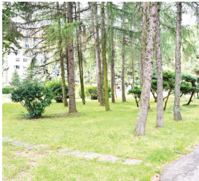
Margitin park v Brezne.

„Celá plocha pôsobí zdevastovane, zanedbane a neplní funkcie vnútrobloku – ani izolačnú, ani rekreačnú či športovú. S pribúdajúcimi problémami so znečisťovaním ovzdušia a otepľovaním klímy, ako aj s ohľadom na fakt, že v bezprostrednej blízkosti sa nachádzajú cestné komunikácie, je žiaduca práve intervencia do revitalizácie, obnovy, úpravy terénu, výsadby izolačnej zelene a obnovenia všetkých funkcií, ktoré vnútroblok v obytnej zóne má plniť – rekreačná, športová, obslužná,“ uviedla