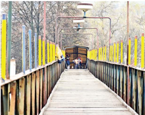
Lavica bude uzatvorená do 31. augusta, a to v čase od 7.00 do 13.00.

nie nových slov a významov v pôvodných skladbách. Má za sebou bohatú koncertnú činnosť v Nemecku, Grécku, Taliansku, ale aj v Rusku či Indii. Získala tiež veľa hudobných ocenení, medzi inými v roku 1999 prvenstvo na festivaloch Nowa tradycja či Eurofolk. Dánsky Folker magazine jej zase za album Usztijo udelil v roku 2005 cenu Album roka. Kapela sa predstaví takisto v piatok 30. júna o 21.00, tentokrát v nezávislom kultúrnom priestore Bombura. Vstupné je dobrovoľné. (r)