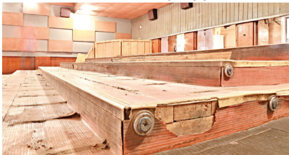
Technické služby už odstránili sedačky v kine.