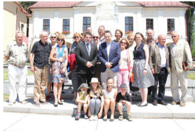
Pred sochou gen. M. R. Štefánika.