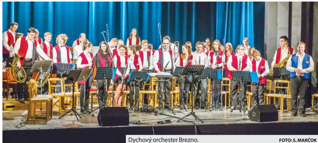
Dychový orchester Brezno.