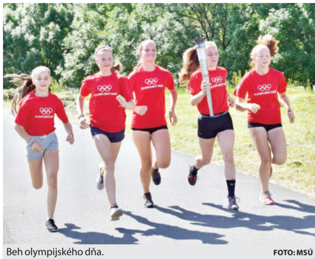
Beh olympijského dňa.

Popri behu na trati dlhej 100 – 900 metrov si účastníci vy-