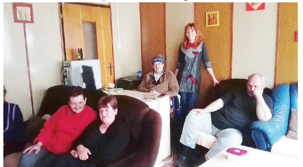
Vzdelávanie v Nízkoprahovom dennom centre Lúč.