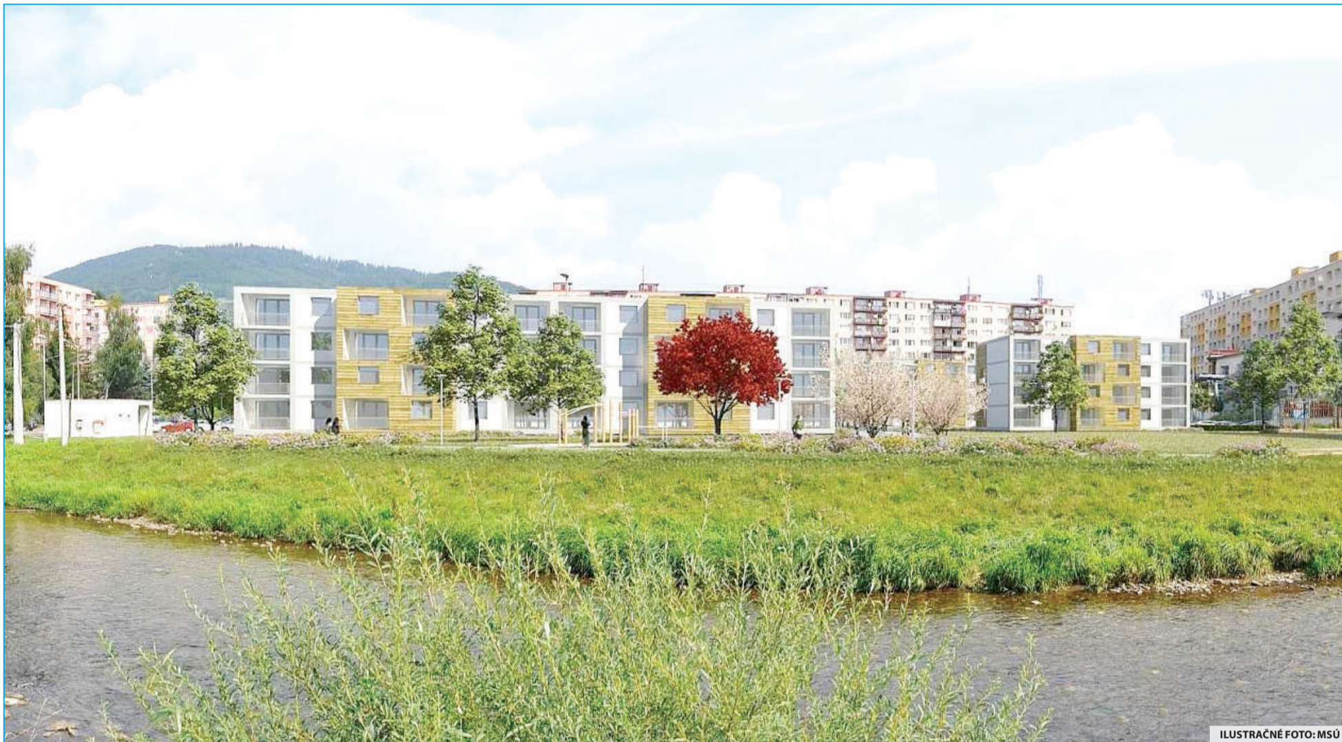
ILUSTRÁČNÉ FOTO: MSÚ