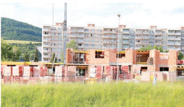
Výstavba nájomných bytov.