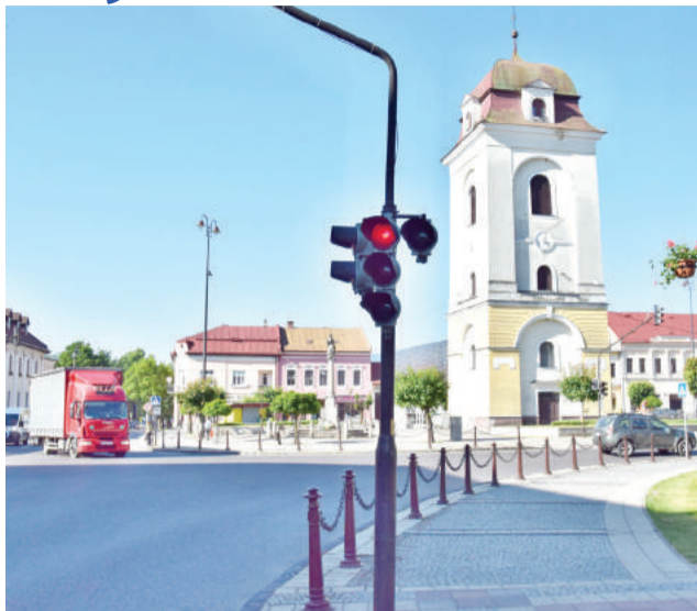
Zmena sa bude týkať všetkých semaforov v meste.