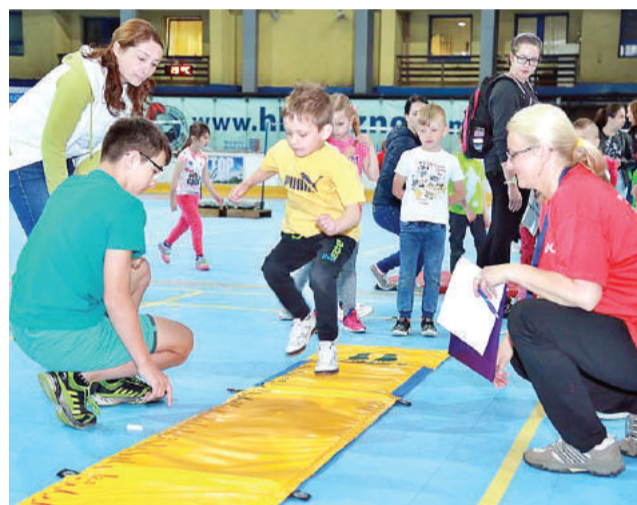
Malí olympionici súťažili aj v skoku do dialky.

V aktuálnom ročníku súťaže dominovali domáci Brezňania, ktorí ovládli takmer všetky stupne víťazov. Prvé miesto a putovný pohár primátora si odniesli deti z materskej školy na Clementisovej ulici, druhí skončili škôlkari z Mazorníkova a bronzovú priečku si vybojovali malí športovci z Predajnej. V zdravotníckej príprave si najlepšie počínali škôlkari z Lopeja.