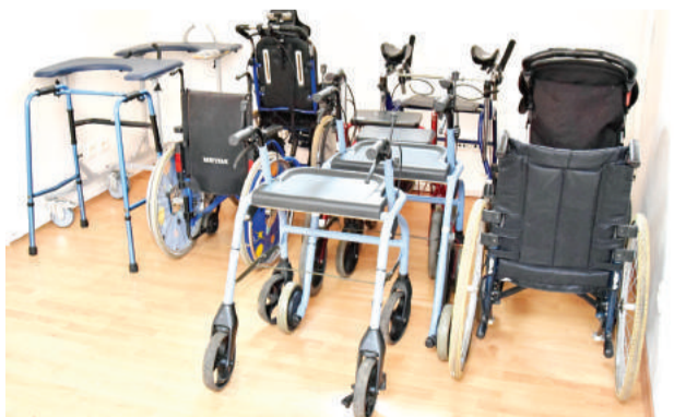
Požičovňu pomôcok nájdete na Nám. gen. M. R. Štefánika č. 3.