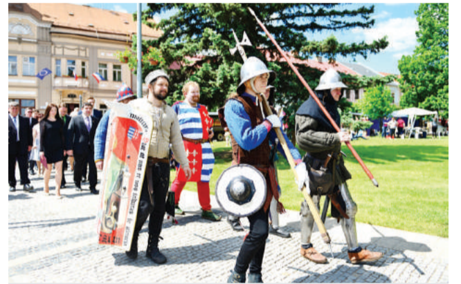
Sprievod smeroval k soche Milana Rastislava Štefánika.

Počas mestských osláv si účastníci pietneho aktu v sprievode vedenom skupinou his-