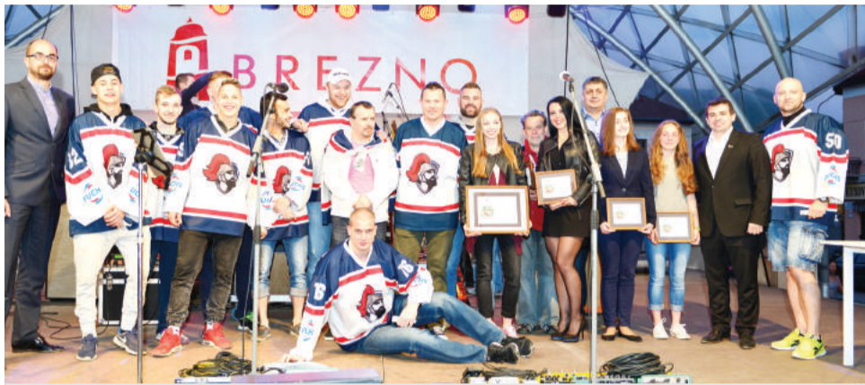
Ocenení športovci vlni úspešne reprezentovali mesto Brezno.