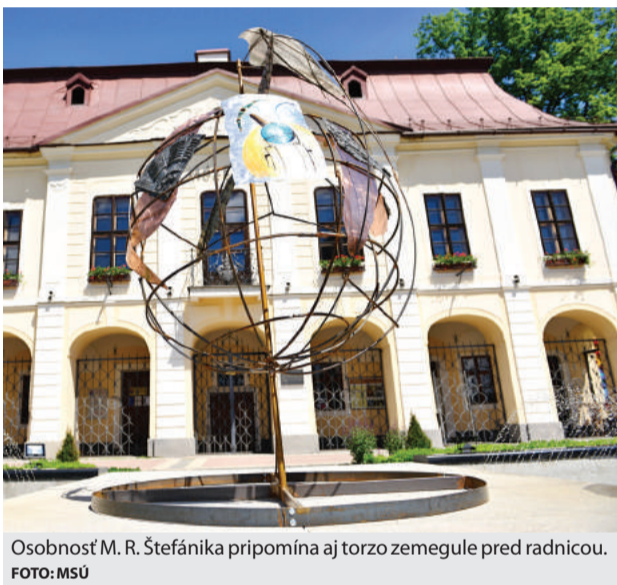
Osobnosť M. R. Štefánika pripomína aj torzo zemegule pred radnicou.