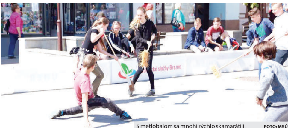
S metlobalom sa mnohí rýchlo skamarátili.