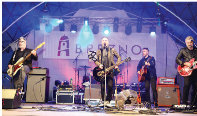
V piatok podvečer si Brezňania s Hexom zresetovali hlavy.

Po ňom prišla na rad hlavná hviezda tohtoročných mestských osláv - známa česká hudobná skupina Čechomor, ktorá sa do povedomia verejnosti dostala predovšetkým spoluprácou s pesničkárom Jaromírom Nohavicom a charizmatickým hudobníkom Jazom Colemanom, ktorá vyvrcholila úspešnou filmo-