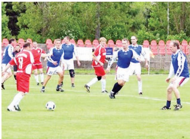
Starí páni Brezna a Čierneho Balogu.

Hráčov prišlo povzbudiť takmer 200 fanúšikov, ktorí potleskom odmenili každú útočnú akciu obidvoch tímov. Zápas nakoniec skončil