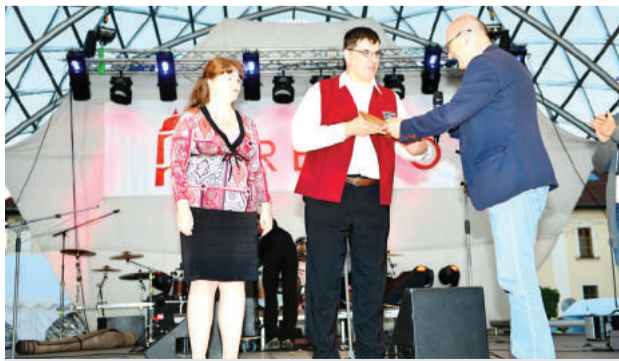
Dychový orchestr Brezno oslavuje 65. výročie.