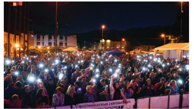
Koncerty prilákali na námestie stovky ľudí.

moravskými a slovenskými ľudovými piesňami vo svojom typickom rockovom aranžmá-