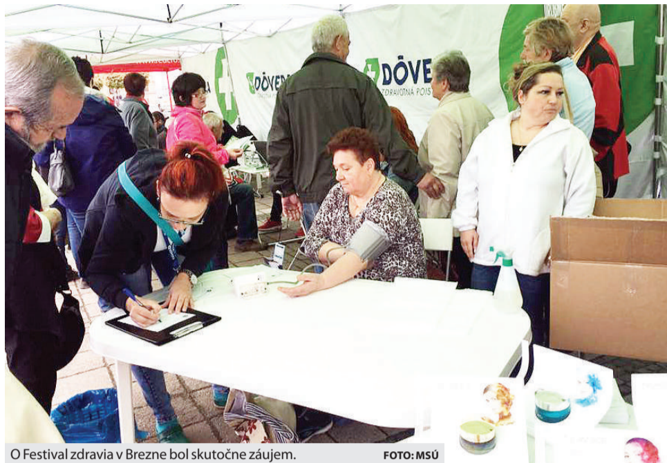
O Festival zdravia v Brezne bol skutočne záujem.

Účastníci festivalu sa mohli zapojiť aj do súťaže o hodnotný bicykel. Stačilo vypísať prihlasovací formulár a vhodiť ho do pripravenej urny na podujatí.