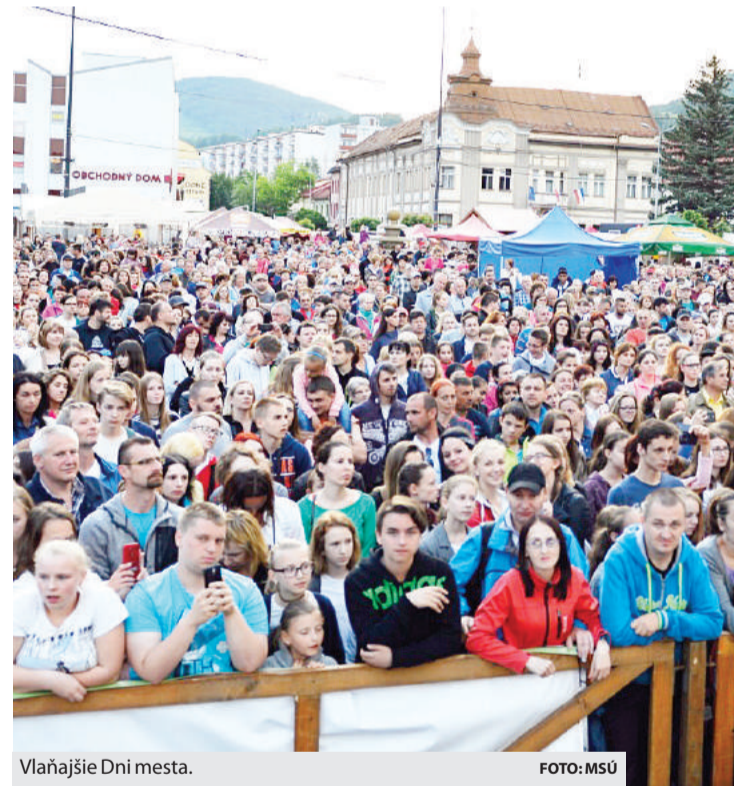
Vlaňajšie Dni mesta.