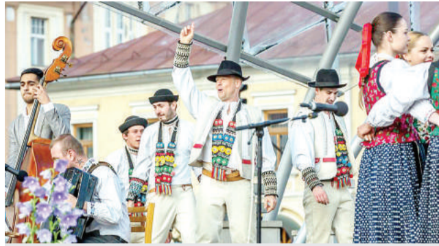
Na podujatí vystúpil aj FS Urpín.