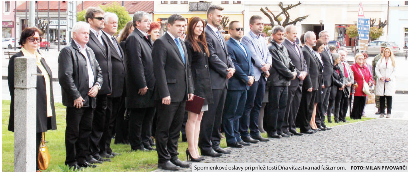
Spomienkové oslavy pri príležitosti Dňa víťazstva nad fašizmom.