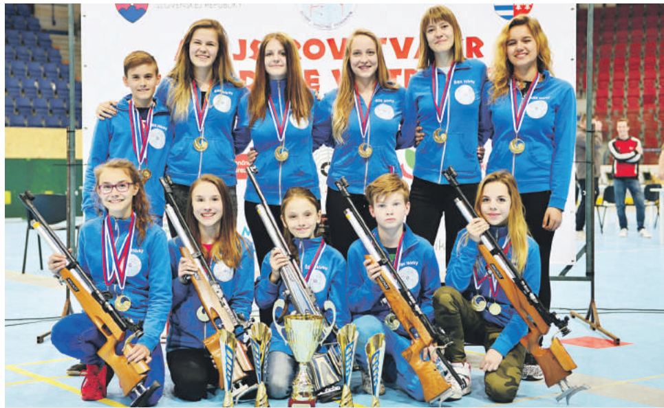
Majstrovstvá Slovenska mládeže v strelbe zo vzduchových zbraní v Brezne.