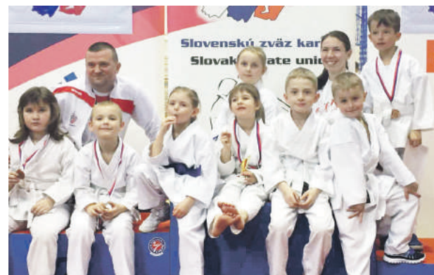
Úspešné družstvo mladých karatistov na 3. kole Slovenského pohára v Starej Ľubovni.