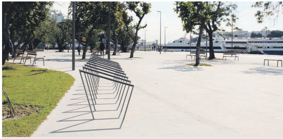
Mesto nakúpilo dovedna 16 stojanov s kapacitou 47 bicyklov.