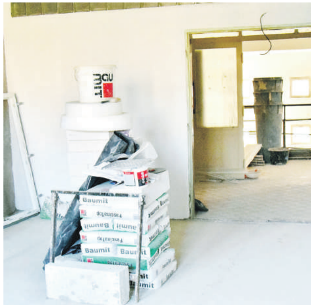
Základná umelecká škola bude už tanečný a literárno-dramatický odbor vyučovať v novej budove.

V budove na Nálepkovej ulici, ktorá pôvodne slúžila ako práčovňa, rastú na poschodí nové priestory. Mesto podporuje umeleckú činnosť detí, a preto sa rozhodlo podať pomocnú ruku základnej umeleckej škole. „Na základe žiadosti našej ZUŠky, ktorú navštevuje viac ako 500 žiakov, a zvýšeného záujmu detí a rodičov, sme sa rozhodli pre nich vytvoriť nové veľké priestory. Špeciálne ich upravíme tak, aby boli vhodné na vyučovanie všetkých predmetov tanečného a literárno-dramatického odboru. Nachádzať sa v nich bude tanečná a divadelná sála, dve cvičné miestnosti, triedy pre individuálny prednes žiakov i prípravu učiteľov, skladové priestory, sprchy, šatne a sociálne zariadenia. Adekvátne podmienky na vyučovanie v nich nájdu všetci žiaci a učители týchto