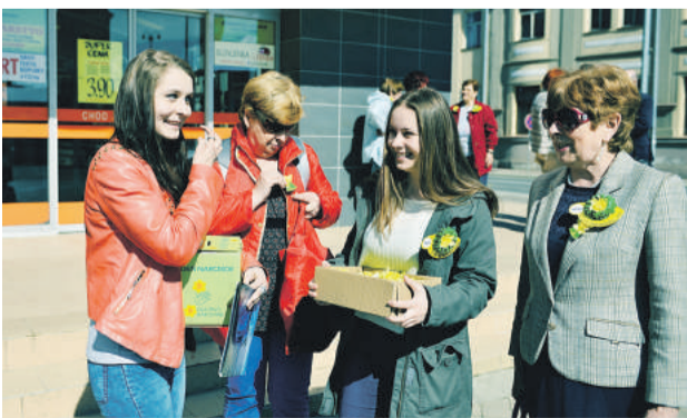
Deň narcisov sa uskutoční už tento piatok.

Prispieť môžete aj do 15. apríla ľubovoľným finančným príspevkom na účet zbierky SK09 0900 0000 0054 5454 5454 alebo zaslaním SMS s ľubovoľným textom na č. 848 v hodnote 2 eurá v sieti všetkých mobilných operátorov. Operátori odvedú do zbierky celú sumu a samotné zaslanie SMS zákazníkovi nespoplatňujú. (md)