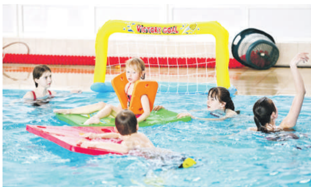
Premiérový ročník Bláznivej 12-hodinovky si nenechalo ujsť viac ako 100 plavcov.