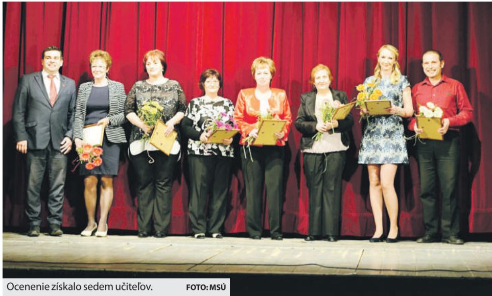
Ocenenie získalo sedem učiteľov.