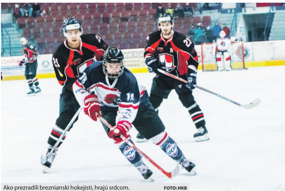
Ako prezradili breznianski hokejisti, hrajú srdcom.

– O cieľoch do budúcej sezóny je teraz veľmi ťažko hovoriť. Nielen čo sa týka A mužstva, ale aj ostatných kategórií. SZLH pripravuje kompletne novú súťažnú štruktúru pre všetky kategórie. To, akú budú mať podobu, ešte nikto nevie. Hneď ako vedenie SZLH obo-