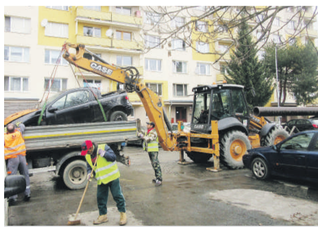
Vraky na ŠLN stáli skoro dva roky.