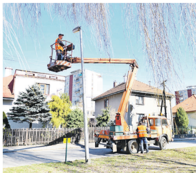
Ak nefunguje vo vašom okolí verejné osvetlenie, oznámte to na vrátnici technických služieb alebo cez City Monitor.

Mesto vlni v rámci projektu s pomocou nenávratného finančného príspevku z fondov Európskej únie vo výške asi 650 tisíc eur vymenilo 1066 svetelných bodov na všetkých hlav-