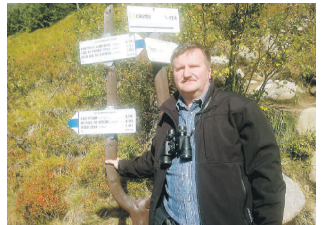
Vo voľnom čase.