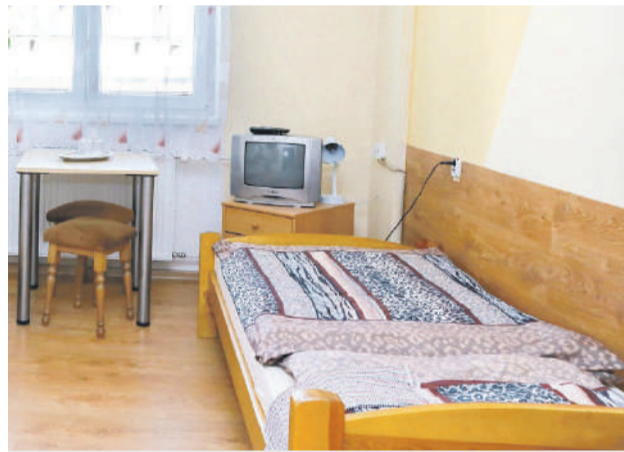
Prednádvom v ubytovni pribudli dve nové izby.