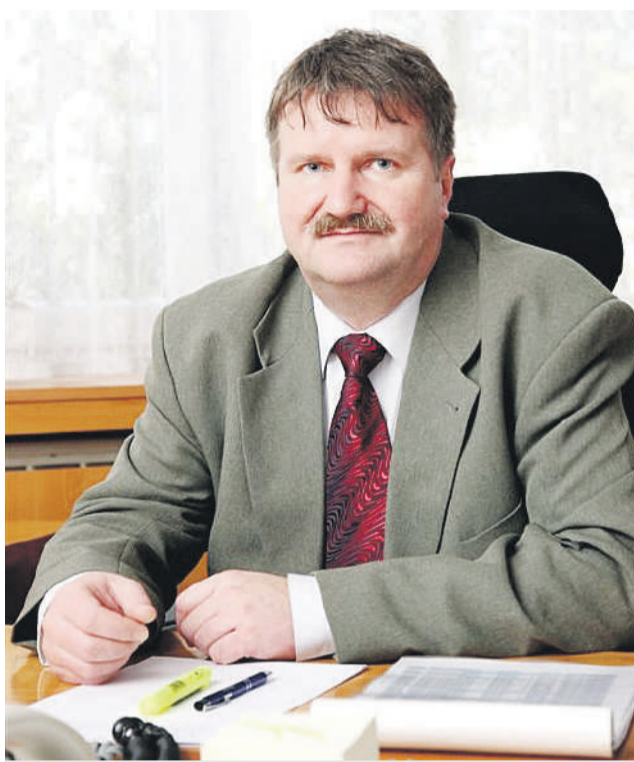
Nový riaditeľ breznianskej nemocnice.

- Predovšetkým chcem zachovať komplexnosť poskytovania širokospektrálnej zdravotnej starostlivosti a existenciu základných oddelení ústavnej starostlivosti. Nemocnica pôsobí v geograficky náročnom území južnej časti Nízkych Tatier a Slovenského rudohoria. Turistický ruch sezónne zvyšuje počet obyvateľov regiónu a je sprevádzaný vyššou úrazovosťou. Preto je nevyhnutné výrazne skvalitniť, zefektívniť a zvýšiť dostupnosť neodkladnej zdravotnej starostlivosti vo všetkých jej formách k maximálnej spokojnosti pacienta.