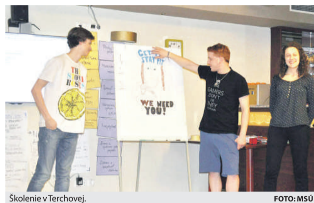
Školenie v Terchovej.

Program Erasmus + mládež je zameraný predovšetkým na oblasť neformálneho vzdelávania a jeho cieľovou skupinou sú popri pracovníkoch s mládežou najmä mladí ľudia vo veku 13-30 rokov. V roku 2014 začala v rámci programu nová sedemročná fáza, ktorá nadväzovala na predchádzajúci obdobný program Mládež v akcii z rokov 2007 – 2013. Jeho cieľom je motivovať mladých ľudí k aktívnemu prístupu, zapájaniu sa do spoločnosti a odstraňovaniu bariér. Ponúka im možnosti ako zrealizovať svoje nápady, zlepšiť svoje jazykové schopnosti a získať praktické skúsenosti v medzinárodnom prostredí. V štruktúre programu sú pre mladých ľudí najzaujímavejšie projekty mobilit, ktoré zahŕňajú výmeny mládeže, mobility pracovníkov s mládežou a európsku dobrovoľnícku službu. Práve na mládežnícke výmeny sa v najbližšom období plánu-