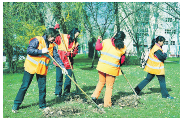
Občania nájdu uplatnenie v technických službách na rôznych pozíciách.