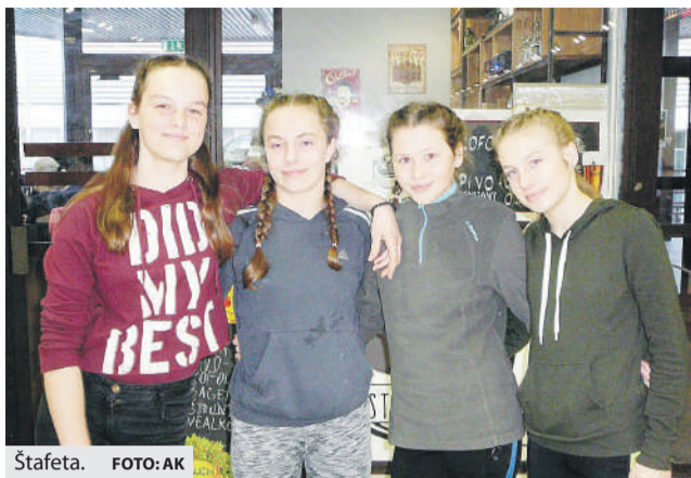
Štafeta.