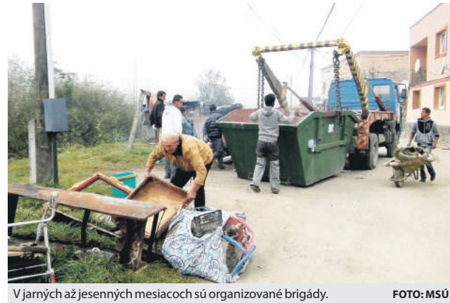
V jarných až jesenných mesiacoch sú organizované brigády.

Zamerali sme sa aj na zlepšenie finančnej gramotnosti neprispôsobivých obyvateľov, a to zahájením vzdelávania, kde odborníci z danej oblasti