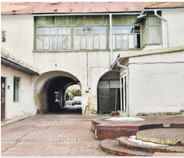
Pod bránou mestského úradu.