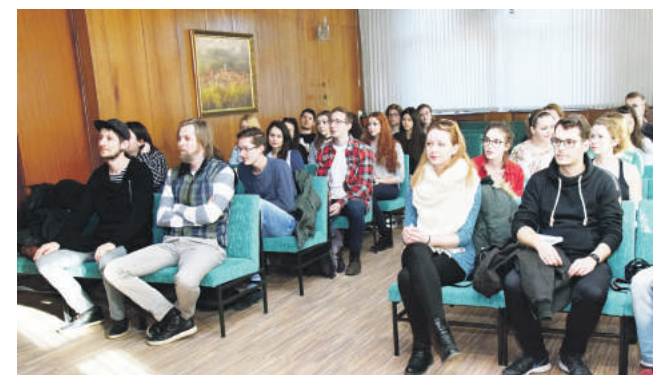
Študenti a pedagógovia Fakulty architektúry Slovenskej technickej univerzity počas dvoch dní spoznávali Brezno.

Architekti spoznávali Brezno osobne, ale aj prostredníctvom prezentačných materiálov či mapy s vyznačenými lokalitami. Počas dvoch dní sa im venovali zamestnanci z investičného odboru mestského úradu, architektka a viceprimátor, ktorí im odporučili zamerať sa na určité miesta na námestí, týkajúce sa parkových plôch, vnútroblokov a verejného priestoru. „Do pozornosti sme im dali park na námestí, infotabule, prvky drobnej architektúry, sadové úpravy v historickom kontexte, zvonice, jej sprístupnenie, či revitalizáciu tzv. Uličky alebo nádvoria mestského úradu. Pristavili sme sa aj v Margitínom