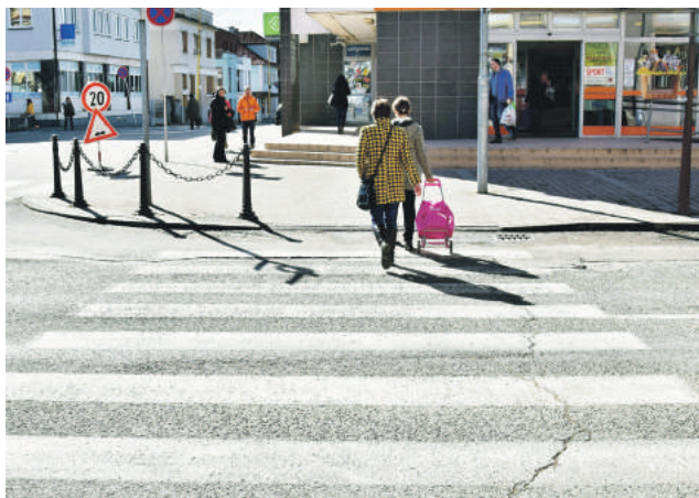
Mesto osvetlí frekventované priechody pre chodcov.

V priebehu minulého roka prišlo na mestský úrad viacero podnetov, v ktorých občania poukazovali na slabú viditeľnosť priechodov v rôznych častiach mesta. Tento stav považovali za nebezpečný pre chodcov i vodičov. Vedenie mesta reagovalo na tieto pripomienky a začalo sa situácii na breznianskych cestách intenzívne venovať. Poverení odborní zamestnanci v súčinnosti s okresným dopravným inšpektorátom zmapovali najrizikovejšie lokality a v určenom rozsahu navrhnuté investície zohľadnili aj požiadavky Brezňanov. Súčasne sa mesto ešte na jeseň zapojilo do výzvy Ministerstva vnútra, kde do projektu „Bezpečné priechody pre chodcov v Brezne“ zaradilo päť z nich, na ktorých ku kolíznym situáciám dochádzalo v minulosti najčastejšie. Miesto čakania na vyhodnotenie výzvy sa samospráva rozhodla konať