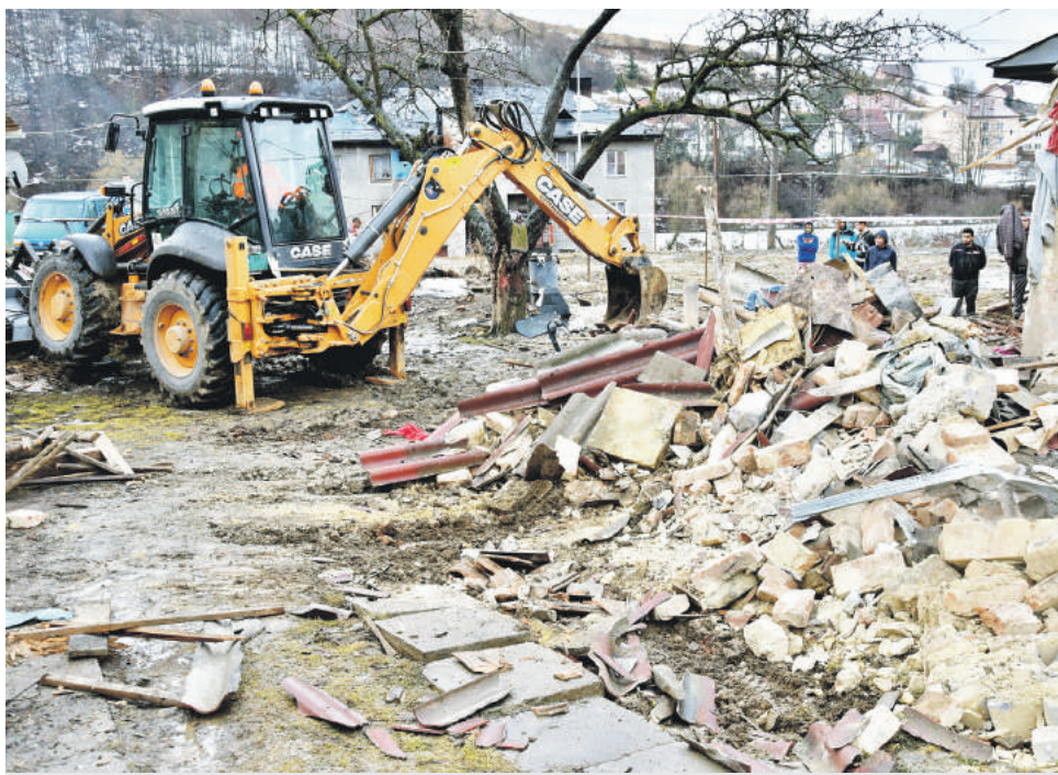
Mesto pristúpilo k zbúranie prvého domu v lokalite s neprispôsobivými obyvateľmi.

Nedávno samospráva pristúpila k zbúranie prvého takéhoto objektu na mestskom pozemku v miestnej časti Predné Halny. „Mesto