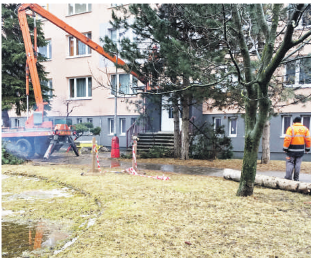
Výrubu a orezávky drevín v meste.