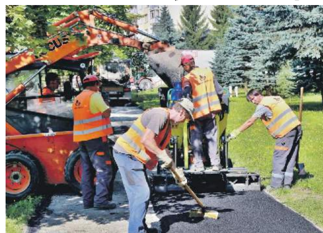
Technické služby budú v oprave chodníkov pokračovať aj na jar.