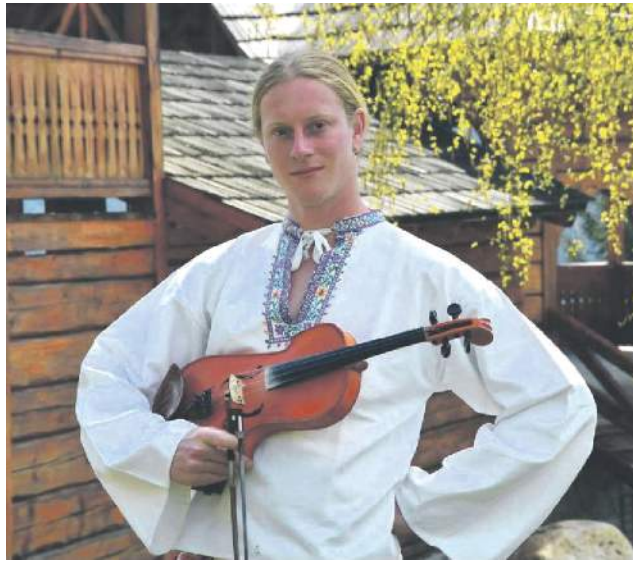
Nebavilo ho hrať etudy a tak začal hrať v Mostári.

- Ten autentický folklór na Horehroní. Keď niekde v krčme v Helpe začnete hrať a všetci ľudia v nej budú spie-