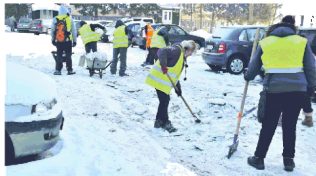
Odstraňovanie zamrzutej vrstvy snehu.