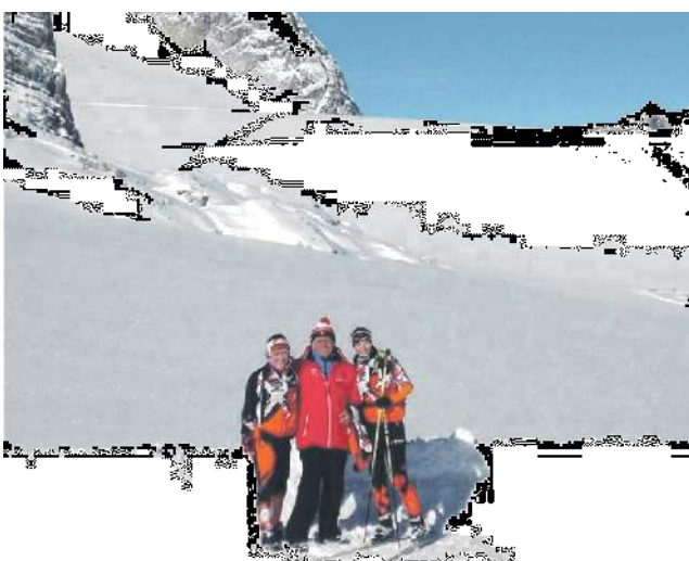
Tréner so zverenkyňami na sústredení na ľadovci Dachstein.