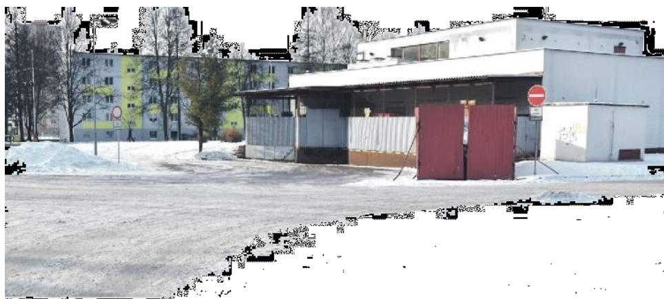
priestory plánovanej výstavby samoobslužnej čerpaciej stanice.