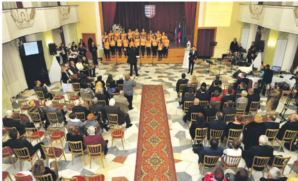
Slávnostné mestské zastupiteľstvo je spojené s odovzďávaním ocenení.

Položením vencov a slovami vďaky si účastníci spomienkových osláv v piatok 27. januára so začiatkom o 14.30 uctia pamiatku tých, ktorí za našu slobodu obetovali to najcennejšie - vlastný život. Po pietnom akte o 15.00 mesto v spolupráci s klubmi vojenskej histórie kľúčové momenty oslobodenia Brezna priblíži občanom asi polhodinovou ukázkou historických bojov v mestskom parku. Nie náhodou ich predvedú priamo za radnicou, práve v nej počas druhej svetovej vojny sídlil hlavný štáb nemeckej okupačnej armády. Brezno sa na chvíľu vráti do krutých dní či mesiacov na prelome rokov 1944 - 1945, kedy sa aj v ňom pomaly a neľahko rodila sloboda. Ani po viac ako 70-tich