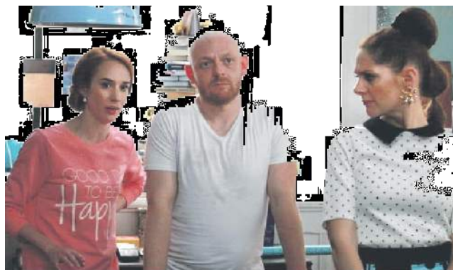
Všetko alebo nič.