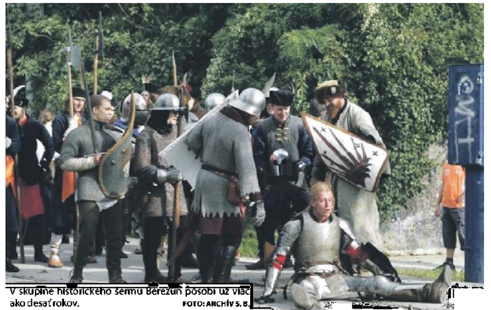
V skupine historického šermu Berezun pôsobi už viac ako desať rokov.

Rozprávky spód skalky na pokračovanie Nebo a peklo (pokračovanie z minulého čísla)