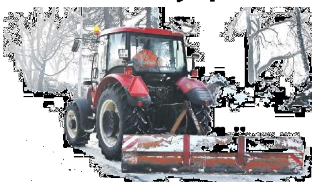
Technické služby majú vypracovaný operačný plán zimnej údržby.

„Je potrebné si uvedomiť, že postupujeme podľa schváleného operačného plánu, v ktorom sú určené priority a nie je technicky možné mať naraz „upratané celé mesto“. Prosím preto občanov o trpezlivosť a pochopenie, že niektoré úseky sú jed-