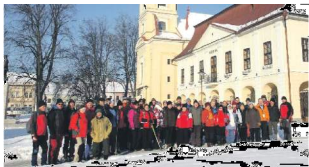
Účastníci Pochodu vďaky.