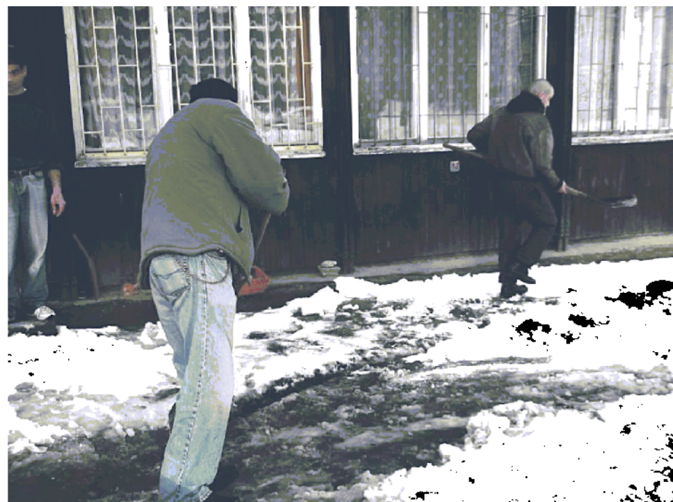
Aj v Brezne podáva mesto pomocnú ruku ľuďom bez domova.

Občania bez prístrešia majú možnosť celoročne využívať služby nízkoprahového denného centra, kde okrem osobnej hygieny si za poplatok môžu pripraviť jedlo. „Bezplatne ponúkame čaj a teplé oblečenie.