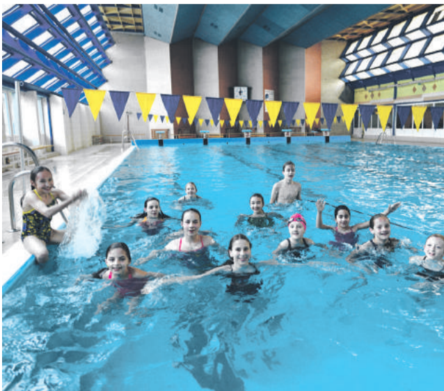
Milovníci plávania sa dočkali znovuotvorenia plavárne.