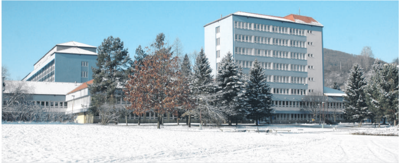
V prípade, že sa vedeniu nemocnice úspešne podarí zrealizovať zámery, občania Brezna a celého Horehronia budú mať k dispozícii moderné zdravotnícke zariadenie.

– Najproblémovnejšia je situácia pri získavaní zamestnancov na pracovnú pozíciu lekár a sestra, ale aj ich dlhodobšie udržanie na pracovisku. Zlepšenie pracovného prostredia, skvalitnenie a modernizácia prístrojovej techniky sa javia možným nástrojom na elimináciu odlivu. Rizikovým faktorom je však aj vysoký vek zdravotníckeho personálu a problémová je tiež fluktuácia zamestnancov. Vlani došlo k zmene na poste primárov detského a gynekologicko-pôrodnického oddelenia. Treba dodať, že napriek nepriaznivým okolnostiam v roku 2016 skončilo hospodárenie breznianskej nemocnice priaznivo.