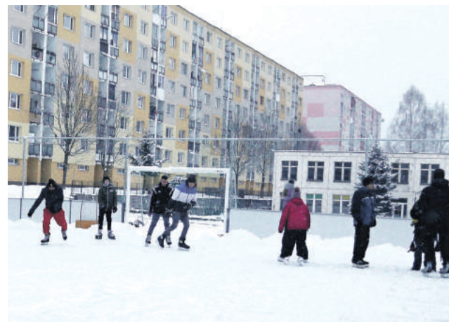
Záujem o korčuľovanie je veľký.