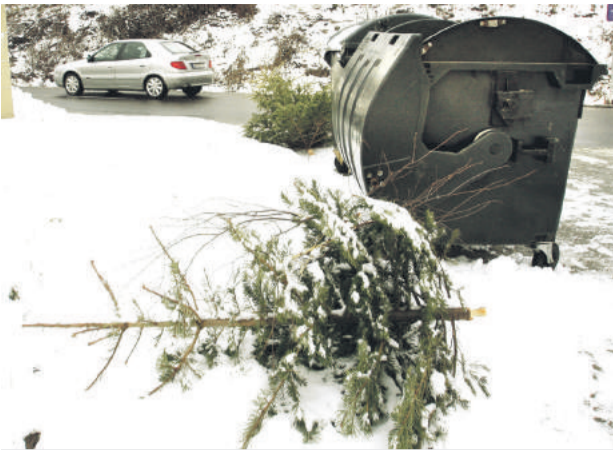
Stromčeky vyložte vedľa zberných nádob.