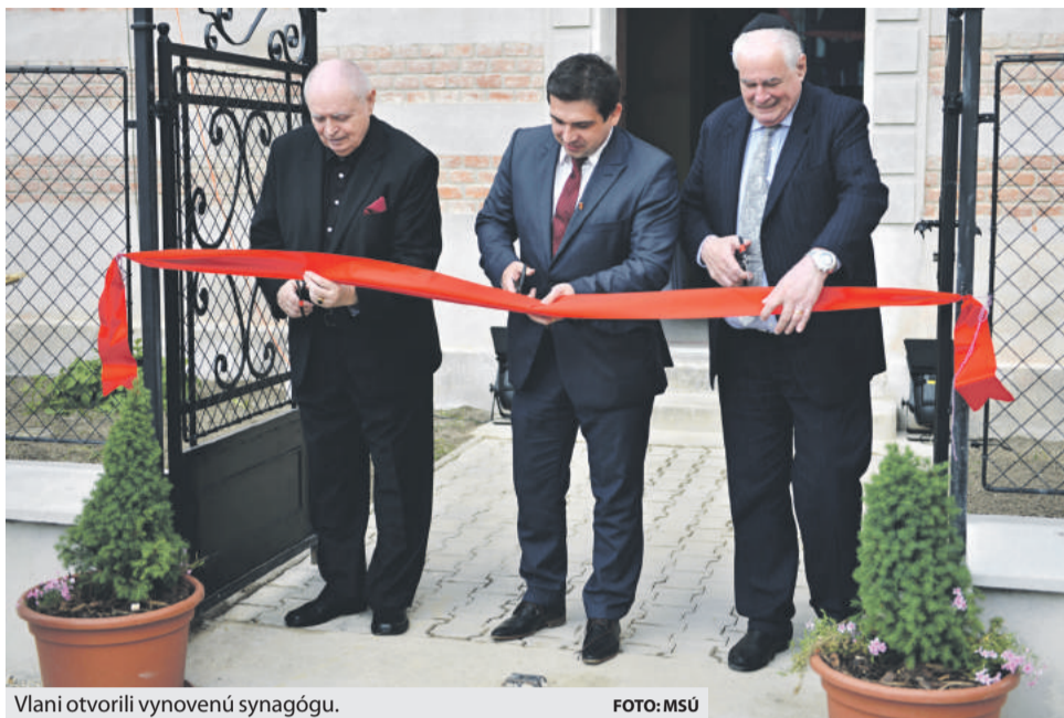
Vlni otvorili vynovenú synagógu.

S cieľom skvalitniť služby pre svojich občanov mesto opäť investovalo do modernizácie techniky na údržbu verejných