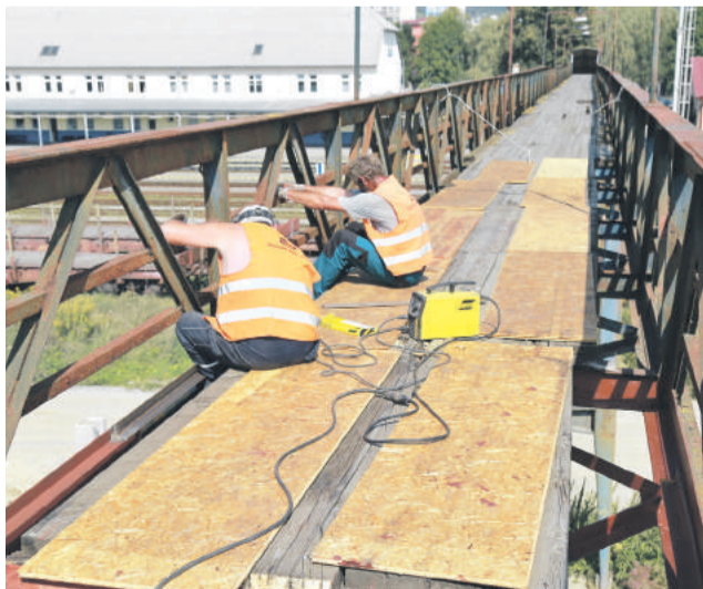
Takmer po ročnej uzávierke bola prístupná lavica ponad železničnú trať.