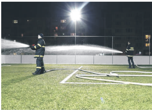
V spolupráci s dobrovoľnými hasičmi mesto prinavrátilo na najväčšie sídlisko v Brezne verejné klzisko.