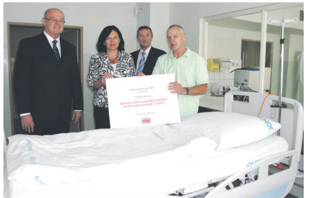
Nadácia Jednota Coop pred šiestimi rokmi venovala nemocnici elektricky polohovateľné lôžko.

Rozprávky PETER ZIFČÁK Spod skalky na pokračovanie Nebo a peko (pokračovanie z minulého čísla)