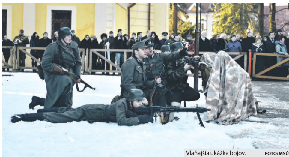
Vlaňajšia ukážka bojov.