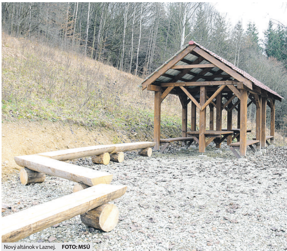
Nový altánok v Laznej.