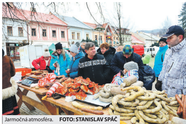
Jarmočná atmosféra.