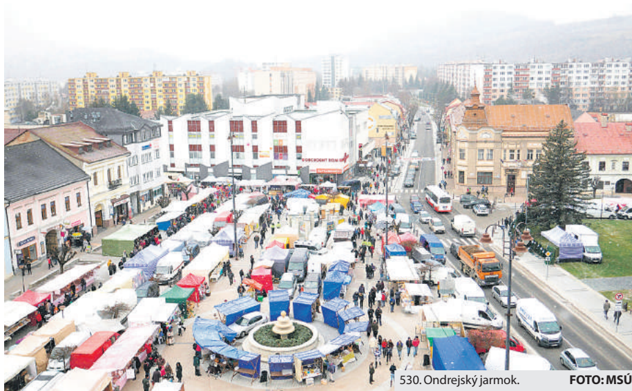
530. Ondrejský jarmok.

Núdzda nebola ani o všakovaký spotrebný tovar od výmyslu sveta, veď do met-