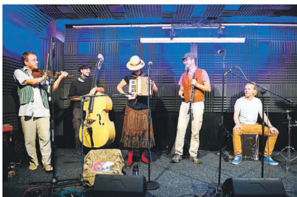
Kočovní hudobníci San Borondon Cyclo Fanfaria.