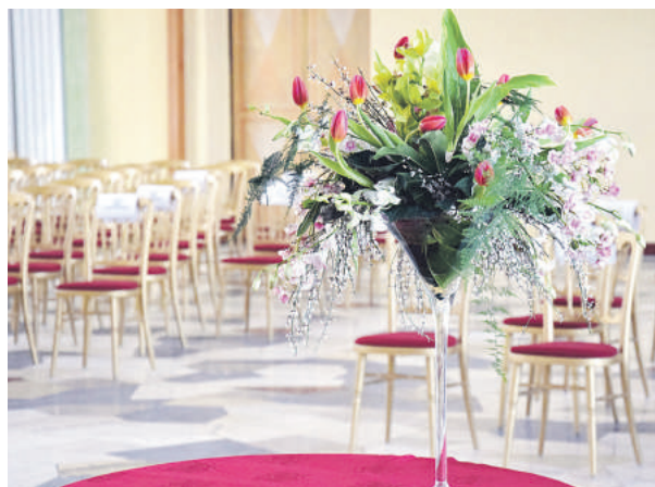
Ocenení si ceny prevezmú na slávnostnom zastupiteľstve.

Miestnej verejnosti dobre známe mená sa ocitli aj medzi laureátmi Ceny mesta Brezno. Za športový rozvoj mesta a jeho propagáciu