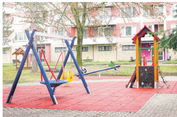
Novú podobu má už aj ihrisko na Krčulovej.

žovacia a pružinová hojdačka a hojdačka hniezdo. „Prvky boli osadené na pôvodnej betonovej ploche a v rámci bezpečnosti detí bolo dôležité v čo najkratšej dobe zrealizovať dopadové plochy v okolí jednotlivých hracích prvkov. Presne takáto istá zostava detského ihriska sa nachádza aj na trávinatej ploche za bytovým domom 9. mája 5 - 8 na Mazorníkove. Dopadové plochy na ňom budeme realizovať až v jarných mesiacoch,“ uzavrel šéf techničiarov. (md)