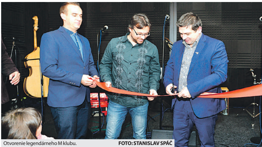
Otvorenie legendárneho M klubu.

V mestskom dome kultúry po rokoch opäť ožil priestor, ktorý sa stal pre mnohých kultový. Klub mladých známy ako M klub bol v sedemdesiatych rokoch minulého storočia miestom, kde mladí ľudia spoločne trávili voľný čas. Okrem divadelníkov sa