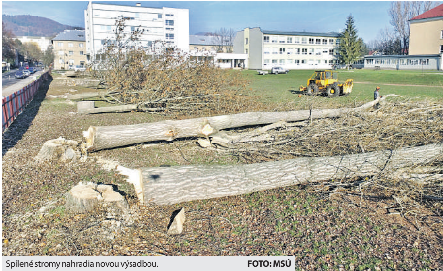
Spílené stromy nahradia novou výsadbou.

„Vybudovanie modernej atletickej dráhy vnímam ako odpoveď pre tú časť obyvateľov, ktorá tvrdí, že v Brezne sú dlhodobo podporované len niektoré športy,“ vyjadril sa pred