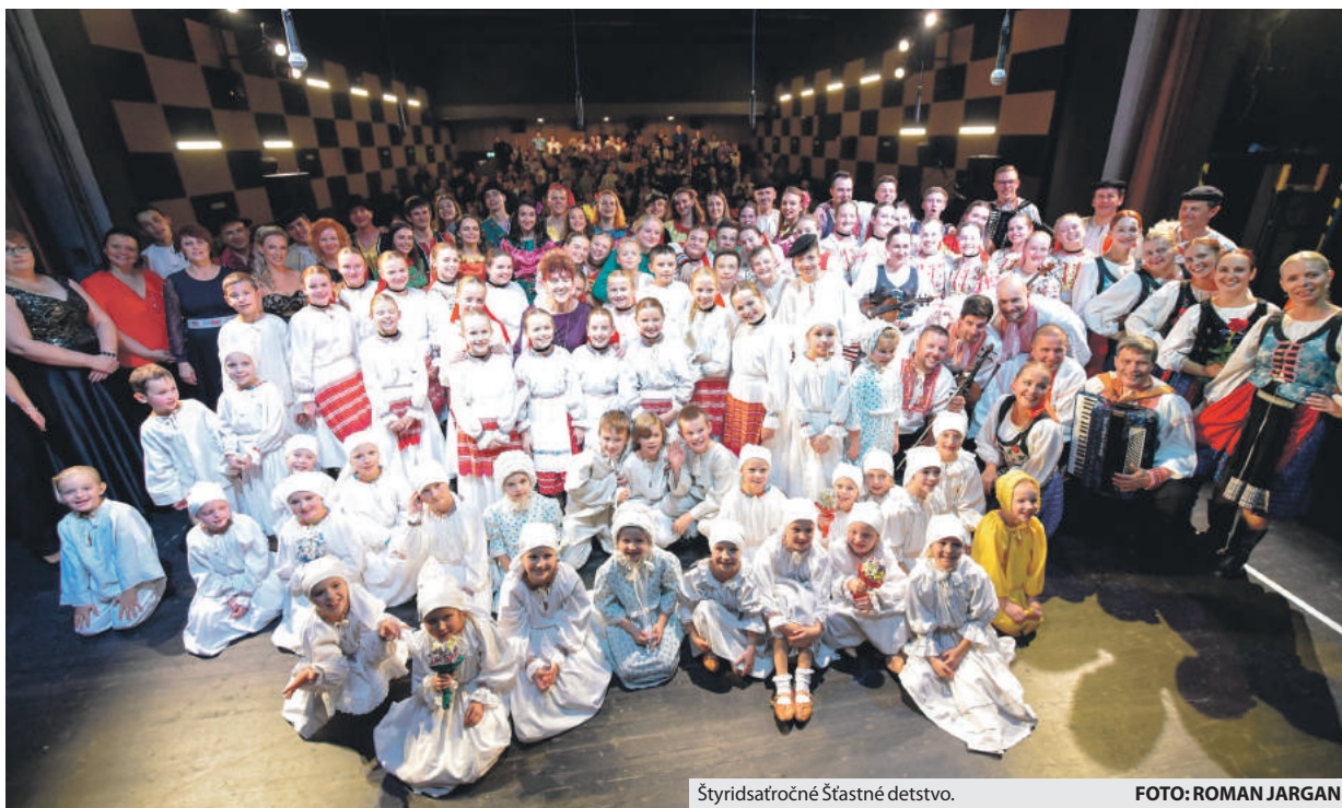
Štyridsaťročné Šťastné detstvo.