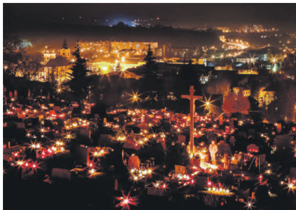
Sviatok všetkých svätých sa blíži.