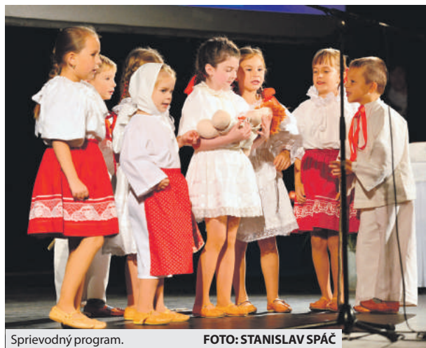
Sprievodný program.