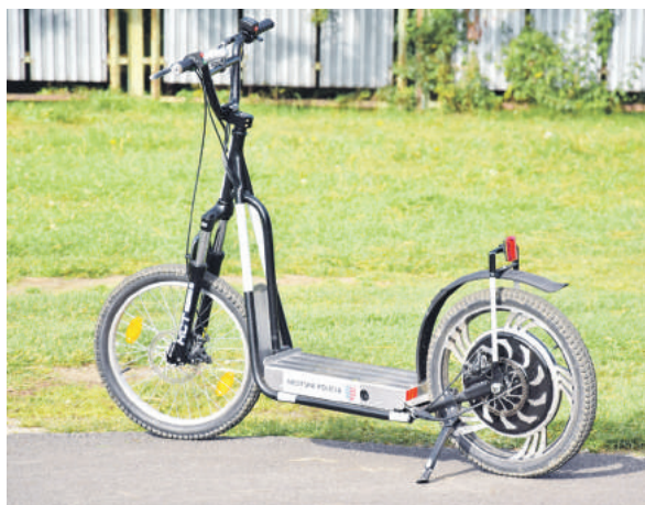
Elektrokolobežka prejde na jedno nabitie až 80 kilometrov.