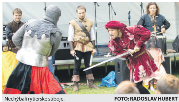
Nechýbali rytierske súboje.