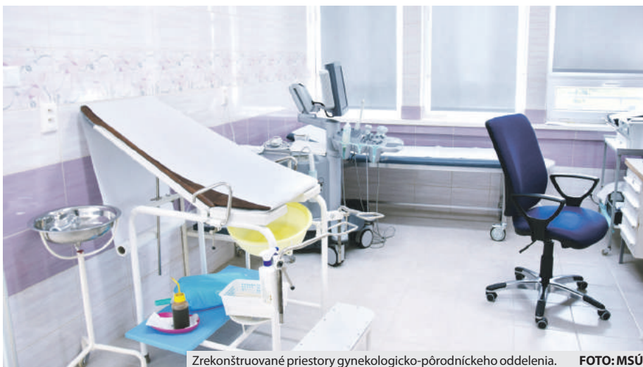
Zrekonštruované priestory gynekologicko-pôrodnického oddelenia.

Po vlaňajšej rekonštrukcii interného oddelenia prispela miestna samospráva aj na renováciu breznianskej pôrodnice.