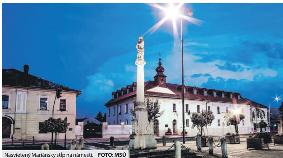
Nasvietený Mariánsky stĺp na námestí.