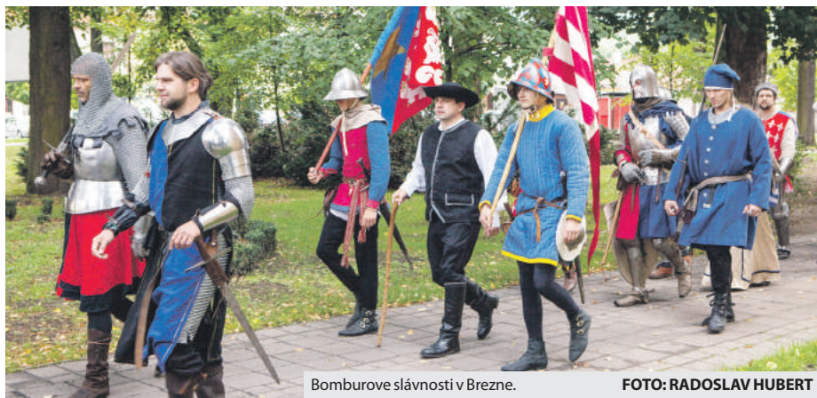
Bomburove slávnosti v Brezne.