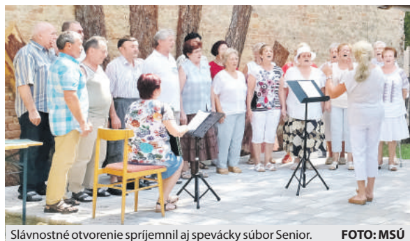
Slávnostné otvorenie spríjemnil aj spevácky súbor Senior.

Slávnostné otvorenie spríjemnili programom spevácky súbor Senior a divadelný súbor Studnička pri dennom centre Prameň. Ako sú spokojní seniori? „Je to niečo nové, uvidíme ako sa to rozbehne, ale veľmi sa teším.“ „Určite dobre padne v letných mesiacoch len tak si posediť, prečítať si časopis, vypiť kávičku a podebatovať. V Prameni máme aj spoločenské hry, keď mi prídu vnúčatá na prázdniny, zahráme si ich v záhrade, je to iná atmosféra.“ „Teším sa, ešte si trošku upravíme okolie na športovanie, prípadne sa potešíme bylinkami, ktoré si posadíme a budeme si variť čerstvý voňavý čajik.“