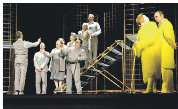
Divadlo Hugo z Pruského prídje na Chalupku po prvýkrát.

môžete sledovať na internetových stránkach www.sos-bb.sk , www.divadelnacha-lupka.sk a na rovnomennej facebookovej stránke. Viac neprezradíme, ale štrnásťročná, chlpatá, čierna a brč-