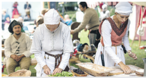
Príprava tradičných jedál.

Jedinečnú kombináciu cimbalu, huslí a svetových hitov ponúkol Cimbal Brothers, ktorý si vyslúžil poriadny aplauz. Návštevníci sa preniesli aj do vrcholného stredoveku rôznych kútov starej Európy, a to spoločne s plzenskou stredovekou hudbou Gothien.