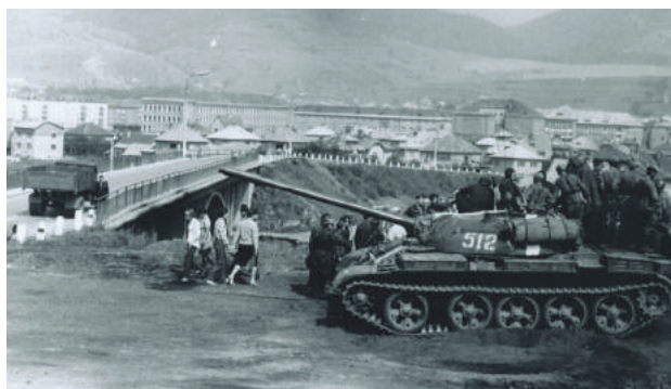
Sovietsky tank nad Baldovským mostom.

Bol 12. marec 1990, keď sme v Brezne zbadali kolónu sovietskych vojenských vozidiel, ktorá cez naše mesto