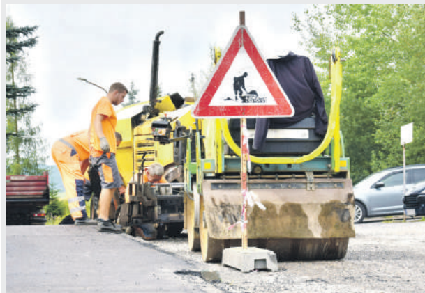
ILUSTRÁČNÉ FOTO: MSÚ