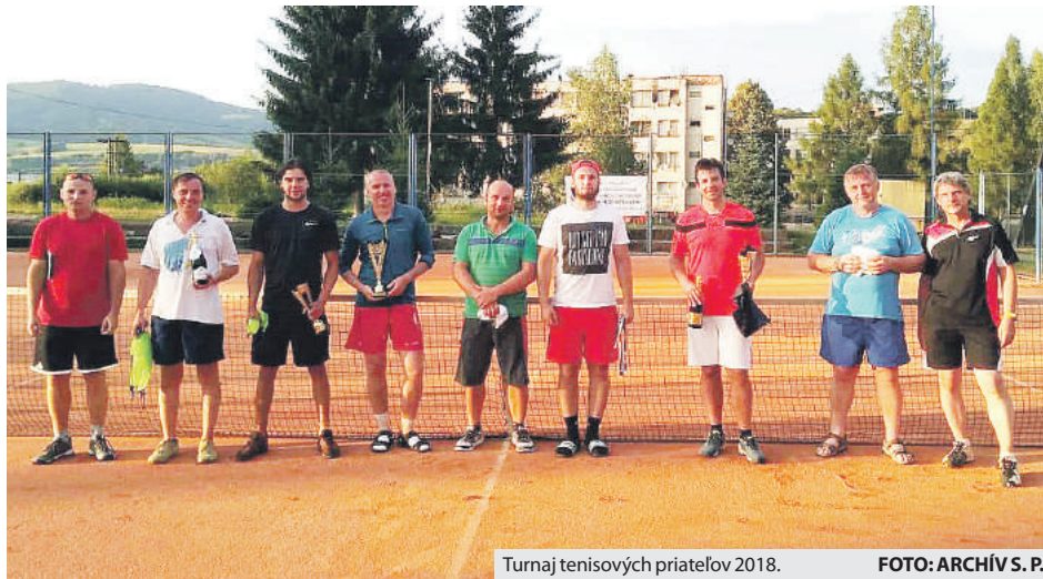
Turnaj tenisových priateľov 2018.