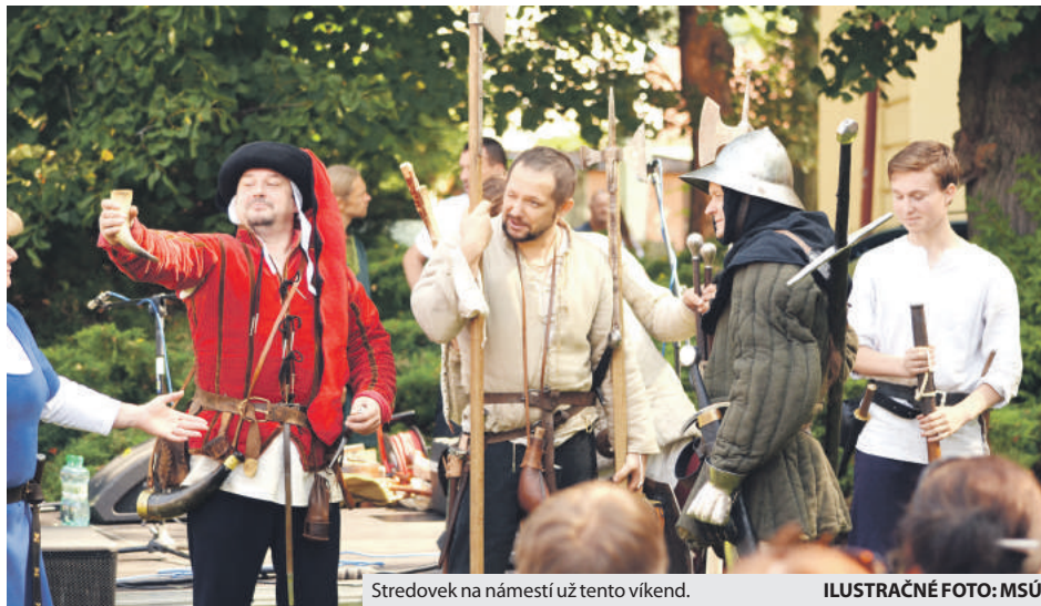
Stredovek na námestí už tento víkend.