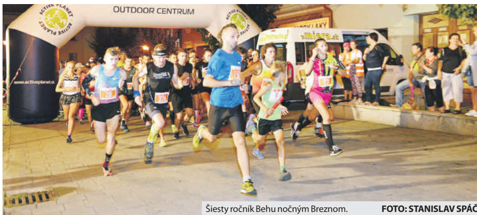
Šiesty ročník Behu nočným Breznom.

Športový večer odštartovala prekážková cyklojazda Hugo Bike Mini 2018, do ktorej sa zapojilo 21 detí na bicykloch či odrážadlách. Víťazom bol každý, kto absolvoval celú trasu pod pódiom na námestí. Program pokračoval Behom rodín s deťmi okolo námestia. Medzi verejnosťou sa stal už obľúbený, tento rok sa naňom zúčastnila dvadsiatka rodín. Všetci účastníci športového popoludnia si odniesli diplomy či medailu a ovocie. Prijemným sprestrením bola aj zumba.