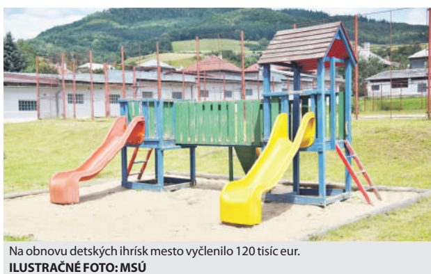
Na obnovu detských ihrísk mesto vyčlenilo 120 tisíc eur.

Hlavným cieľom výstavby a prevádzkovania ihrísk v mestskom prostredí je umožniť rodinám spoločne tráviť voľný čas a zároveň napomáhať rozvoju fyzických zručností detí, ako aj ich osobnostnému rastu či rozširovaniu sociálnych kontaktov. V meste je ich hneď niekoľko, no keďže pod značnú časť sa už stihol podpísať zub času, samospráva sa na základe záverov revízie kontroly rozhodla investovať do ich komplexnej renovácie. „Výsledkom je obnova a oprava detských