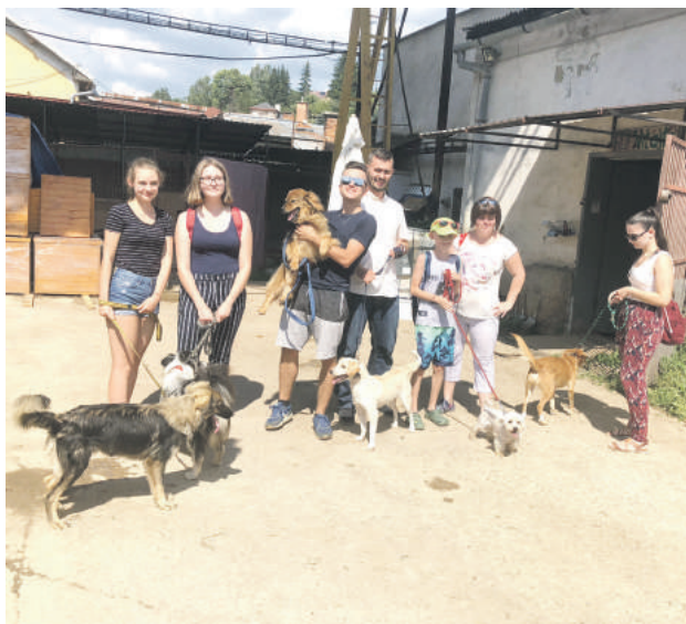
Aliancia stredoškôľakov v Tuláčiku.