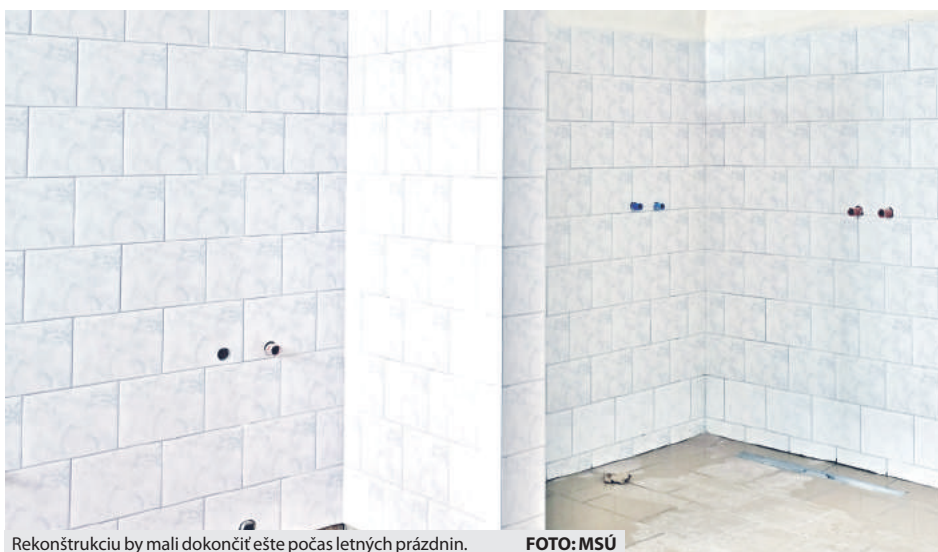
Rekonštrukciu by mali dokončiť ešte počas letných prázdnin.

Telocvičňa základnej školy na Mazorníkove patrí k najvyťaženejším mestským športoviskám. Okrem školských aktivít v rámci vyučovacieho procesu je domovským stánkom pre školský klub detí a tiež viaceré športové kluby, neziskové organizácie či občianske združenia pôsobiace v meste Brezne. V neposlednom rade sa tu pravidelne konajú aj rôzne športové a spoločenské podujatia. Mesto malo už dlhšie eminentný záujem o zrenovovanie tohto objektu a preto na jeseň 2017 podalo žiadosť o poskytnutie finančných prostriedkov na rozvoj výchovy a vzdelávania žiakov v oblasti telesnej a športovej výchovy formou