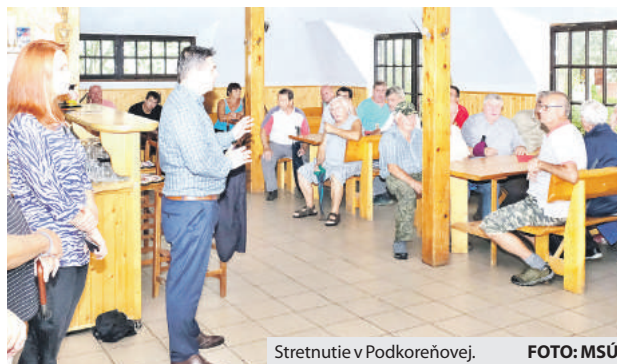
Stretnutie v Podkoreňovej.

Mesto taktiež požadovalo od občanov, ktorí majú vy-