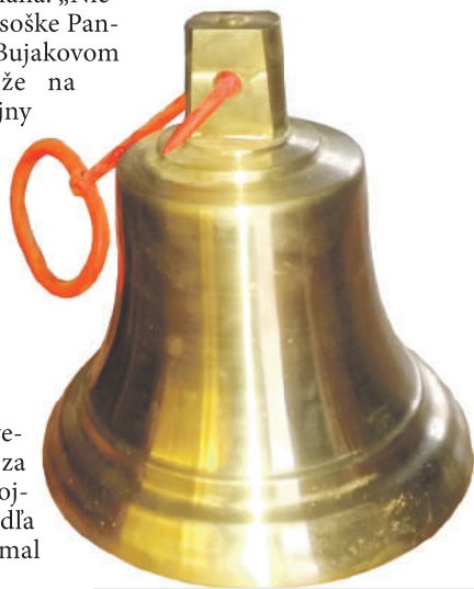
Miestni obyvatelia dali vyrobiť zvon.