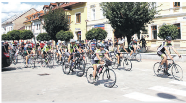
Cieľom podujatia je upriamiť pozornosť na významnú osobnosť našich dejín.

Spolok Martina Rázusa v spolupráci s mestom Liptovský Mikuláš a ŠK Leader Fox bike Liptovský Mikuláš zorganizovali už 17. ročník cykloturistického maratónu Po stopách Martina Rázusa, ktorý sa pre nepriaznivé počasie v sobotu uskutočnil na druhý deň v nedeľu. Cyklisti sa už tradične zišli v Liptovskom Mikuláši – Vrbici pri rodnom dome Martina Rázusa, odkiaľ krátko pred deviatou hodinou odštartovali po trase cez Čertovicu do Brezna, následne do Banskej Bystrice cez Donovaly naspäť do Liptovského