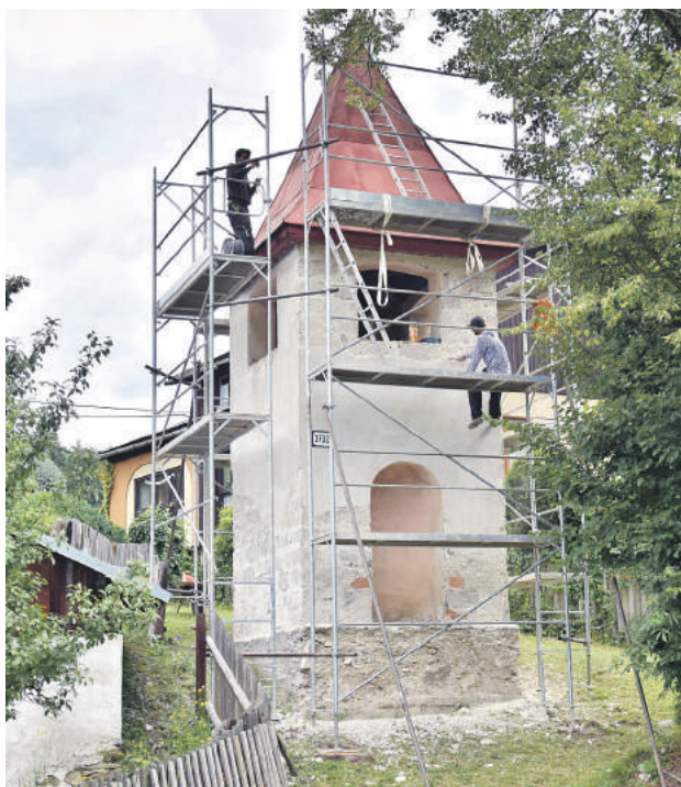
Mesto sa postaralo o renováciu zvoničky.