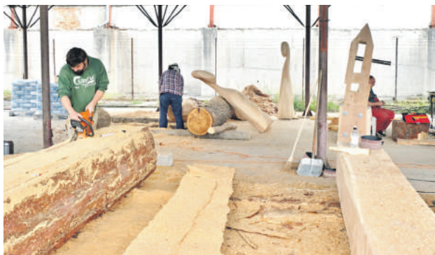
Umelci tvorili štrnásť zastavení krížovej cesty.

Uroveň sympózia ocenil aj dekan Fakulty výtvarných umení Akadémie umení v Banskej