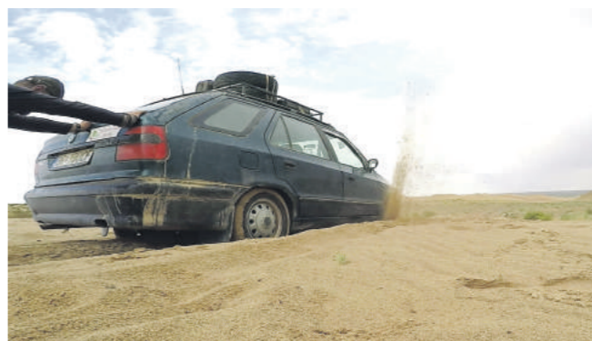
Problémy s EVkou.