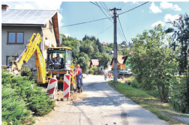
Výmena poruchového potrubia v mestskej časti Gliane.