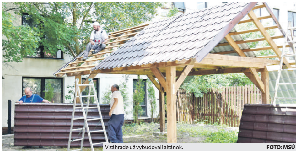
V záhrade už vybudovali altánok.

Záhrada sa nachádza v susedstve denného centra Prameň, pričom mesto sa dohodlo s majiteľmi, ktorí boli ochotní pomôcť a dali ju do užívania seniorom. Služiť bude predovšetkým na stretávanie seniorov, ťažko zdravotne postihnutých, ale aj rodín s deťmi na záujmovú činnosť. „Ide najmä o kultúrno-spoločenské, vzdelávacie a športové aktivity, v závislosti od ročnej doby a počasia. V záhrade bude predovšetkým miesto na sedenie, s altánkom a lavicami na oddych,“ uviedla vedúca odboru starostlivosti o obyvateľa mestského úradu