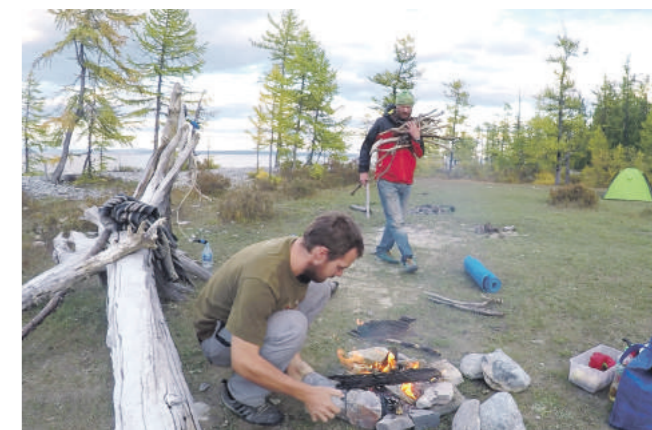
Stanovanie a kempingové stravovanie.

- Nemienim tu filozofovať, no rozhodne sa teraz menej zaoberám malichernosťami bežného