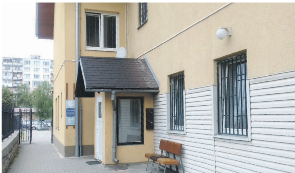
Pohotovosť v Brezne.

– Novela zákona o zdravotnej starostlivosti zásadným spôsobom mení organizáciu poskytovania zdravotnej starostlivosti po ordinačných hodinách všeobecných lekárov. Lekárska služba prvej pomoci je premenovaná na ambulantnú pohotovostnú službu a je určitým pokračovaním poskytovania zdravotnej starostlivosti všeobecným lekárom pre dospelých po ordinačných hodinách pre tých pacientov, ktorým sa zhoršil zdravotný stav po riadnych ordinačných hodinách ich ošetrojúceho lekára. Nejde však o život ohrožujúce stavy. Tie patria do kompetencie záchrannej služby. Taktiež pohotovostná služba nebude