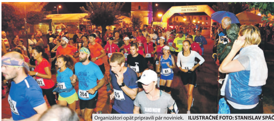
Organizátori opäť pripravili pár noviniek.

Dva behy z pilotného projektu už prebehli. Prvý sa uskutočnil v Jasení pod názvom Beh ulicami Jasenia a ten pod názvom Beh oslobodenia obce Dolná Lehota a 1. slovenského kozmonauta. Bežcov na tomto „nultom“ alebo „zahrievacom“ ročníku bežeckej ligy čakajú ešte štyri behy vrátane Behu nočným Breznom. Naplno sa Hore-