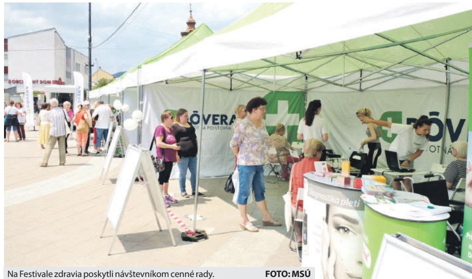
Na Festivale zdravia poskytli návštevníkom cenné rady.

Festival zdravia je unikátny projekt zdravotnej poisťovne Dôvera plný atraktívneho programu zameraného na tému starostlivosti o svoje zdravie a dôležitosti prevencie pred ochoreniami. Koncom júna zavítal aj do Brezna, kde na námestí návštevníkov čakali odborníci, ktorí merali hladinu cukru v krvi, tlak, zistili krvnú skupinu, vyšetrili chodidlá, diagnostikovali pleť. Organizátori mysleli aj na najmenších, pripravili pre