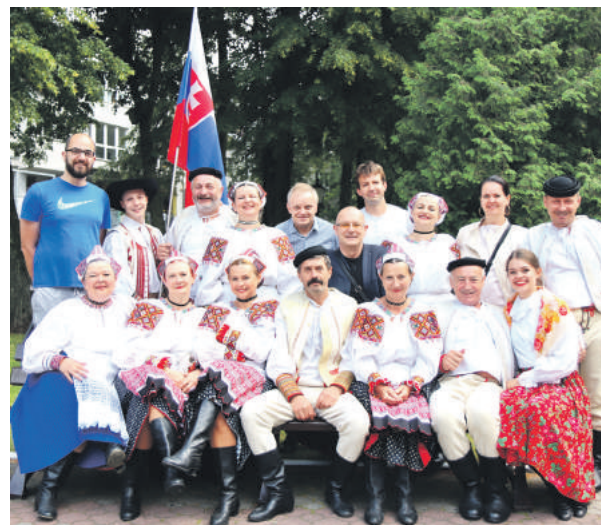
Partnerské dni v Ciechanówe boli plné folklóru a porozumenia. FOTO: MSÚ

Že v kultúrnej spolupráci máme na čom stavať, dokázali priamo v Ciechanówe členovia Folklórneho súboru Mostár, ktorí naše mesto vzorne reprezentovali na medzinárodnom festivale folklórnych súborov Kupalnocka 2018. Tu sa okrem nich predstavil aj domáci folklórny kolektív a taktiež súbor z českého Veľkého Těšína. V piatkovom večernom pásme vystupovali naši súboristi až na záver programu a napriek chladnému počasiu sa im podarilo zahriať a roztancovať prítomných poľských divákov. Na druhý deň sa miestnemu publiku Mostárenci predstavili ešte raz a to v areáli pred kultúrnym strediskom v Ciechanówe, kde prebehla tradičná slávnosť spojená s hádzaním kvetinových vencov do rieky. Týmto však zábava ani zďaleka nekončila a večer sa folkloristi stretli opäť, kedy už bez striktného scenára rozprúdili zábavu plnú hudby, spevu a tanca, ktoré sa ozývali Poľskom do neskorých večerných hodín. Všetci zúčastnení sa zhodli na tom, že spoločné kultúrne tradície by mali byť základom vzájomnej partnerskej spolupráce aj do budúcnosti. Zároveň svorne veria, že sa na podobnej vydatenej akcii slovenský a poľský folklór stretnú opäť a to buď v Ciechanówe alebo u nás v Brezne. (sp)