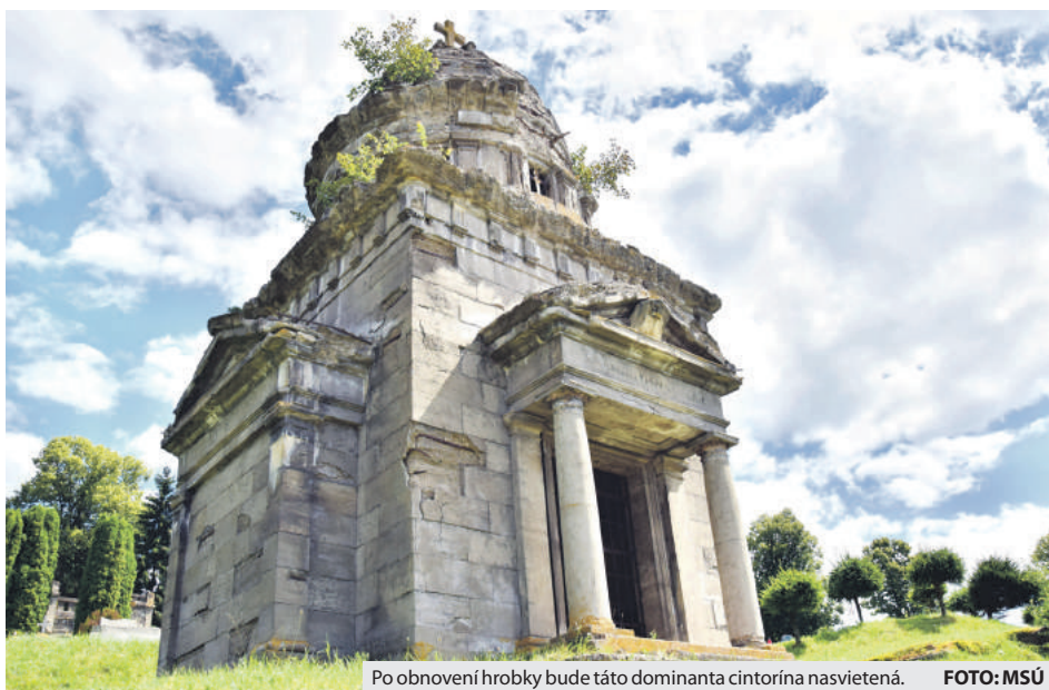
Po obnovení hrobky bude táto dominanta cintorína nasvietená.