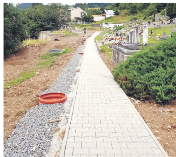
Nový chodník na starom cintoríne.