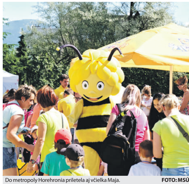
Do metropoly Horehronia priletela aj včielka Maja.