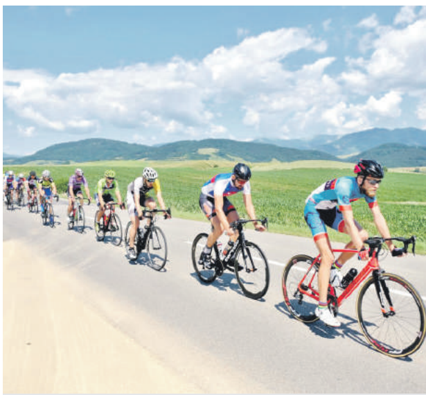
Biketour Horehroním 2018.

Na druhý deň 17. júna sa v Brezne uskutočnil Maratón Tour Route 66. Štart aj cieľ pretekov bol situovaný v mestskom parku. Pretekári zdolali 123 km dlhý okruh a pre menej zdatných bol pripravený 59 km dlhý okruh krásnou horehronskou prírodou. Pretekári doslova preleteli na bicykloch krásnymi miestami Horehronia ako je Salaš Zbojská, Červená Skala, Helpa či iné miesta. Súčasťou