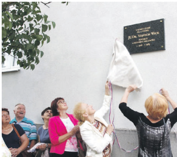
Odhalenie pamätnej tabule.