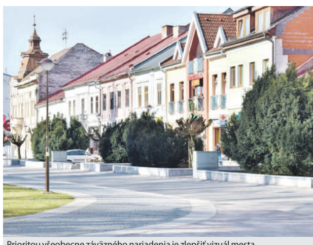
Prioritou všeobecne záväzného nariadenia je zlepšiť vizuál mesta.

Finančný príspevok v maximálnej výške 2000 eur na jeden projekt je možné použiť na rekonštrukciu, opravy a udržiavacie práce, na výmenu a rekonštrukciu dverí, brán, okien, výkladov, výmenu strešnej krytiny, reštaurovanie a obnovu hodnotných historických artefaktov a architektonických prvkov z uličnej fasády budov. Rovnako sa vzťahuje aj na práce týkajúce sa pamiatkového výskumu, nasviety fasád budov a v odôvodnených prípadoch aj na nové objekty postavené v pôvodnej zástavbe. Podmienkou získania dotácie je ale finančná spoluúčasť žiadateľa vo výške minimálne 50 % z celkových predpokladaných