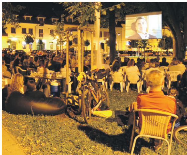
V lete nebude chýbať premietanie v parku.

Premietanie v parku tento rok ponúkne oddychovky, romantiku a veľa humoru. V