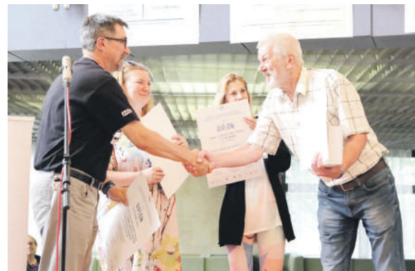
Hra Trinásta hodina uspela aj do tretice.