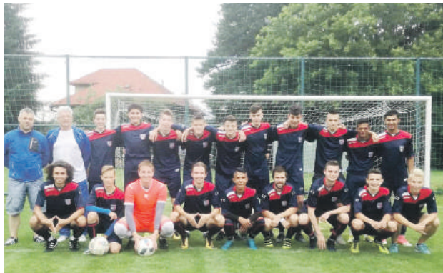
Brezňianski futbaloví dorastenci postúpili do tretej ligy.