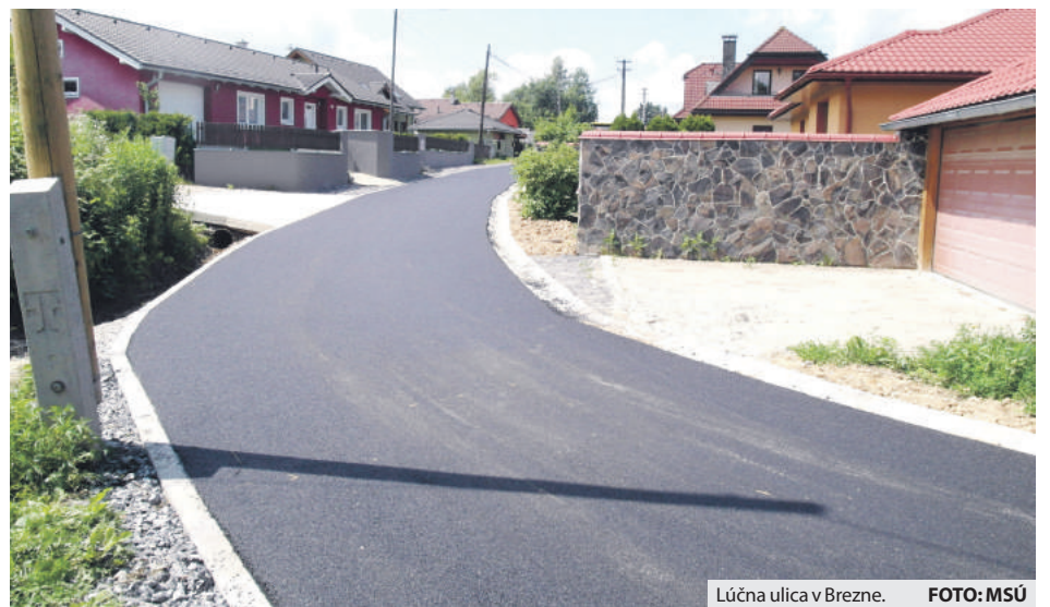
Lúčna ulica v Brezne.