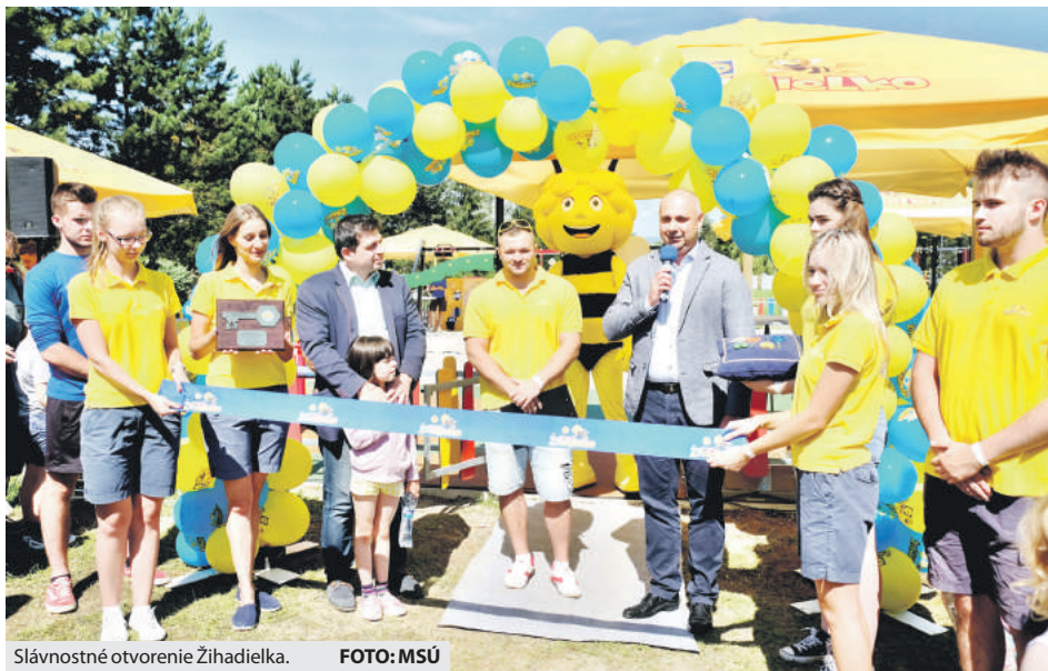
Slávnostné otvorenie Žihadielka.