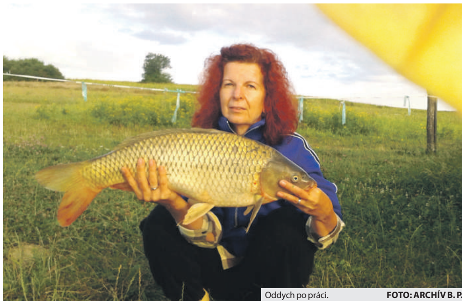
Oddych po práci.

■ nemenej dôležitou povinnosťou mešťanov bol spôsob odievania. Nariadenie stanovovalo: „Zvlášte pak mají se merkovati osoby v úradiech postavené, aby všudy i pri domiech v počtívých šatách