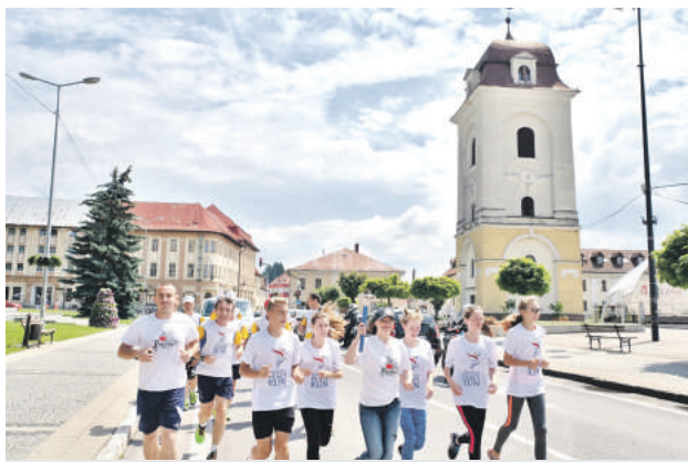
Myšlienkou Mierového behu podporilo aj Brezno.

Štafeta vyštartovala 27. februára v hlavnom meste Bulharska v Sofii a po viac