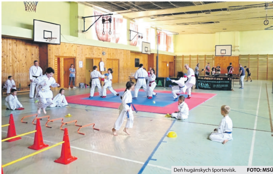
Deň hugánskych športovísk.

V sobotu 16. júna boli pre širokú brezniansku verejnosť k dispozícii takmer všetky športoviská na území mesta. Od rána najskôr v Aréne a na blízkom multifunkčnom ihrisku prezentovali svoju činnosť hokejový, florbalový, krasokorčuliarsky a volejbalový klub. Rovnako v dopoludňajších hodinách sa v priestoroch základnej školy na Mazorníku predstavili stolní tenisti s karatistami. Popoludní prišlo v teplom počasí na rad aj príjemné osvieženie, keďže prvý popoludňajší blok prebiehal na tenisových kurtach a na plavárni. Deň plný športu vyvrcholil v areáli fut-