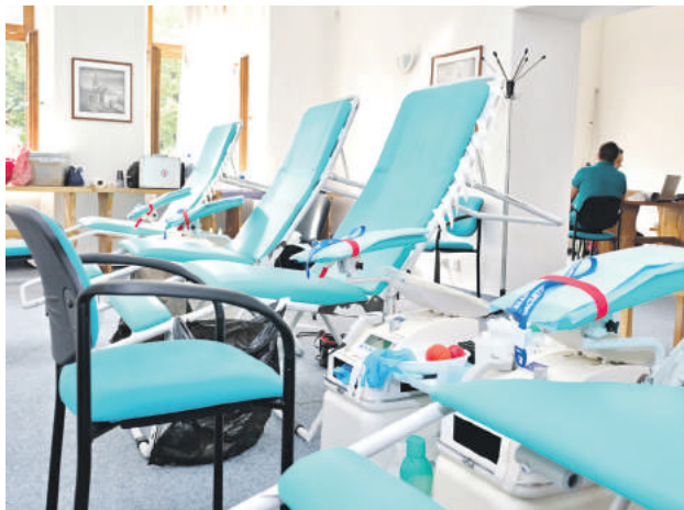
Svetový deň darcov krvi si pripomenuli aj v Brezne.

Presne 14. júna pred 150 rokmi sa narodil Karl Landsteiner, lekár a nositeľ Nobelovej ceny za medicínu a fyziológiu, ktorý ako prvý určil systém krvných skupín. Na jeho počesť je od roku 2004 tento deň vyhlásený za Svetový deň darcov krvi, ktorým si verejnosť pripomína, aké dôležité je darcovstvo a každá kvapka zachraňujúca život a zdravie ľudí v núdzi. Heslom tohtoročnej kampane je slogan: Buď tu pre druhých. Daruj krv. Daruj život. Aj miestny spolok Slovenského Červeného kríža v spolupráci s Národnou transfúznou službou Banská Bystrica a mestom Brezno sa zapojili do tejto iniciatívy a v predvečer oficiálneho Dňa darcov krvi zorganizovali mobilný odber, do ktorého okrem zamestnancov mesta, Technických služieb, Lesov mesta Brezno a poslancov mest-