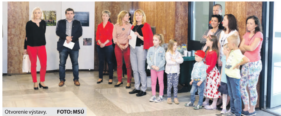
Otvorenie výstavy.