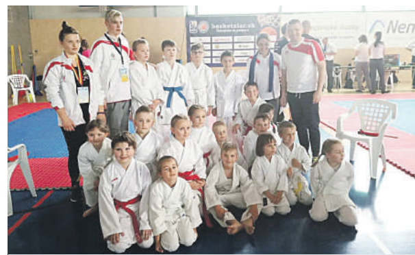
Úspešná výprava z Brezna.