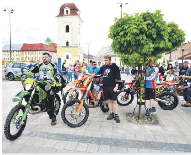
Enduro 2018 v Brezne.

Počas prvého májového víkendy sa v Brezne uskutočnilo tretie podujatie tohtoročného deväťdielneho seriálu