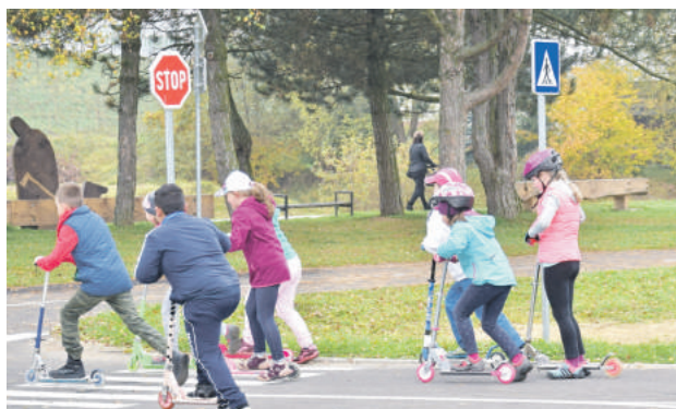
Dopravné ihrisko slúži svojmu pôvodnému účelu.

V každodennom živote sa stávame účastníkmi cestnej premávky či už ako chodci, cyklisti, prípadne ako cestujúci v prostriedkoch hromadnej alebo osobnej dopravy. Základné vedomosti zamerané na bezpečné správanie sa v rôznych dopravných situá-