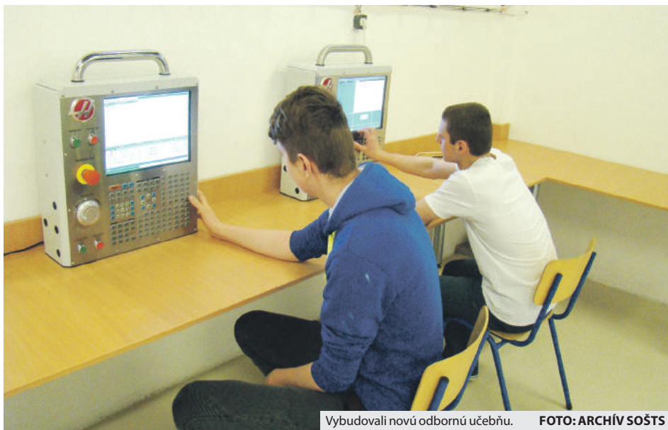
Vybudovali novú odbornú učebňu.