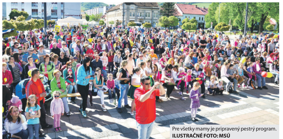
Pre všetky mamy je pripravený pestrý program.