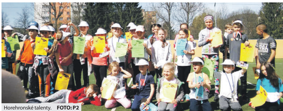
Horehronské talenty. FOTO:P2