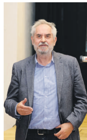
Autor filmu Štefánik - príbeh hrdinu Pavol Kanis.