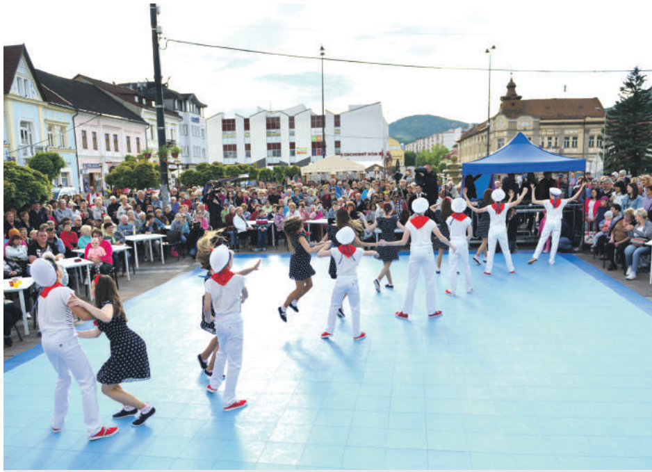
Nebude chýbať obľúbená Kaviareň pod mestskou vežou.

Bohatá ponuka sprievodných podujatí je pevnou súčasťou programu Dní mesta už niekoľko rokov a dotvára jeho slávnostnú atmosféru. Týždeň od 21. mája prinesie naozaj pestrú zmes aktivít pre športovcov i kultúrne založené publikum. Celé to odštartuje stredajší XXI. ročník Okresnej olympiády materských škôl, kde budú v tradičných disciplínach súťažiť najmenší športovci z Brezna a okolitých obcí. V ten istý deň v popoludňajších hodinách sa uskutoční zaujímavý exhibičný futbalový zápas mužov medzi Breznom a Podbrezovou. V približne rovnakom čase bude prebiehať aj Záhradný koncert žiakov a učiteľov ZUŠ Brezno, známy svojou výni-