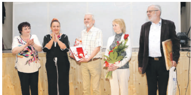
V Rakovej si prevzali cenu za tvorivý prínos.