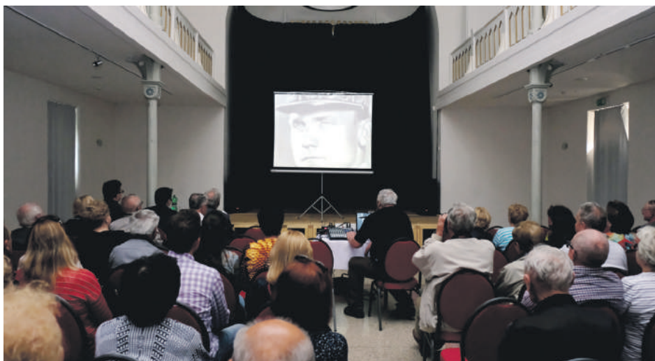
Premietanie dokumentu v synagóge.

Aj počas pôsobenia Pavla Kanisa na poste ministra