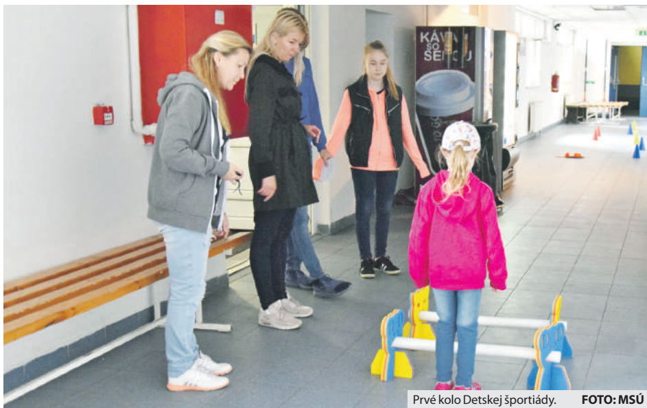
Prvé kolo Detskej športtiády.