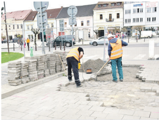
Opravujú všetky časti s uvoľnenou dlažbou.

„Obnovujeme všetky časti s uvoľnenou dlažbou, aby prejazd vozidiel námestím bol bezpečný. Zatiaľ riešime opravy pri zabezpečení prejazdnosti týchto ciest, pričom rekonštrukcia je podmienená technologickým a poveter-