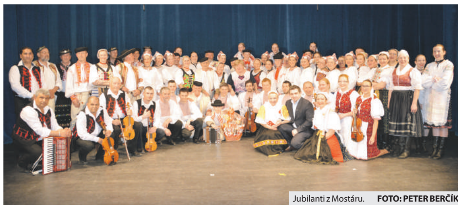
Jubilanti z Mostár.

Vo folklórnom súbore sa za 63 rokov vystriedalo viac ako 550 účinkujúcich, veľa z nich sa ešte stále venuje folklóru a hre na rôzne ľudové nástroje, takže o tzv. „hostí“ mali postarané. Predstavil sa komplet celý súbor so svojimi sólistami. Najmladším účinkujúcim bol 10-ročný heligonkár a najstarším jeho 72-ročný starý otec. (md)