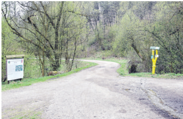
Dlhší okruh povedie aj lokalitou ponad nemocnicu.

Po dvoch ročníkoch jarného behu ulicami centrálnej časti mesta, ktoré neprilákali väčší počet bežcov, chcela prísť samospráva s novým zaujímavým podujatím podobného charakteru. Pomocnú ruku im podali členovia mestského mládežníckeho parlamentu, ktorí prišli s myšlienkou selfie behu. Ten sa od klasického líši hlavne tým, že účastníci sa popri absolvovaní stanovenej trasy musia zároveň od fotiť na vopred určených miestach. Rozhodujúci teda nie je len čas, ale aj schopnosť zvoliť si čo najlepšiu trasu a vhodné poradie vyhotovenia fotiek. Všetci súťažiaci tak budú mať možnosť vyfotiť sa na zaujímavých miestach, popri ktorých možno denne chodia, no do-