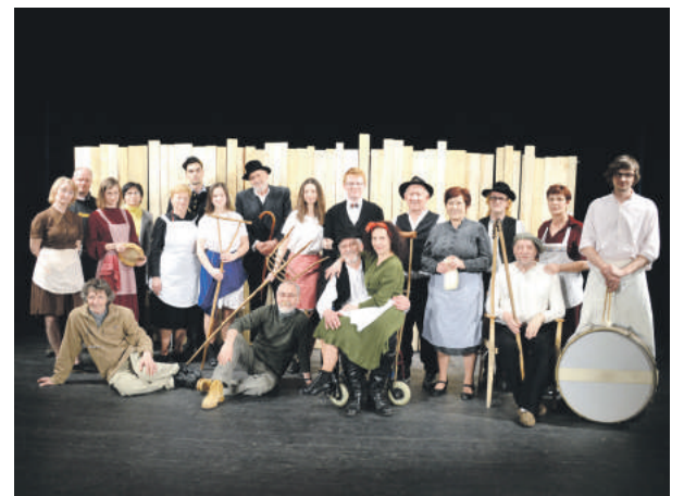
Chalupkovci v najbližšej dobe sľubujú reprízu.