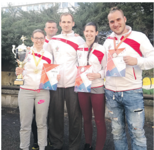
Úspešná breznianska výprava.