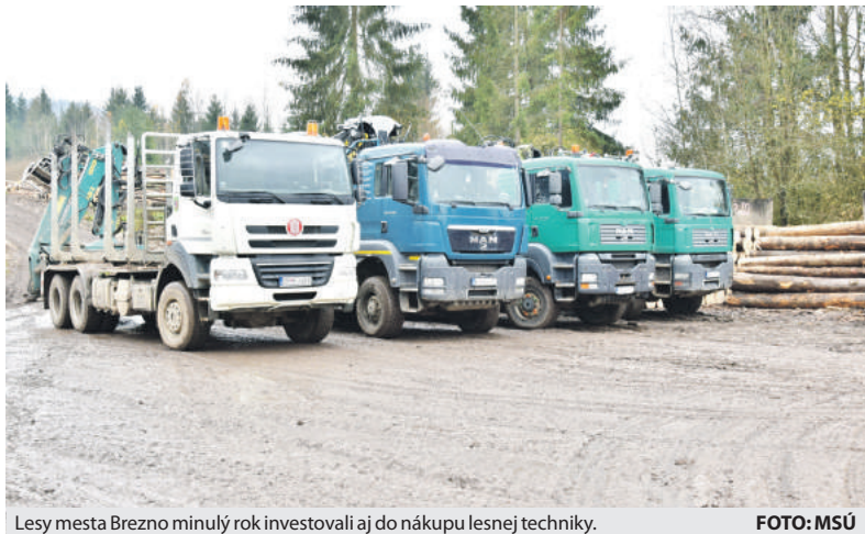
Lesy mesta Brezno minulý rok investovali aj do nákupu lesnej techniky.