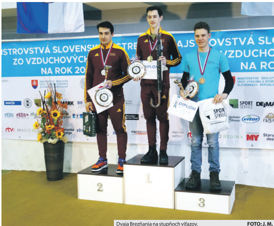
Dvaja Brezňania na stupňoch víťazov.