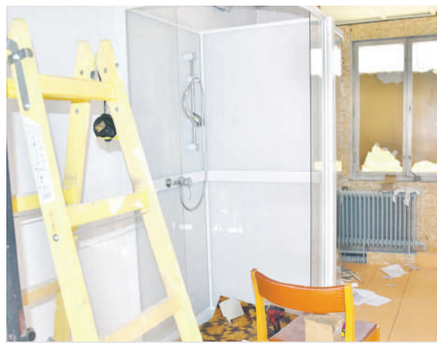
Obnovili toalety a sprchy.

Technických služieb od začiatku februára do utorka minulého týždňa odpracovali 264 hodín. „Opravili všetky podlahové krytiny, ukončili práce vo všetkých izbách, spoločenskej miestnosti či kancelárii, obnovili sociálne zariadenie – prvé WC a sprchy. V priestoroch kuchynky na-