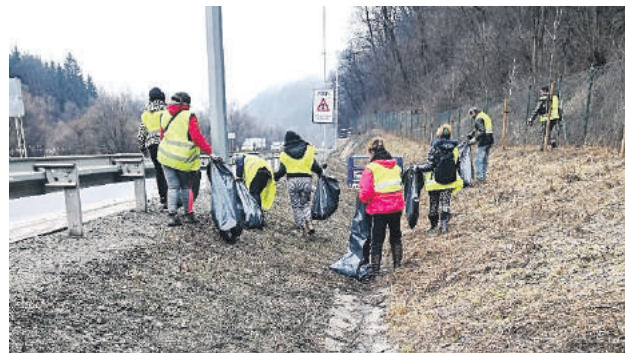
Popri ceste vyzbierali viac ako tonu odpadu.