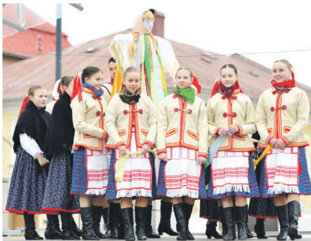
Zvyky našich predkov.

V predkresťanskom období ľudia verili, že prírodu ovládajú nadprirodzené sily. Zároveň boli presvedčení, že ich konanie možno ovplyvniť rôznymi obradmi. Patrí k nim aj vynášanie Moreny, staroslovenskej bohyně zimy a smrti. Ak ľudia chceli, aby prišla jar, museli ju utopiť v potoku alebo upáliť. Verili, že jej zničením vyženú nebezpečné choroby a smrť, vypudia z dediny nečisté sily, ktoré zdržiavajú vegetáciu, no predovšetkým urýchlia odchod zimy. Pripravili si slamenú figurínu a obliekli ju do kroja. Ľudia z dediny pritom ochotne ve-