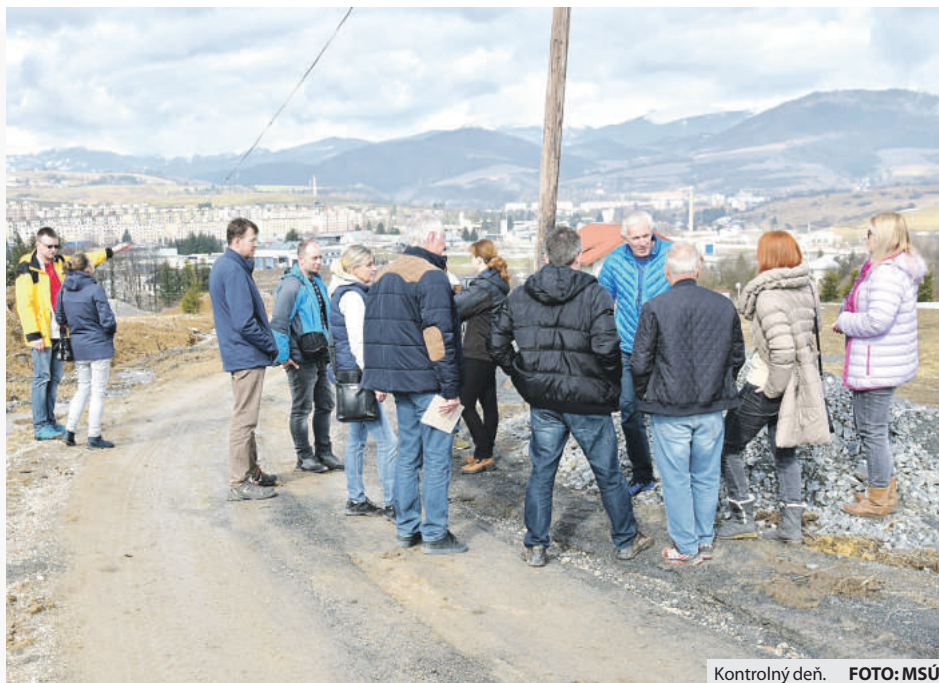
Kontrolný deň.