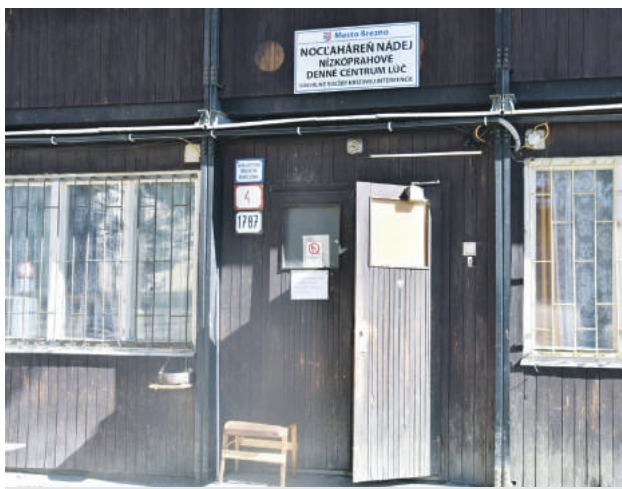
Technický stav budovy bol nevyhovujúci.

Technické služby realizujú rozsiahle opravy objektu na Mládežníckej 4 v Breznej oproti mestskej plavárni. Mesto rozhodlo o rekonštrukcii budovy, pretože jej technický stav bol nevyhovujúci. Celoročne v nej poskytuje sociálne služby ľuďom bez domova, pričom v nocľahárni Nádej ich momentálne využíva 24 klientov, v nízkoprahovom dennom centre Lúč