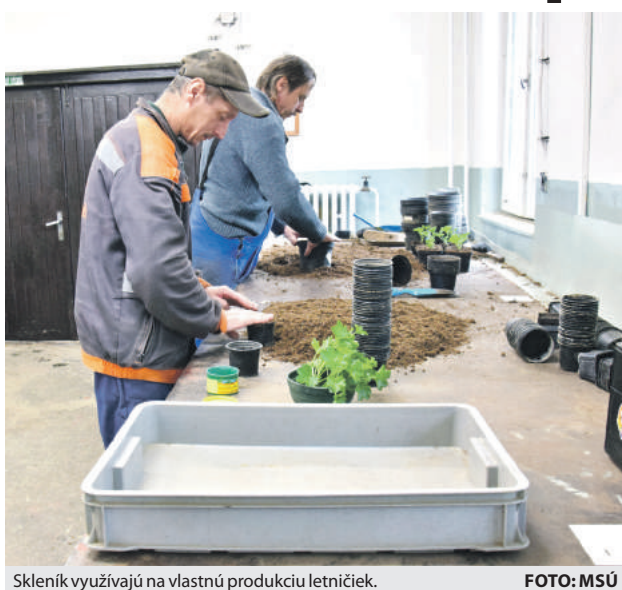
Skleníku využívajú na vlastnú produkciu letničiek.

Skleníku využívajú aj Technické služby, a to na vlastnú