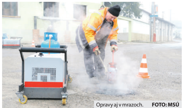
Opravy aj v mrazoch.