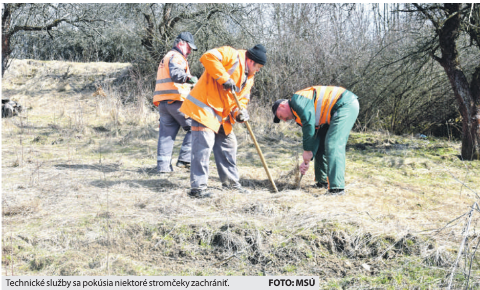
Technické služby sa pokúsia niektoré stromčeky zachrániť.

V areáli na Banisku rodičia od roku 2014 sadili stromčeky pre svoje narodené deti. Táto aktivita občianskeho združenia Horehronská banská cesta v jarných a jesenných mesiacoch sa už stala v Brezne tradíciou. Posadili tak asi osemdesiat ovocných drevín a kríkov, a to hlavne jablone, hrušky, slivky, čerešne, orech a morušu. Takmer všetky však postihol krutý osud, keď väčšina z nich vyschla z dôvodu podrytia diviakmi a obhryzenia hlodavcami. Technické služby ich po posúdení životaschopnosti vytiahli zo zeme a možno desať z nich sa im podarí zachrániť. Ako informovala