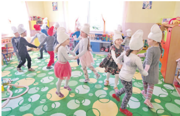
Škôlkari sa vedeniu mesta odmenili spevom a tancom.