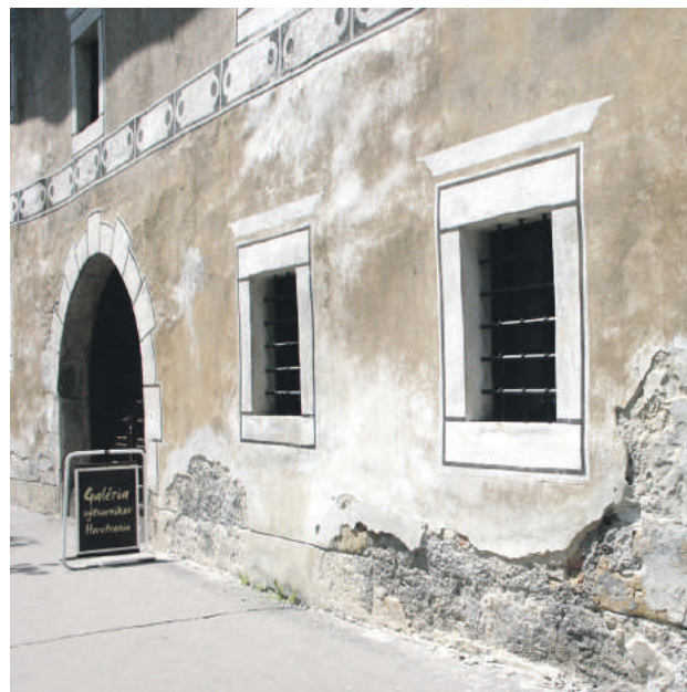
Stav pred pamiatkovou obnovou fasády (2004).