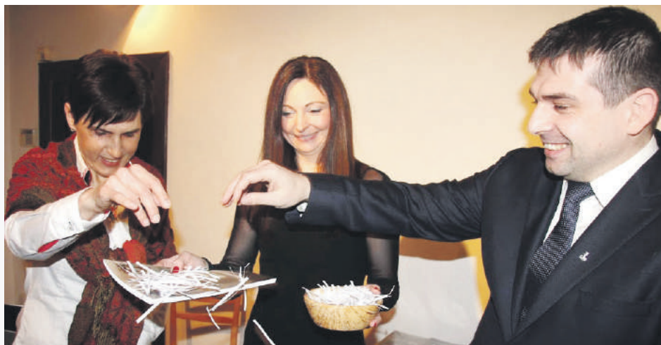
Krstilo sa rozstrihanými útržkami papierov z pôvodných verzií spomienok.