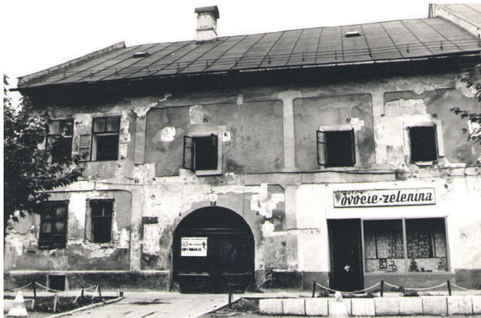
Stav pred adaptáciou objektu, 80. roky 20. storočia.