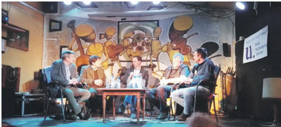
Diskusiu o lese chceli organizátori reagovať na dianie v našich horstvách.