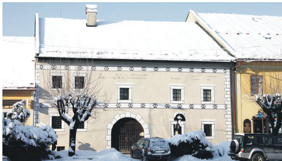
Stav po pamiatkovej obnove fasády (2010).