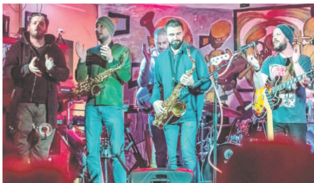
Kapela CHA BUD.