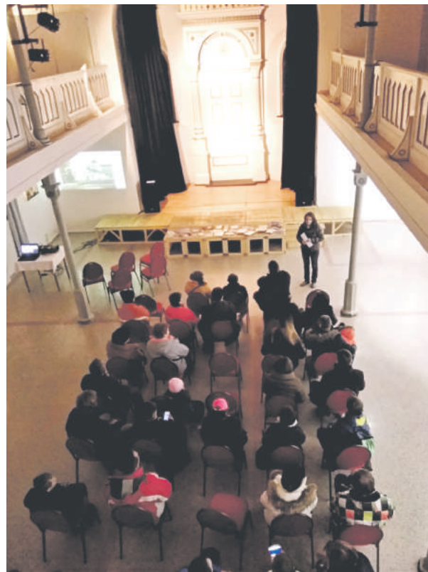
Sprevádzané prehliadky budú mať pokračovanie.