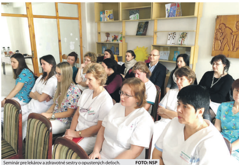
Seminár pre lekárov a zdravotné sestry o opustených deťoch.

„Uvedomujeme si, ako je pre každého z nás potrebná blízkosť druhého človeka, a to počnúc narodením a končiac smrťou. Zvlášť u detí je blízkosť rodičov, resp. iných osôb, ktoré rodičov nahrádzajú, nevyhnutná. Nepochybujeme o tom, že u novorodencov ab-