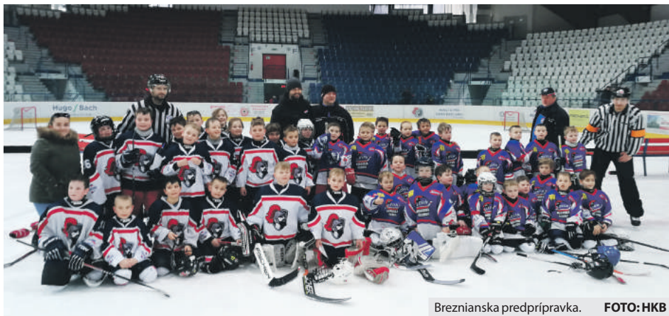
Breznianska predprípravka.