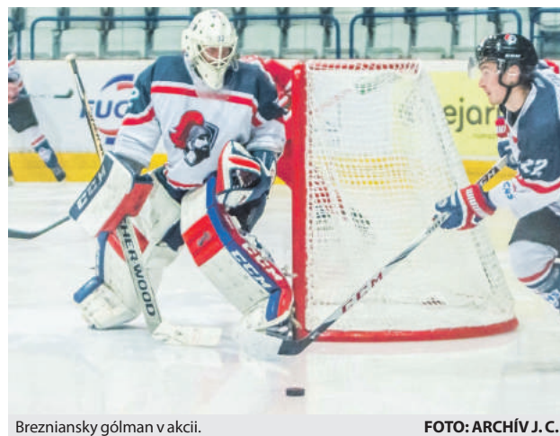
Brezniansky gólman v akcii.

- V štruktúrach Hokejového klubu Brezno sa dievčatá postupne udomáčuujú a absolútne nie sú len do počtu. Už päť hráčok okúsilo reprezentačný dres a ďalšie sú v hľadáčkovi trénerky do 16 rokov. Dievčatá hrajú pravidelne chlapčenské súťaže a poctivo trénujú. Do náborových projektov sa zapájajú aj baby a sú u nás vítané. V kategórii predprípravky a prípravky má-