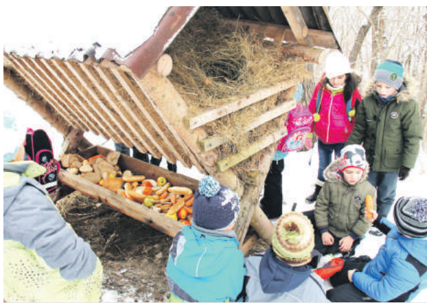
Breznianski lesníci so školákmi krmili lesnú zver.

Spoločná prechádzka spojená s pútavým rozprávaním o okolitej prírode, činnosti lesníkov a poľovníkov, ako aj o lesnej zveri je jednou z ďalších aktivít Lesov mes-