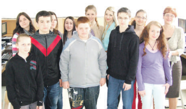
Študenti sa už tešia na spoluprácu so zahraničnými rovesníkmi.

breznianskych žiakov už v druhej polovici marca, kedy na necelý týždeň vycestujú do Portugalska. Približne o rok neskôr sa tí istí študenti predstavia aj v úlohe hostiteľov, keď v Brezne privítame francúzskych a rumunských mládežníkov. Spomenuté dva týždne sú však len malou časťou z celého dvojročného trvania Club Europe. Hlavnou náplňou je totiž pravidelná projektová činnosť, ktorá bude prebiehať formou internetovej komunikácie, tzv. e-twinningu. Žiaci tu budú skúmať rôzne pohľady na zaujímavé európske témy týkajúce sa napríklad životného prostredia, ľudských práv alebo kultúrneho dedičstva. Svoje názory budú konfrontovať so zahraničnými rovesníkmi a okrem zlepšenia komunikačných a prezentačných schopností v cudzom jazyku sa určite dozvedia aj mnoho nového o tradíciách i osobitnostiach iných národov.