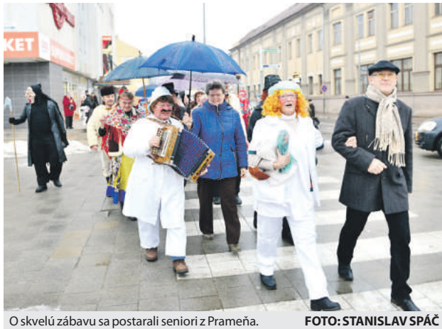
O skvelú zábavu sa postarali seniory z Prameňa.

Fašiangovníci ľuďom spievali, tancovali a dokonca ich aj povykrúcali. Návštevníkom podujatia ponúkli tradičný bursovský program so slovne