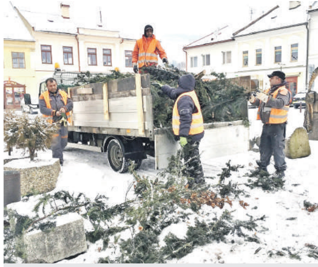
Odstraňovanie nadbytočných okrasných drevín z mestského parku.

Od jeho vyjadrenia závisel aj začiatok a postup prác pri odstraňovaní nadbytočných okrasných drevín z priestoru parku. Až po súhlasnom stanovisku pamiatkarov totiž mesto mohlo začiatkom februára v mimovegetačnom období pristúpiť k výrubu jedovatých tisov obyčajných. „Kriky boli prestarnuté, neforemné