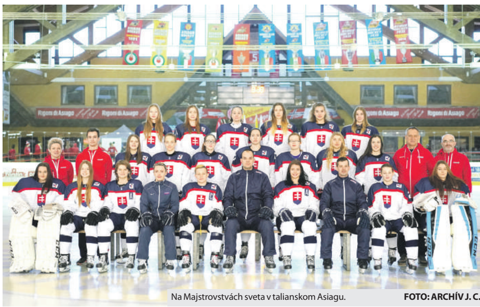
Na Majstrovstvách sveta v talianskom Asiagu.