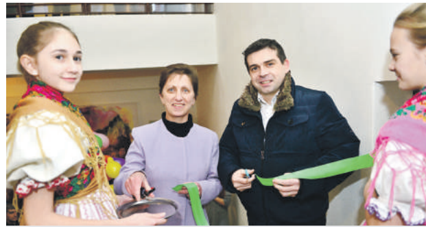
Objekt slávnostne otvorili prestrihnutím pásky.

Základná umelecká škola potrebovala nové priestory ako soľ. Mestu tento problém neostal ľahostajný a ešte vlni začalo s rekonštrukciou vo vlastnom objekte na Nálepkovej ulici. Elokované pracovisko, ktoré poslúži na vyučovanie tanečného a literárno-dramatického odboru, už uzrelo svetlo sveta a slávnostne ho otvorili v prvý februárový štvrtok za účasti zástupcov mesta, školy, jej priaznivcov, rodičov a sponzorov. V krátkom programe sa hosťom predstavili tanečníci a divadelníci, pozreli si tiež videoprojekciu z rekonštrukčných a upratovacích prác nového objektu, v ktorom sa nachádzajú dve tanečné sály, spoločná divadelná sála s malým javiskom, dve