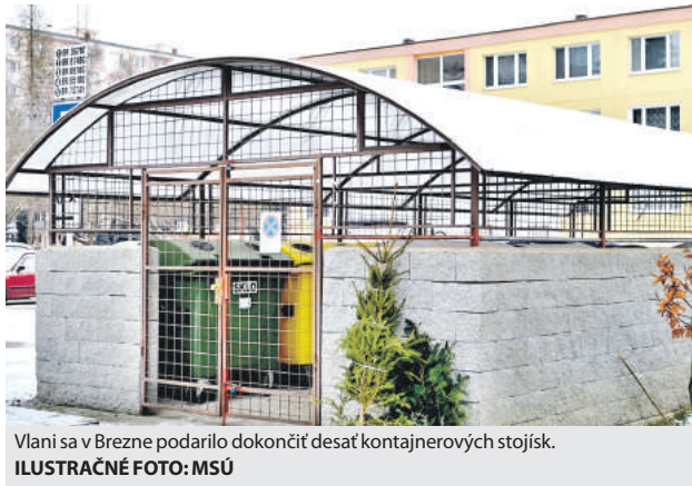
Vlani sa v Brezne podarilo dokončiť desať kontajnerových stojísk.