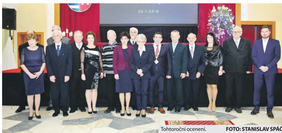
Tohtoročné ocenení.

Pozvaní hostia, ako aj občania mesta sa na slávnostnom mestskom zastupiteľstve zoznámili s pätnástimi príbehmi tých, ktorých ocenili za vynikajúce tvorivé výsledky, rozvoj a zveľadenie mesta. Program spestril vystúpením dievčenský spevácky zbor Cambiar la Múšica, kolektív učiteľov Základnej umeleckej školy v Brezne, ako aj členky Zboru pre občianske záležitosti Človek – človeku mesta Brezna. Na záver slávnostného zastupiteľstva sa za