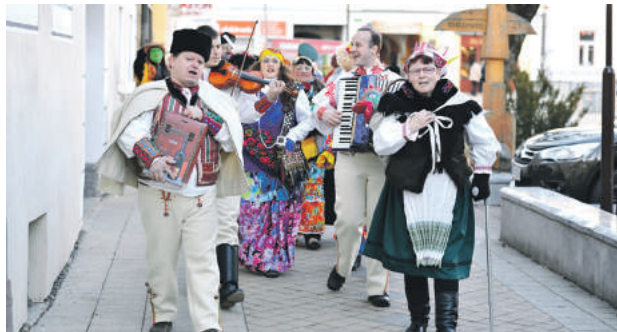
Fašiangy sú ďalšou tradíciou, ktorú sa mestu podarilo pred dvoma rokmi oživiť.

Fašiangy sú ďalšou tradíciou, ktorú sa mestu podarilo pred dvoma rokmi oživiť. Opäť môžete na chvíľu odložiť všetky povinnosti a záver pracovného týždňa si spríjemniť v kruhu známych na námestí. O pravú fašiangovú zábavu v piatok 9. februára sa postará asi päťdesiatka členov denného centra Prameň, ktorí to aj tohto roku vzali pevne do