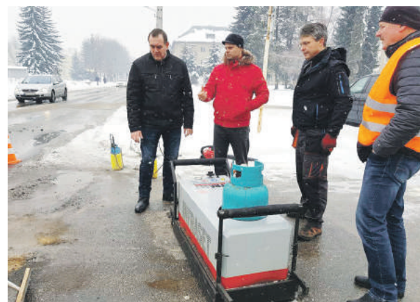
Opravovať výtlky bude možné v akomkoľvek počasí.

podmienkach, keďže cesty sú po zime značne poškodené. Jedno takéto zariadenie nám už predstavili a s výsledkom sme spokojní. Do veľkého výtlku pri pošte (asi 1 m 2 ) išlo asi 50 kg zmesi a v tomto počasí bol takmer za pol hodinu opravený. Náklady s pracovnou silou sa počítajú od 5 do 10 eur, podľa veľkosti výtlku, čo je pre nás prijateľné,“ povedal primátor. Podľa jeho slov, pracovať s týmto zariadením sa dá do teploty -7 °C, čo je veľkou výhodou. „Techniku chceme obstaráť cez elektronické trhovisko a v priebehu dvoch až troch týždňov by mohla byť na technických službách. Cena je asi 12 tisíc eur za celý set s výbavou a príviesnym vozíkom,“ uzavrel Tomáš Abel. (md)