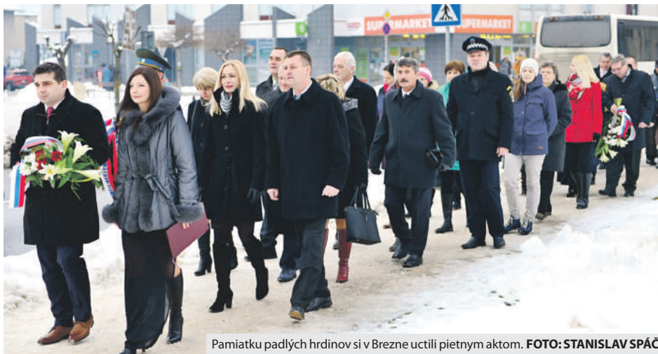
Pamiatku padlých hrdinov si v Brezne uctili pietnym aktom.

Na pietnom akte v piatok 26. januára si účastníci položením vencov a slovami vďaky uctili pamiatku tých, ktorí za našu slobodu obetovali to najcen-