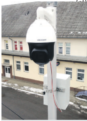
Kamera na autobusovej stanici.