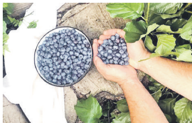
Zmenila svoju ovocnú záhradu na Čučoriedkovo.